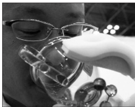
Olimpiadoje varžėsi 68 valstybių atstovai.

Vilnius , liepos 29 d. (ELTA) – Lietuvos jaunieji chemikai iš Japonijos sugrįžta su visų spalvų medaliais. Mūsų šalies atstovas pelnė ir garbingiausią pirmąją vietą.