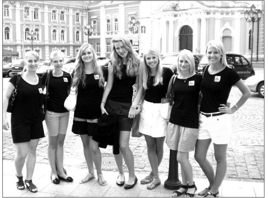
Labdaros programos merginos prieš susitikant su JAV ambasadore Lietuvai Ann Derse.