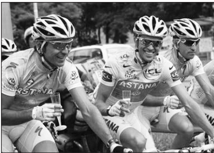
Alberto Contador viduryje.

Nuo 15-ojo iki pat paskutiniojo 20-ojo varžybų rato pirmavęs šių metų „Tour de France“ nugalėtoju antrą kartą iš eilės tapo praėjusių metų čempionas Alberto Contador. 27-erių metų ispanas „Tour de France“ čempionu tapo jau trečią kartą (2007, 2009, 2010).