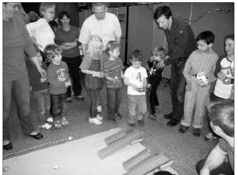
Margučių ridinėjimo varžybos.