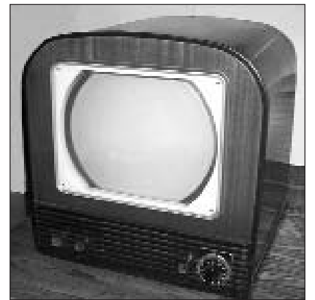
D. Janutos nusikaltėlė televizija.

Pasiremiant aukščiau minimu žodynu, čia matomoje nuotraukoje yra ne televizija, bet televizorius.