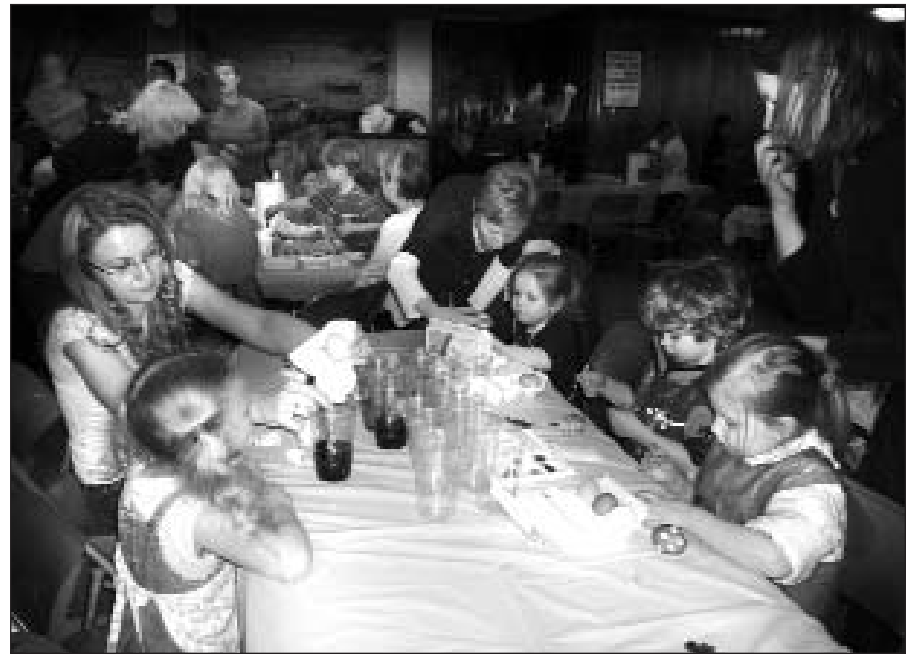
Smagu marginti margučius.