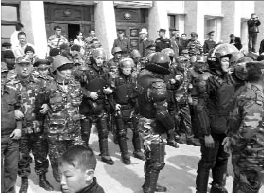
Gyventojai piktinasi įsigalėjusiu skurdu, kylančiomis kainomis ir valdininkų korupcija.

Vilnius , balandžio 7 d. (BNS) – Visoje Kirgizijoje, kur kilo opozicijos protestuotojų ir milicijos susirėmimai, įvesta nepaprastoji padėtis, paskelbė vyriausybės vadovas Danijar Usenov. Balandžio 7 d. Kirgizijos sostinėje kilus riaušėms, žuvo mažiausiai 12 žmonių. Politiniai neramumai Kirgiziją krečia nuo kovo pradžios: gyventojai piktinasi įsigalėjusiu skurdu, kylančiomis kainomis ir valdininkų korupcija.