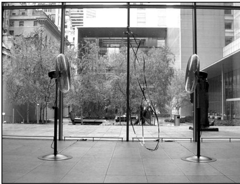
Žilvino Kempino „Dviguba O“ MoMA.

zija, skulptūros, kurios iš tikrųjų nėra. Užtenka išjungti ventiliatorių, ir viskas baigiasi. Bet kambarys užpildytas tikrai poetiškos, besvorės instaliacijos. Retai pasiseka taip padaryti, turint tiek mažai medžiagos. Minimalizmas niekada nesvajuoja taip toli nueiti. Gal todėl Ž. Kempinas laimėjo Calderio prizą ir įgijo privilegiją dirbti Calder Atelier.