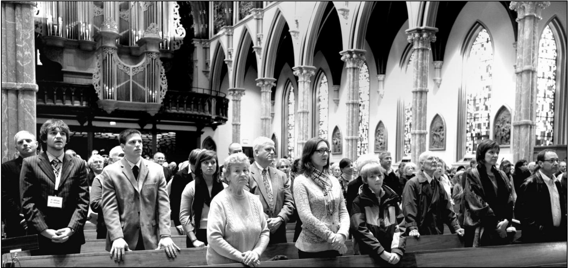
Ateitininkijos 100-mečio iškilmingos šv. Mišios Čikagos Šv. Vardo katedroje.