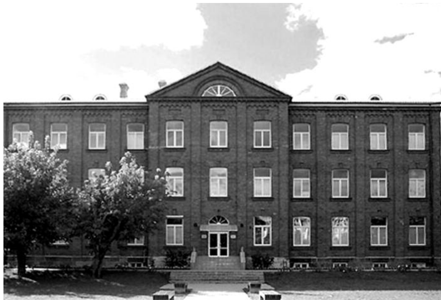
Marijampolės Marijonų gimnazija.