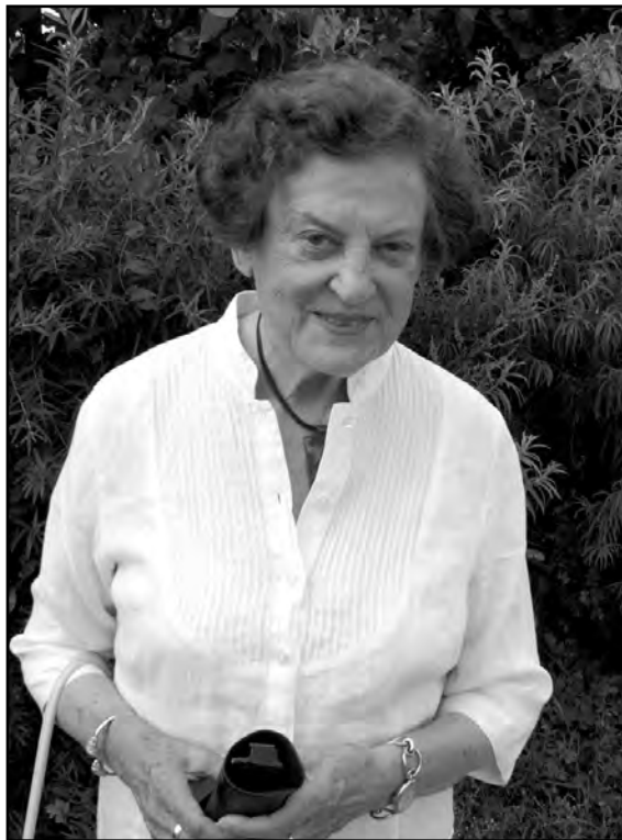
M. Remienė Lietuvoje.

– Taip jau susiklostė, kad buvau labai užimta. Be jau minėtų iškilmių Širvintose, kur ne tik priėmiau apdovanojimą, bet ir bažnyčioje pasveikinau vietos abiturientus, kurie ištis puikiai mokosi ir įstoja į aukštąsias mokyklas, dar turėjau gražų susitikimą Vilniuje, Radvilų rūmuose, kur susirinko nemažas būrys mano pažįstamų, ir ne tik iš Lietuvos, bet ir iš Amerikos. Čia dalyvavau kaip parodos „Dovana nepriklausomai Lietuvai“ meno mecenatė, kur rodomi ir mano Lietuvai