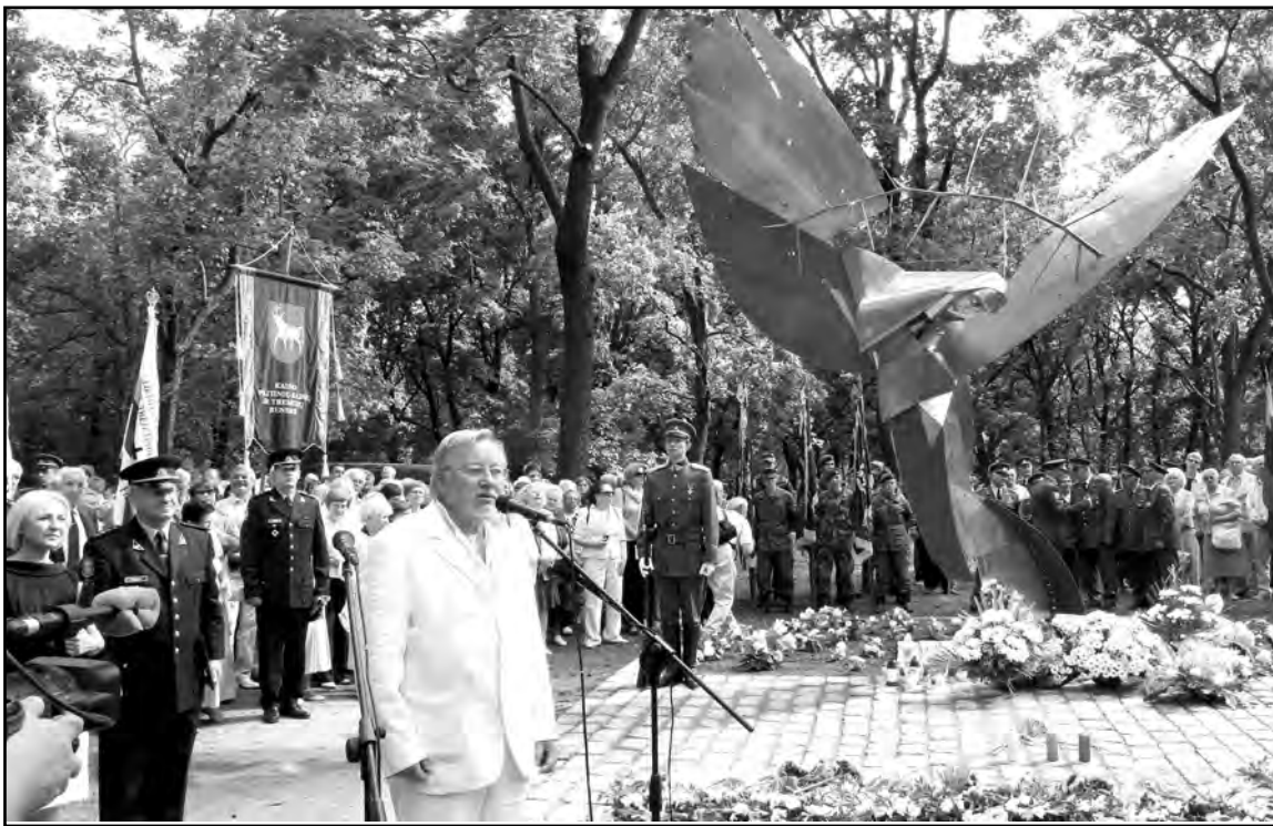
Kalba profesorius Vytautas Landsbergis.