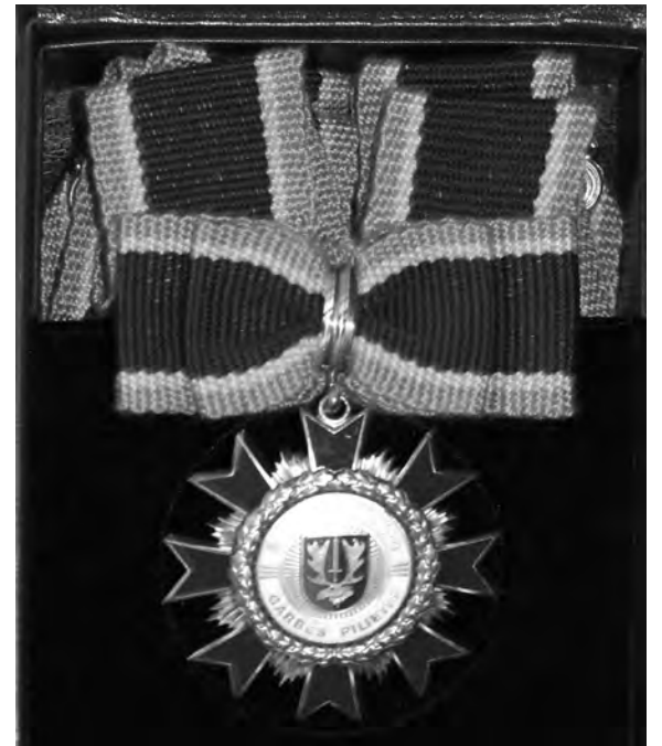
Garbės piliečio regalias.