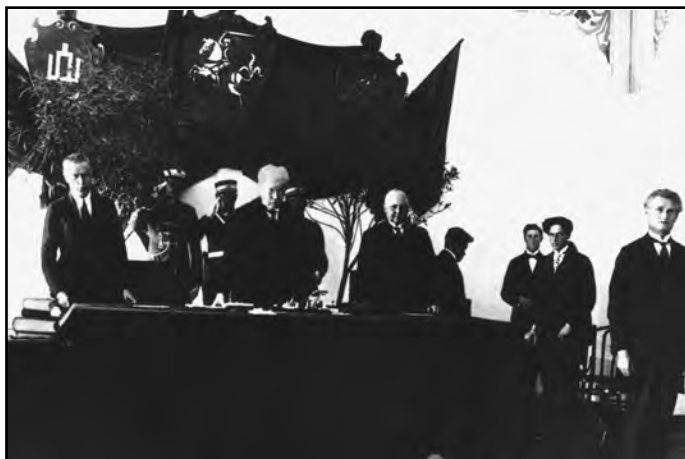
Lietuvos Respublikos prezidento Kazio Griniaus priesaika. Kaunas, 1926 m.