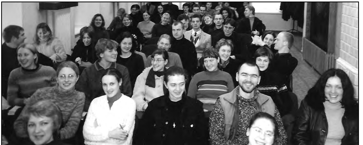
Dėstytojo žvilgsnis nuo pulsto į teologijos studentus Vytauto Didžiojo universiteto auditorijoje. Priekyje – pasauliečiai, gale – seminaristai.