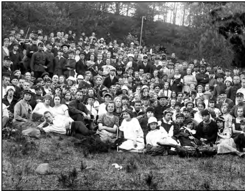
Vilniaus moksleiviai išklyjoje prie Verkių.

Senoje priekario nuotraukoje matome vilnie-