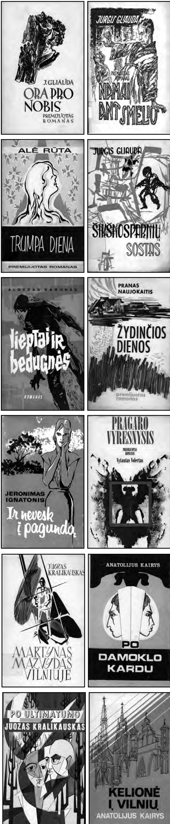
Dalis „Draugo“ išleistų premijuotų romanų.