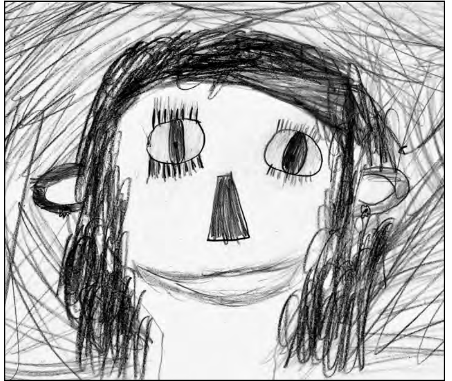
Autorės portretas. Dailininkas – Povilas (8 m.).

Senelės dvasia lapijoj tupėtų, kirstų kiekvie-