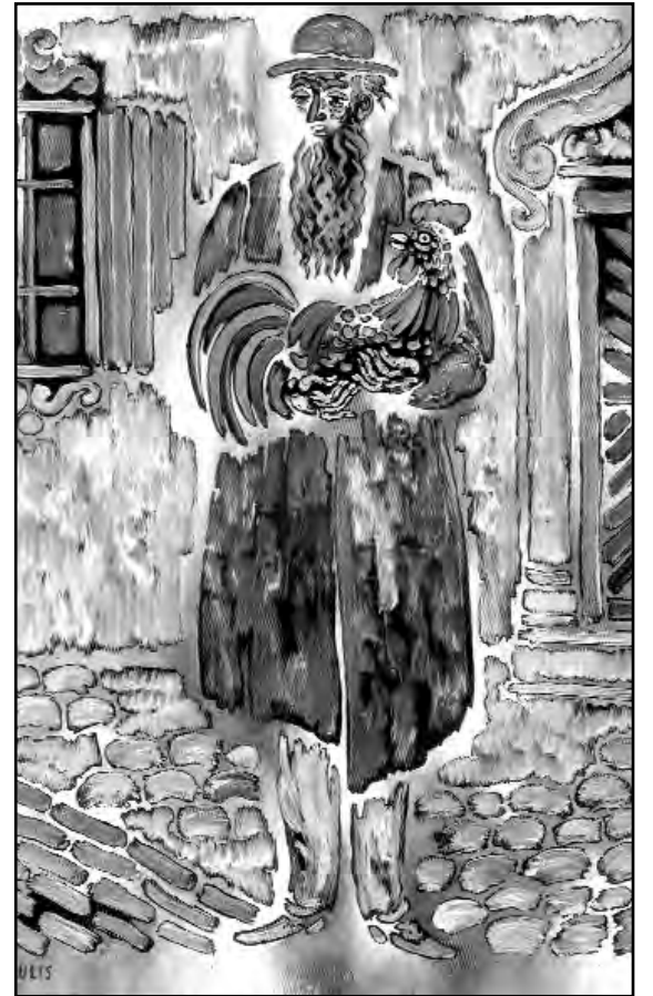
Vyras su gaidžiu.