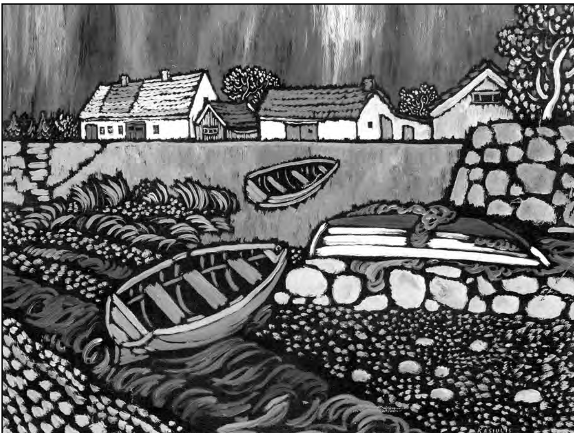
Švedija. XX a. 6 dešimtmetis. Drobė, aliejus, 60x73 cm