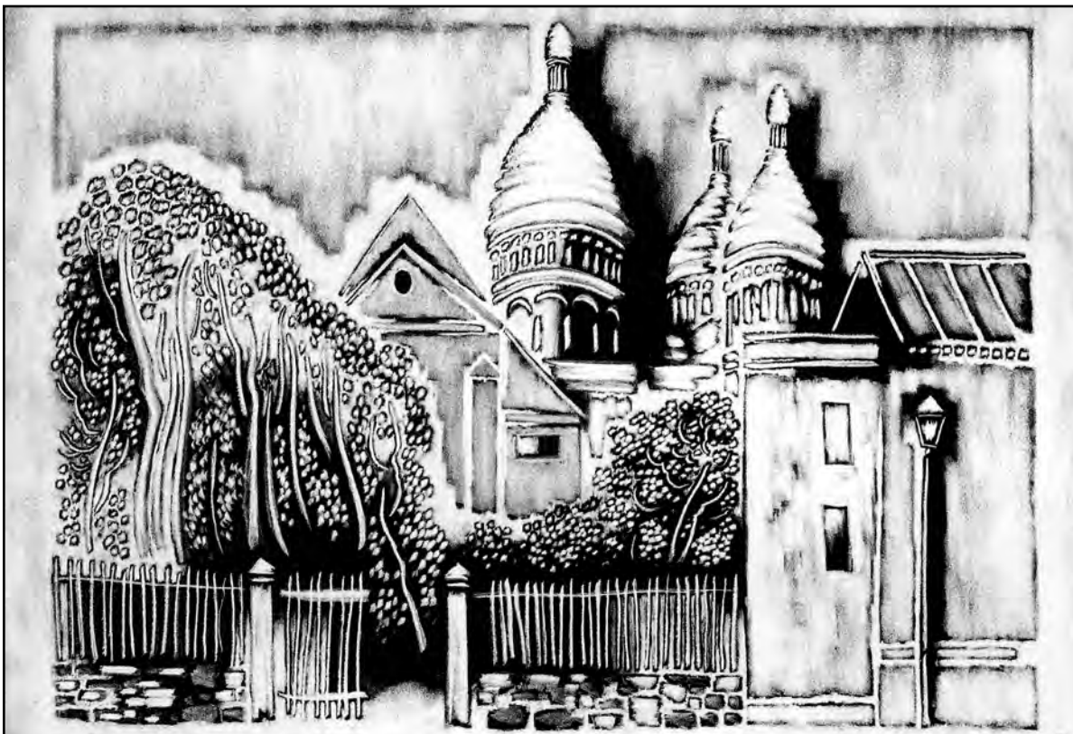
Paryžius. Sacré Coeur bažnyčia ant Monmartro kalvų. XX a. 8 dešimtmetis. Popierius, litografija, 44,4x 64 cm