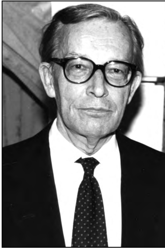
Ambasadorius Stasys Lozoraitis

Šie pavyzdžiai rodo, kaip buvo dirbama plečiant ir stiprinant tarpvalstybinius ekonominius ryšius. Antra svarbi sritis, anot tos ataskaitos, buvo „privatūs komerciniai kontaktai bei prekybos ryšių tarp konkrečių JAV ir Lietuvos įmonių skatinimas ir stiprinimas.“ Norėčiau pacituoti ištrauką apie tų ryšių skatinimą: „Užklausimų bei prašymų skaičius yra labai didelis, kur kas didesnis negu ambasada gali patenkinti. Per nepilnus pa-