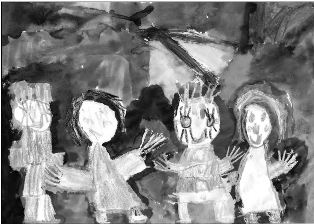
Mūsų šeima. Piešė leva (6 m.)

Ir vaikas, liovėsis verkti, pajuto, kad jo širdelė pagaliau saugi. □