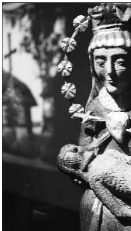
Paryžiuje pristatoma Lietuvos kryždirbystės simbolika.

Paryžius, birželio 10 d. (ELTA) – UNESCO (Jungtinių Tautų švietimo, mokslo ir kultūros organizacijos) būstinėje Paryžiuje atidaryta Lietuvos kryždirbystei skirta paroda „Gyvybės medis. Lietuvos kryždirbystė ir simbolika“. 2001 m. UNESCO Lietuvos kryždirbystės tradiciją pripažino Žmonijos žodinio ir nematerialaus paveldo šedevru.