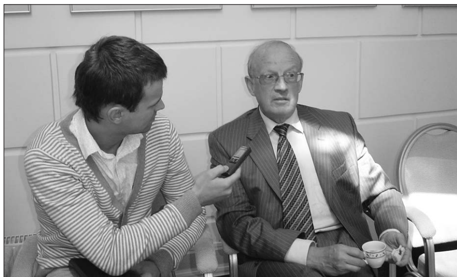
Interviu duoda žinomas Rusijos politologas ir analitikas Andrej Piontkovskij.