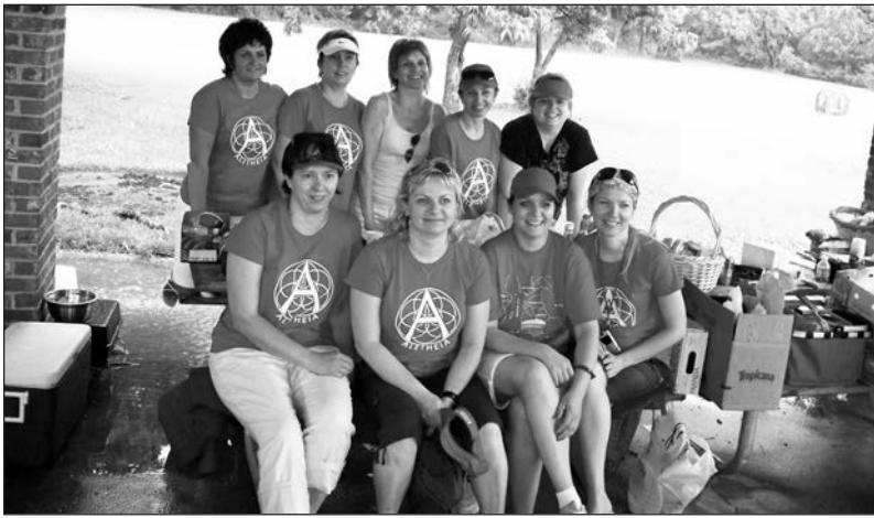
Grupelė šauniųjų „Alatėjos“ moterų.