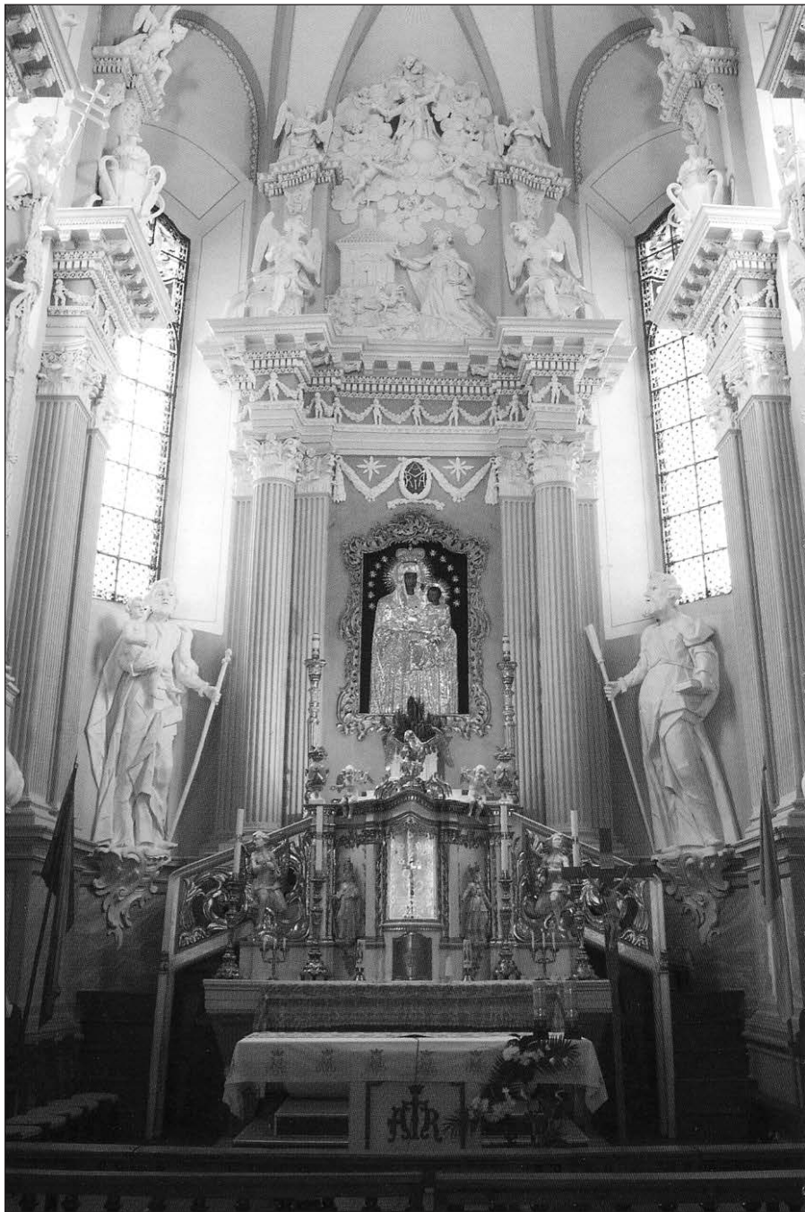
Šiluvos bazilikos didysis altorius.