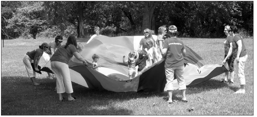
Smagu ir vaikams, ir mamytėms.