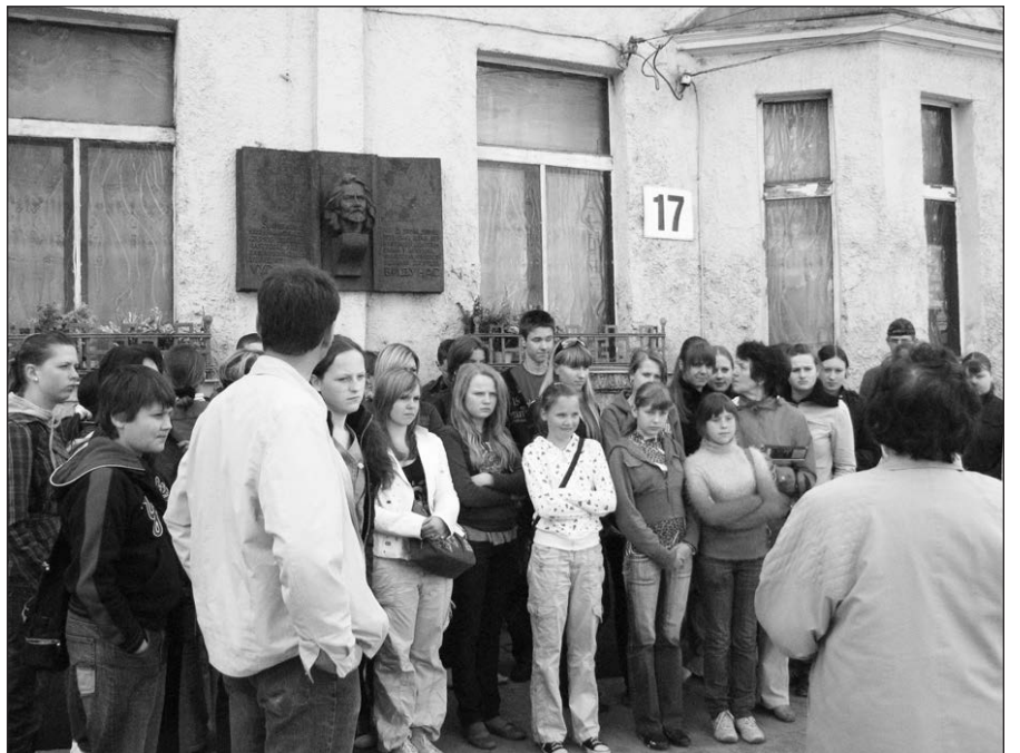
Tilžėje prie namo, kuriame gyveno Vidūnas.