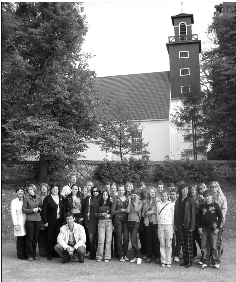
Šiauriečiai ir ragainiškieji Tolminkiemyje.

Pavargę, bet pilni įspūdžių, patyrę susitikimo džiaugsmą jie pasiekė namus.