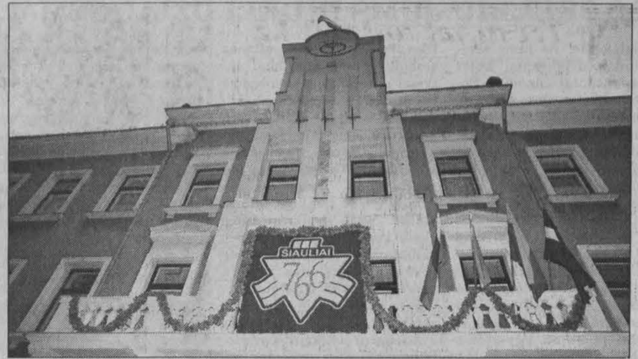
Rugsejo mėnesio pabaigoje Šiaulių miestas tris dienas šventė savo 766-ąjį gimtadienį. Šiaulių miesto istorija skaičiuojama nuo 1236 m., kai Saulės mušyje lietuviai ir latviai nugalėjo kalavijuočių ordiną. Tai buvo iškovota istorinė pergalė, įtvirtinusi Lietuvai valstybingumą.