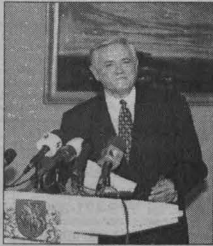
Prezidentas Valdas Adamkus