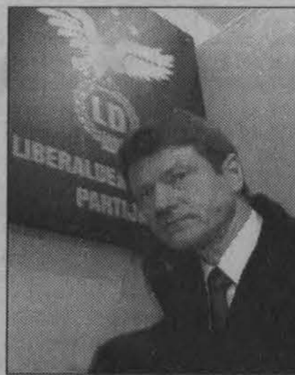
Liberaldemokratų vadovas Rolandas Paksas

Pasak Z. Vaigausko, oficialūs rezultatai turėtų būti paskelbti gruodžio 27 dieną, o gruodžio 28 dieną prasidės oficiali antrojo prezidento rinkimų rato kampanija. VRK pirmininko teigimu, vėl bus organizuojamas balsavimas paštu, kuris turėtų prasidėti gruodžio 31 dieną, likus beveik savaitei iki rinkimų.