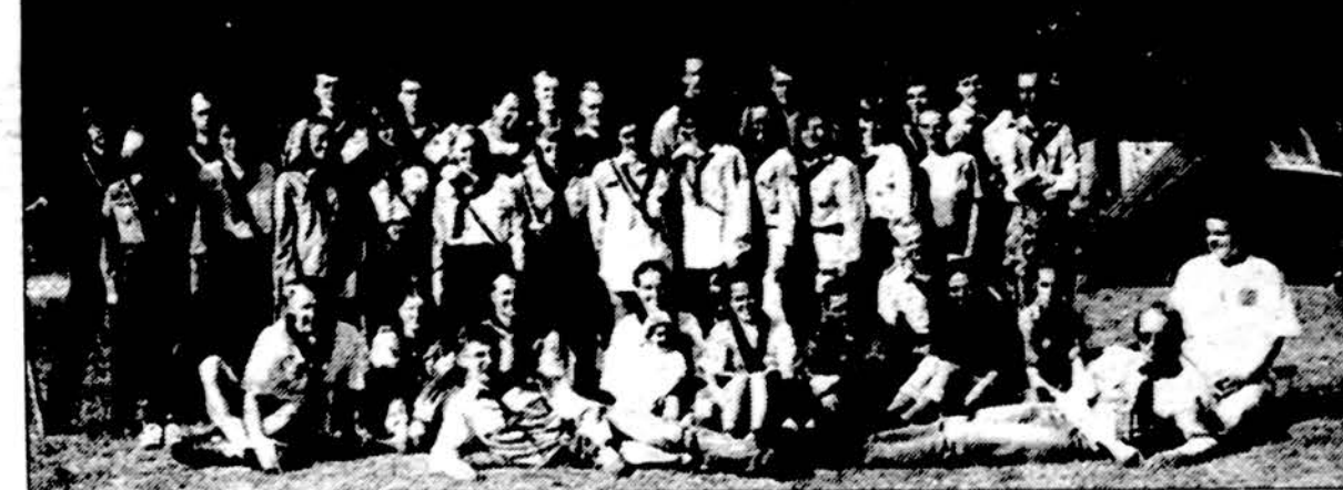
„Academia 1999“ stovyklos bendra nuotrauka.

Dabnai esu klausiamas, ar kelionė patiko ir kodėl aš ten vykau. Kad patiko tai klausimo negali būti. Negaliu įsi-vaizduoti geresnio būdo pama-tyti savąjį kraštą, sutikti liau-dies žmones, patirti miškų grožį, pušynų ir samanų kvapą bei ramybę. Vykau ten ne tik patyti su mūsų sesėmis ir broliais akademikais Lietu-voje, bet svarbiau, jų akimis pamatyti Lietuvos kampelių, išgirsti jų balsus, bent kiek suprasti jų rūpesčius ir paju-s-ti, kad esame vieningos idėjos vedami. Visa tai išsipildė la-biau negu drįsau tikėtis. Visa tai liks manyje amžinai. Ad meliorem! fil. Rimantas Griškėlis