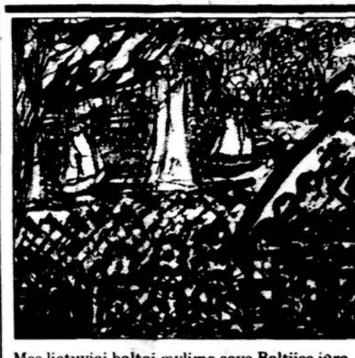
Mes lietuviai baltai mylime savo Baltijos jūrą.