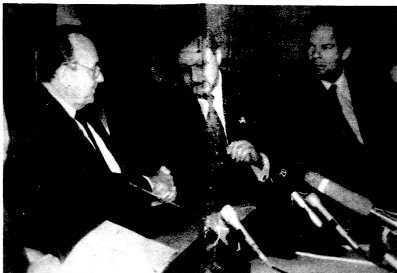
Kai Vokietijos Užsienio reikalų ministras Hans-Dietrich Genscher, kairėje, vizitavo Lietuvos Respublikos prezidentą Vytautą Landsbergį, įvyko spaudos konferencija, kurioje dalyvavo ir Lietuvos Užsienio reikalų ministras Algirdas Saudargas, dešinėje. Svečias iš Vokietijos pažadėjo paramą atsisteigiančiai Lietuvos Respublikai. Žadėjo atsistoti ir ekspertų bei specialistų padėti suorganizuoti gerą administracinio valdymo sistemą.