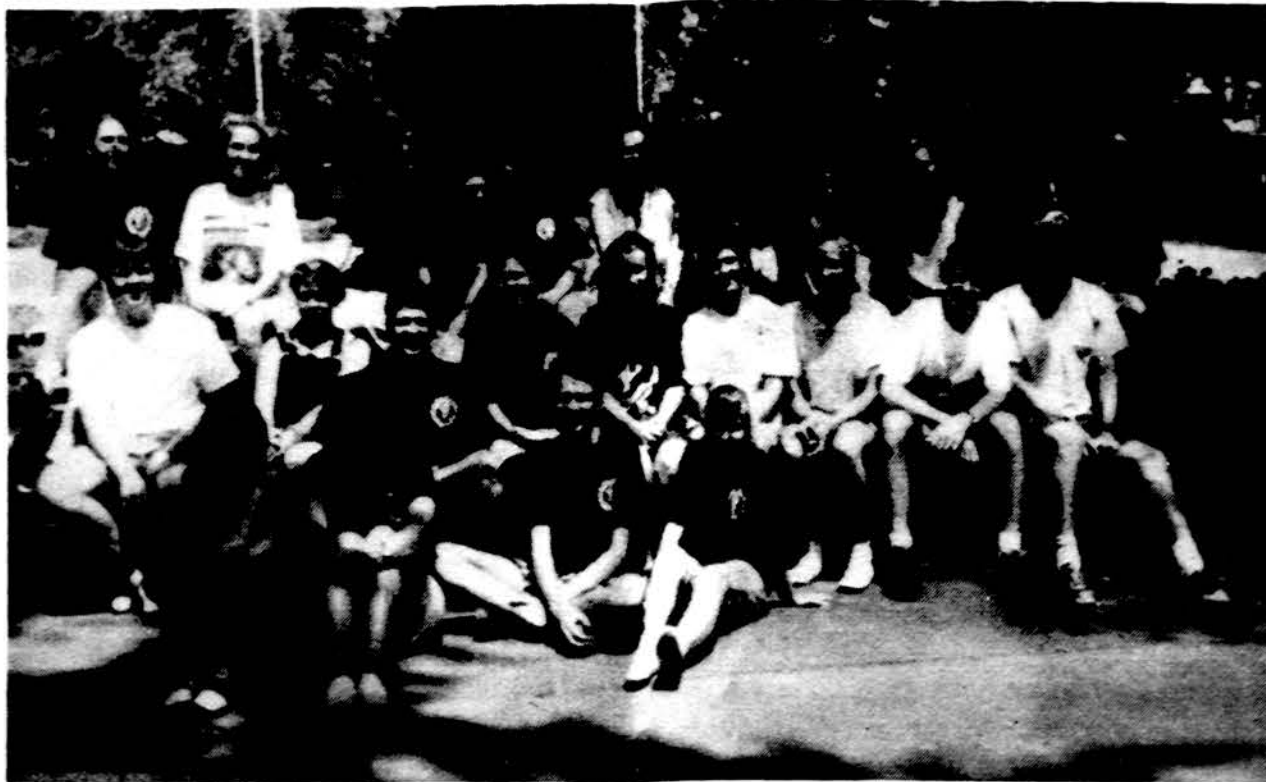
Chicago Prez. A. Stulginskio moksleivių ateitininkų kuopa iškyloje į „Great America“.