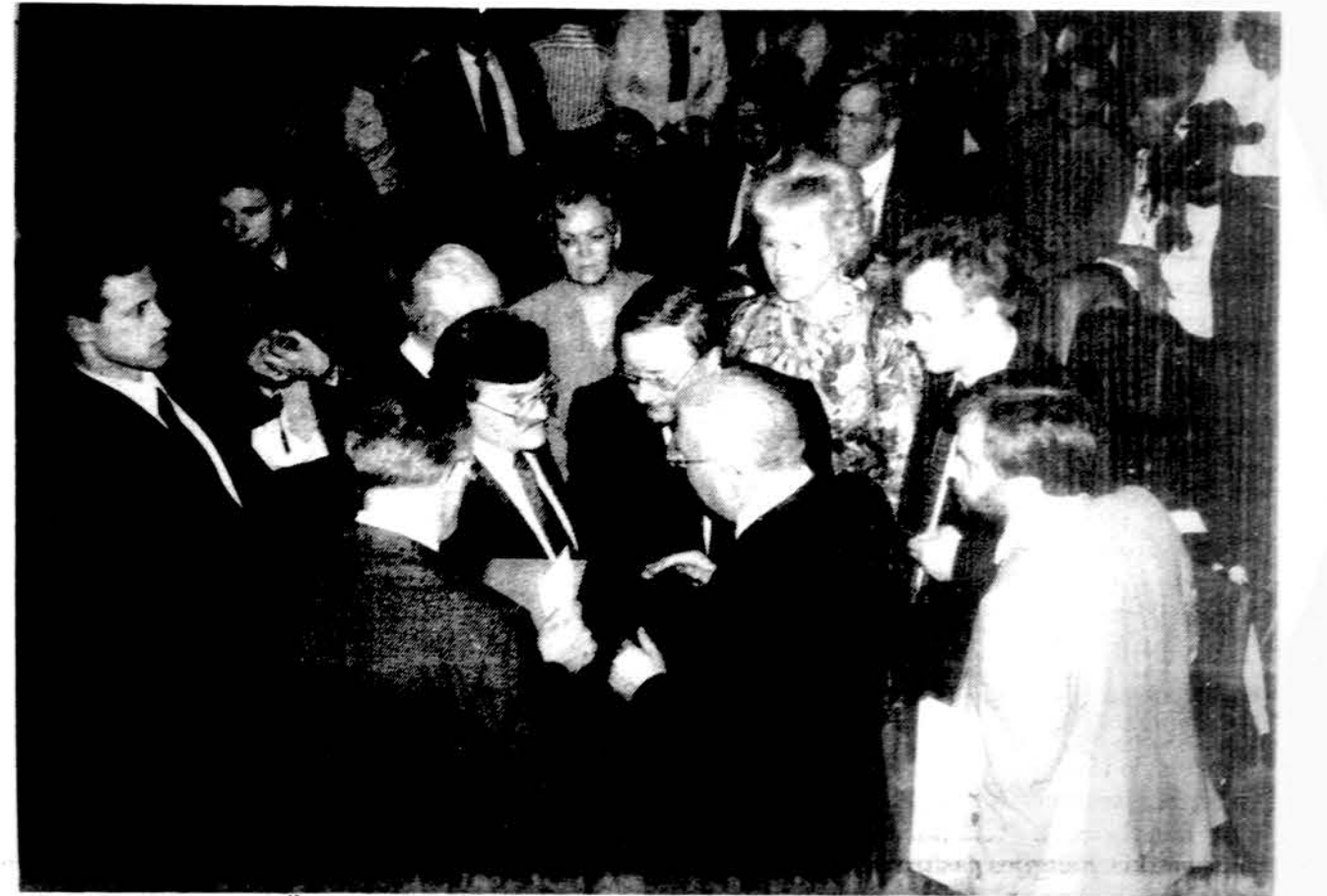
Lietuvos Aukščiausiosios Tarybos pirm. Vytautas Landsbergis Californiais lietuvių tarpe.