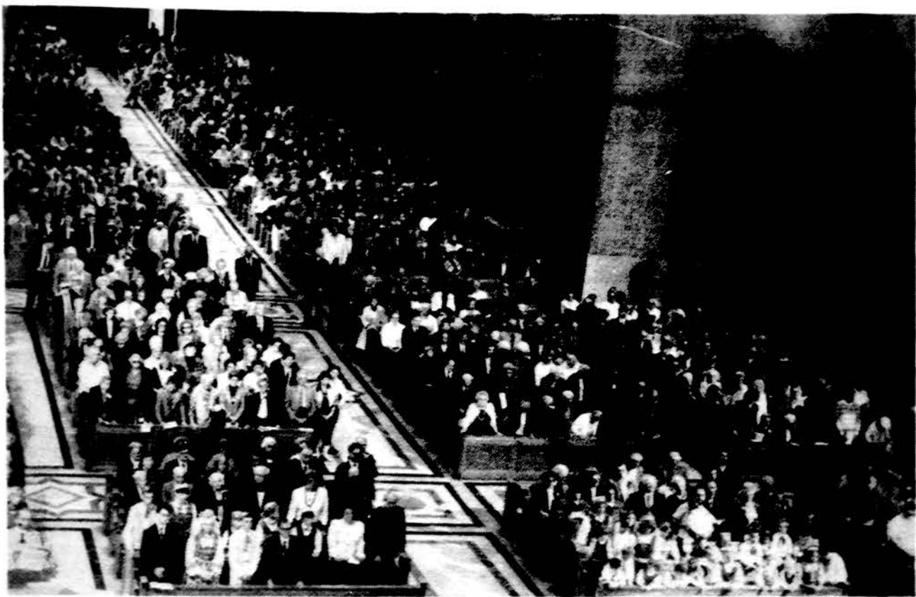
Iškilmingas Šiluvos koplyčios sidabrinės sukakties minėjimas pamaldomis, kuriose buvo apie 3000 lietuvių.