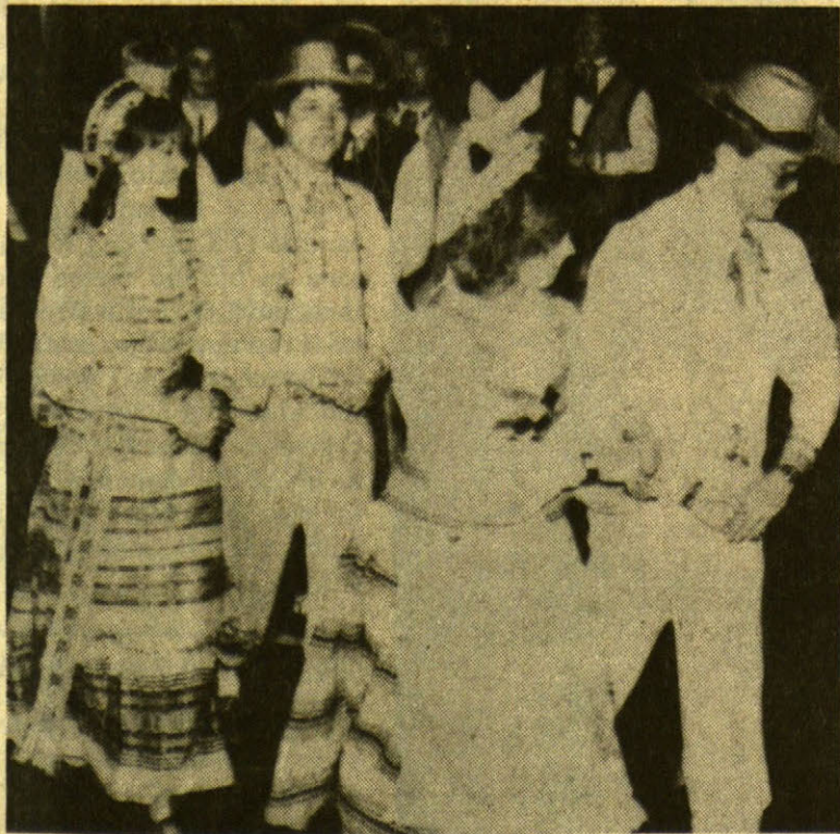
Hartfordo tautinių šokių ansamblis atlieka tautinius šokius New Britain parapijos salėje.