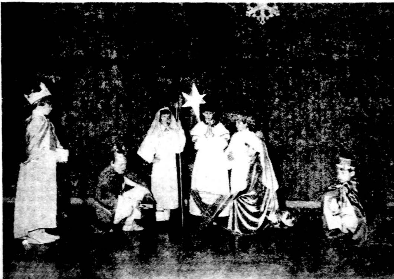
Gyvasis paveikslas Kr. Donelaičio mokyklų kalėdinėje programoje gruodžio 20 d.