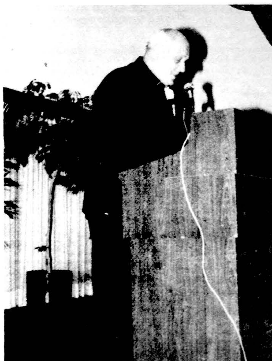
Arkivyskupas Paulius Marcinkus kalba Šv. Antano parapijos 75-rių metų gyvavimo minėjime.