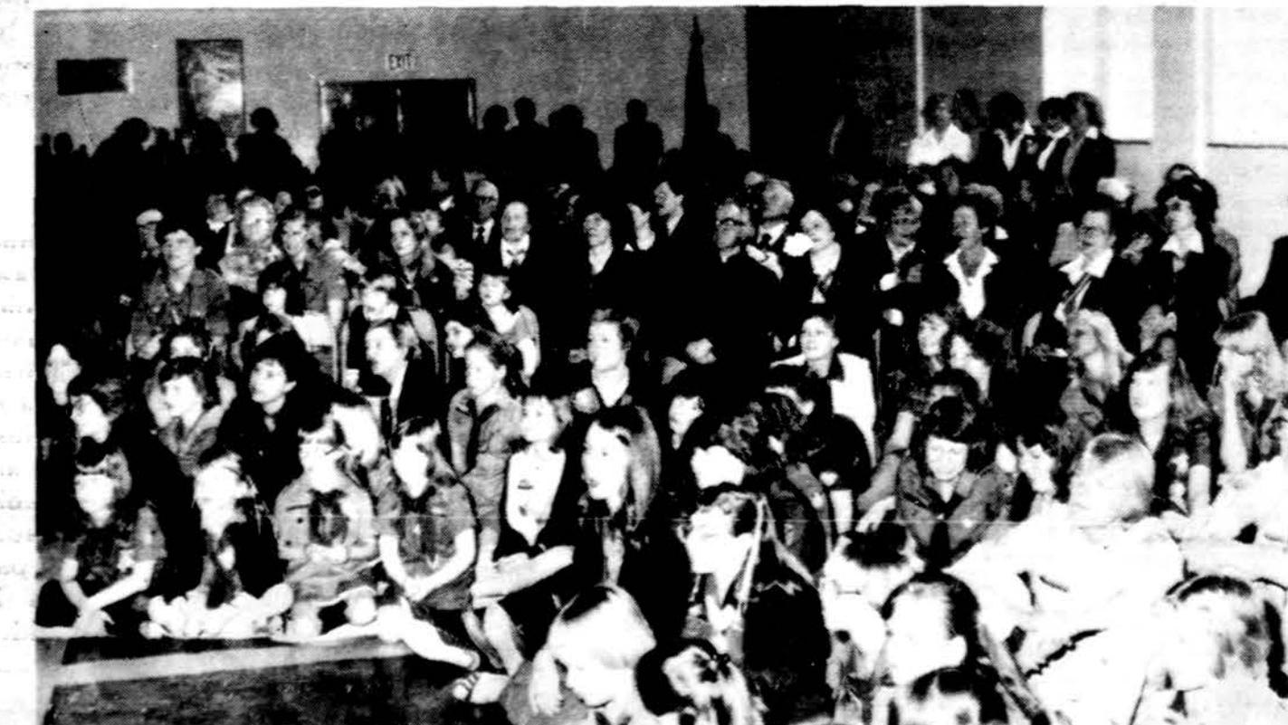
Šv. Jurgio sveigos Chicagoje dalis dalyvių.