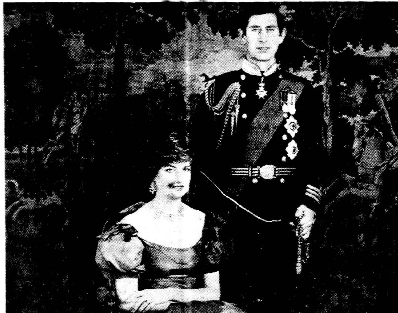
Britanijos sosto įpėdinis, Valijos princas Čarlis ir jo nuotaka Valijos princesė, buvusi Diana Spencer, savo vestuvių nuotraukoje, kurią pernai padarė lordas Snowdon. Princas pasipuošęs