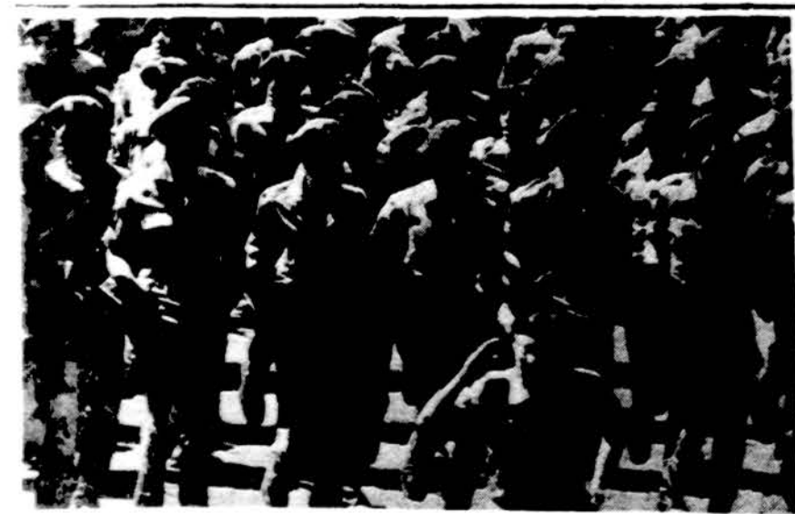
Egipto parašiatininkai karinio parado metu

Blogi pasėjusi galva išsėsis po žeme, o jos gėdingos idėjos pasiliks vaikščioti ant žemės. Arklio saugokis iš užpakalio, karvės iš priekio, o pikto žmogaus iš visų pusių. Lietuvių priežodis