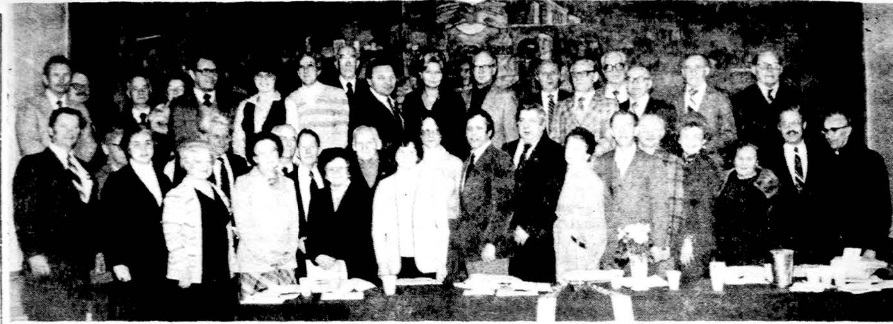
Iš LB Vidurio Vakarų apygardos ir apylinkių valdybų atstovų suvažiavimo Chicagoje 1981 m. sausio 11 d. Dalis suvažiavimo dalyvių.

× Akiniai siuntimui į Lietuvą Kreipkitės į V. Karosaitę - Optical Studio, 2437 1/2 W. Lithuanian Plaza Ct. (69th St.), Chicago, Ill. 60629. Telef. - 778-6768. (sk.)