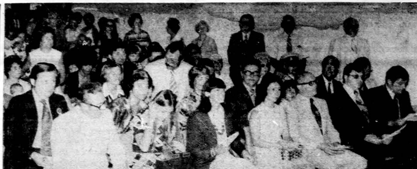
Dalis lietuvių, dalyvavusių Liet. namų atidarymo iškilmėse, Clevelande.