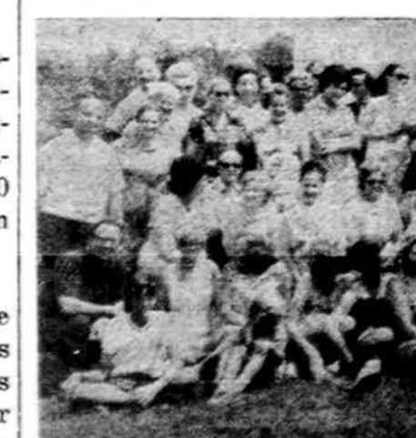
Lietuvių Fronto bičiuliai ir svečiai paskutinę dieną savo suvažiavime ir studijų dienoje Danavos stovykloje.