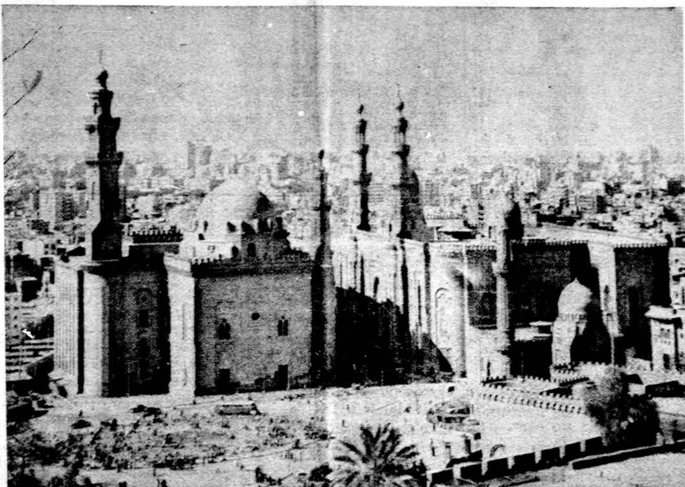
Kairas. Senosios mečetės ir naujoji miesto statyba

BERLYNAS. — Valstybės departamento delegacija lankosi Rytų Berlyne ir veda pasitarimus su Rytų Vokietija dėl diplomatinį santykių užmezgimo. Derybos truks apie savaitę.