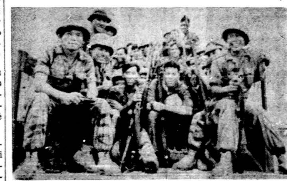
Pietų Vietnamo pėstininkai. Karas ir pasibaigė, ir nepasibaigė, bet karių moralė aubėta

WASHINGTONAS. — Civilinės aviacijos taryba kaltina sovietų Aeroflot agentūrą, kad ji, kuri pakaitom su Pan American vežioja keleivius tarp New Yorko ir Maskvos, ne pagal susitarimą vilioja keleivius ir veža už pigesnę sumą, negu buvo susidereta.