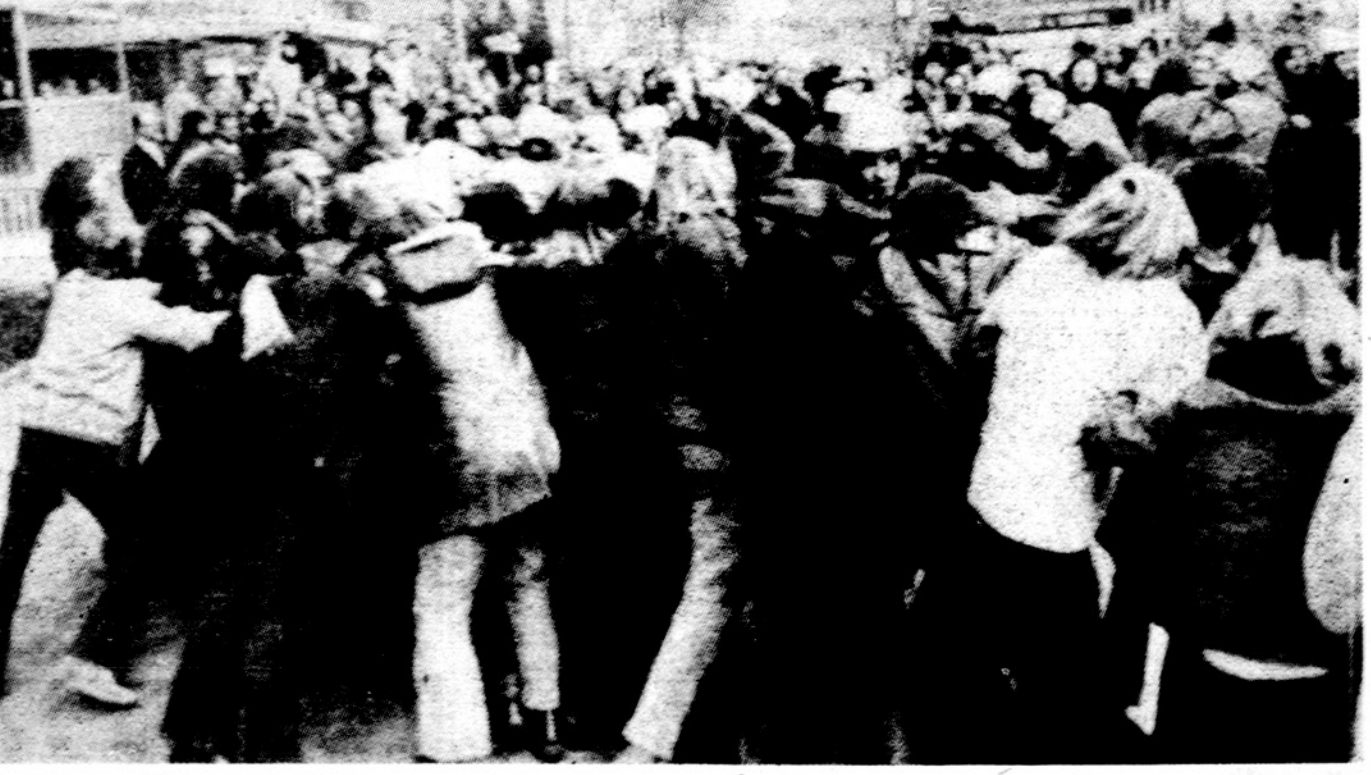
Frankfurto (Vak. Vokietijoje) universiteto studentai susitreikavo, reikalaudami pakeisti jiems nepalankią egzaminų tvarką