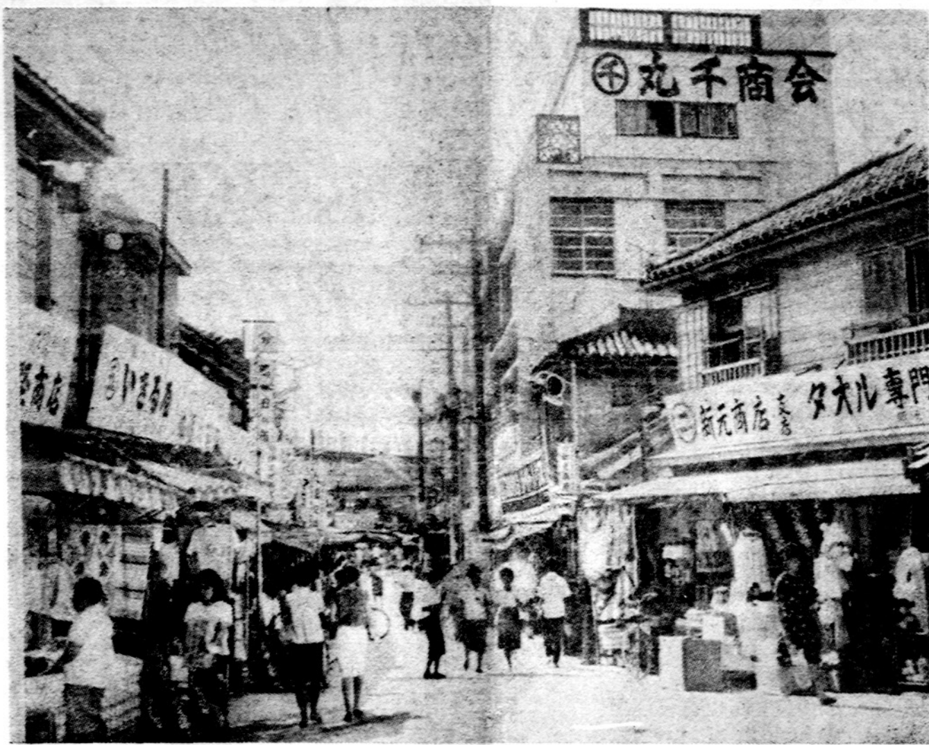
Okinawos miestas Naha. Okinawa gegužės 15 grįžta Japonijai

TOKIJO. — Japonijos policija kalnuotoje apylinkėje 10 dienų laikė apsupusį grupę ginkluotų revoliucionierių. Kai jie pasidavė, jų vadas prisipažino, kad jis liepė 8 iš savo grupės sušaudyti, kam jie rodė pasidavimo ženklų ir norėjo kapituoluoti. Policija nužudytuosius rado jau pakastus žemėje. Revoliucionieriai buvo studentai, priklausę kraštutinių kairiųjų "jungtinei raudonajai armijai".