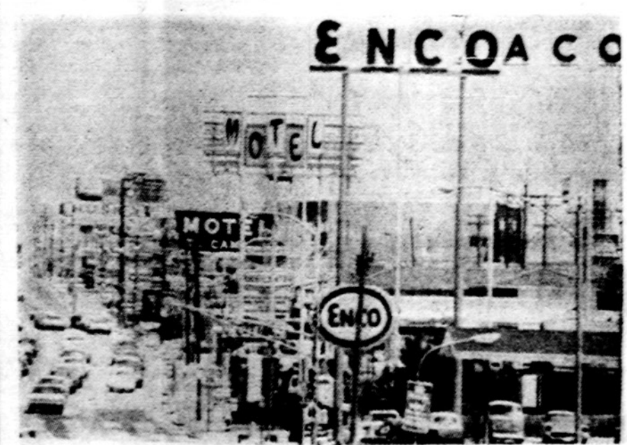
Miestai virsta biuriomis džunglėmis. Denverio priemiesčiai ešksta neskoningose reklamose

SAIGONAS. — P. Vietnamo 15,000 karių invazija į Kambodiją vyksta sėkmingai. Pranešama apie nedidelį priešų pasipriešinimą.