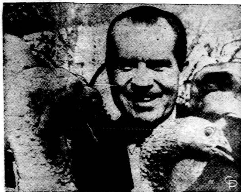
Tautinė kalakutų auginimo draugija apdovanojo Padėkos dienos proga prez. Nixoną pora kalakutų, kurie sveria po 40 svarų.

MASKVA. — Mėnulio uoliena, pargabenta Apollo 11 astronautų, yra išstatyta Maskvoje ir susilaukė didelio gyventojų susidomėjimo. Ji bus gabenama ir į kitus S Rusijos miestus.