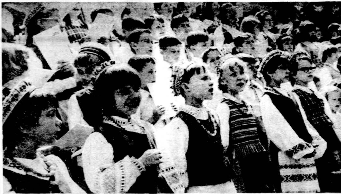
Jaunieji dainininkai — mūsų visų pasididžiavimas. Chicago's liet. moksleiviai ruošiasi koncertui, kuris buvo lapkričio 23 d. Gage Parko salėje.