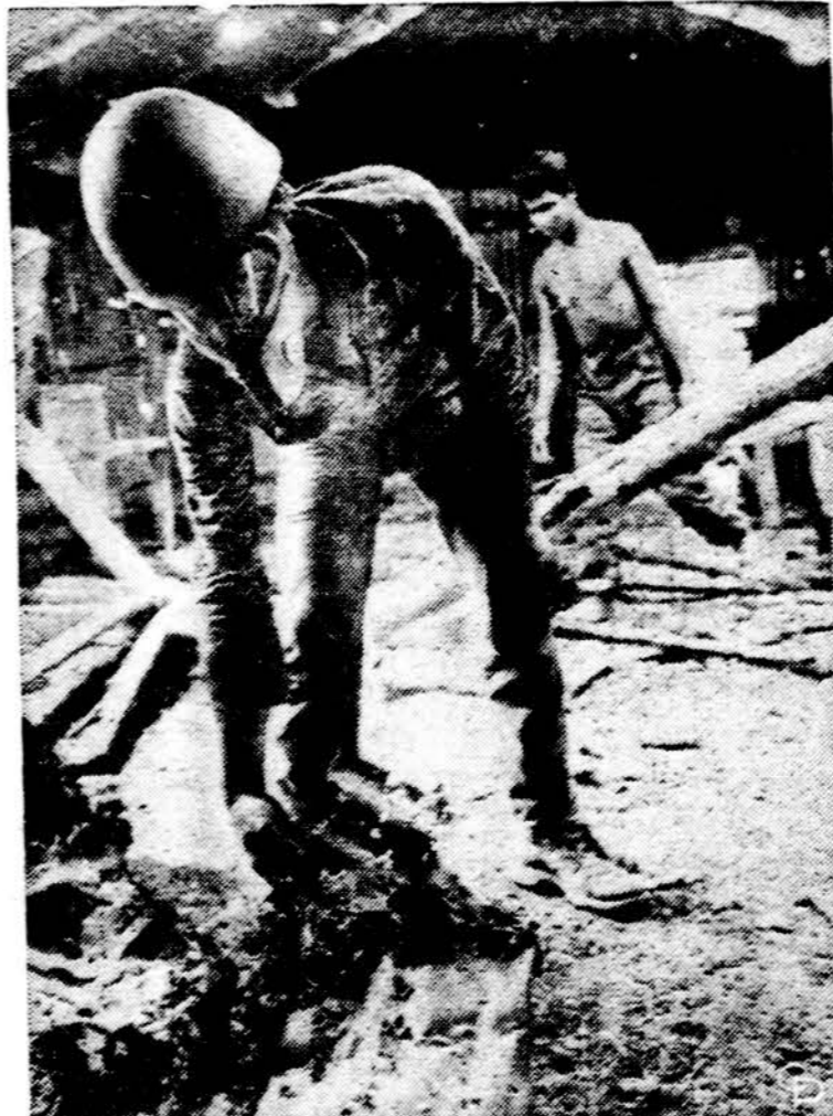
Amerikos specialiųjų dalinių kariai, išmušus priešą iš Bu Brang, P. Vietname, tikrina ar nėra palikta minų ar kitokios rūšies sprogstaųjų ar cheminių medžiagų.

Išitikinome, - ir ne vieną kartą, - kad daug grynakraujų naujų ateivių, vos išmokusių angliskai dienraštį paskaityti, atsakė ryšius su LB, su visuomene. Tuo tarpu atėjo jaunų žmonių iš ankstesnių ir vėlyvesnių imigrantų šeimų, jau vargstančių lietuvių kalba, bet noriai įsipaigojančių ir daug atliekančių. Patyrėme, kad ne tik pradingsta kai kurios jaunos lietuviškos šeimos, bet jos dažnai ir tėvus nežinon nustraukia: pasodina juos savaitgaliais prie vaikų, o patys blaškosi po amerikietiską aplinką. Bet yra mišrių šeimų, labai gražiai mūsų tarpan įsijungusių. Štai lietuvių dėsto šeštadieninėje mokykloje, o jos vyras, akademiškas amerikietis, atvyksta į visus tuos mūsų suėjimus, kuriuose jis bent šiek tiek orientuojasi. Antroji jauna moteris dirba su skautėmis, o jos vyras, taip pat akademiškas amerikietis, net Vasario 16 minėjimo komitetam įeina. Jaunimo stovyklą vadovo žmona, gerai lietuviškai iš-