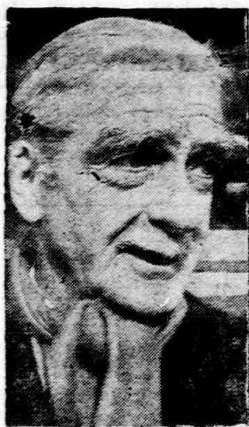
Lordas Avon, geriausia žinomas kaip Anthony Eden, buvęs Britanijos ministras pirmininkas, atvyko į Lealey Bostono klinikas sveikatos patikrinimui.

"Todėl mes manome, kad Sovietijos vyriausybė dabar, prisidėgdama Europos Saugumo sutarties derybų skraiste, bando išgauti nuolatinį pripažinimą dabartinėms savo sienoms. Mes, tačiau, tikimės, kad Jungtinės Karalijos vyriausybė artėjančiuose paskaitimuose dėl Europos saugumo seks Atlanto chartos dvasia ir aiškiai tars, kad Lietuvos aneksija prie Sovietų Sąjungos nebus sankcionuota. Toliau, mes tikime, kad Jungtinės Karalijos vyriausybė pareikalau, kaip išankstinės sąlygos konferencijai, kad būtų panaikintas 1939 metų Sovietų - Nacių Nepuolimo paktas su visais jo slaptaisiais protokolais, ir kad būtų atstatyta Lietuvos ir kitų Baltijos valstybių nepriklausomybė. Sveikindami kiekvieną iniciatyvą, vedančią Europos saugumo linkme, mes manome, kad tas saugumas turi būti pagrįstas Europos tautų laisve ir nepriklausomybe". (Elta)