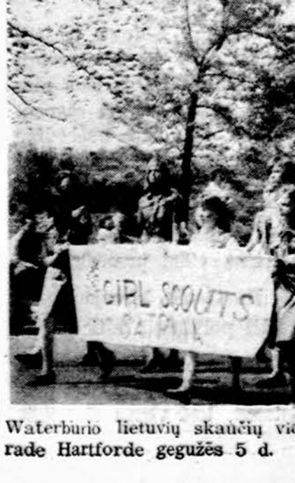
Waterburio lietuvių skautų vienetas šatrija žygiuoja Lojalumo parade Hartforde gegužės 5 d.

Vienetams priklausa ar su vienetais stovyklausią registruojami tūntininkų ir vietininkų. Paskiri asmens, kur nėra vienetų ar p., registruojasi patys. Kur galima, skautininkai-ės registruojasi per skautininkų ramovės bendra tvarka. Registruojant suteikiamos tokios asmens žinios: