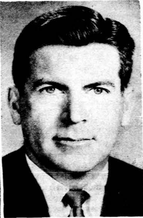
Kongresmanas Thomas J. Meskill (R. - Conn.), šiomis dienomis įsijungęs į Rezoliucijoms remti komitetą, ragina JAV-bių prezidentą įgyvendinti kongreso pravažę rezoluciją (H. Con. Res. 416) Lietuvos laisvinimo reikalu.

Visi geros valios lietuviai ir patriotinės lietuvių organizacijos kviečiamos parašyti panašius laiškučius kiek galima daugiau. Nebūtinai tie laišukai rašytini mašinėle, galima juos rašyti ir ranka. Padarykite tai dar šiandien. IT