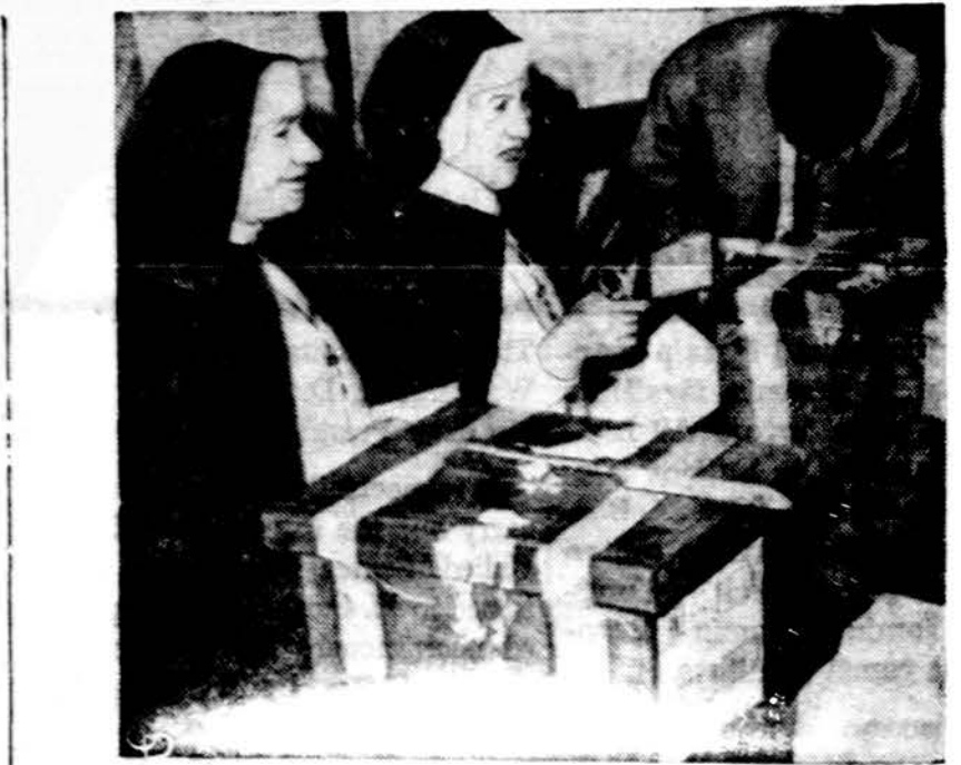
Italijoje 30 milijonų balsuotojų rinko naują parlamentą. Čia matyti bebalsoją vienuolė Romoje.

Maskva laiko kiekvieną jai nepaklusimą, atsisakymą vykdyti jos imperialistinę politiką nukrypimu nuo marksizmo. Jo samprotavimai apie proletaria-