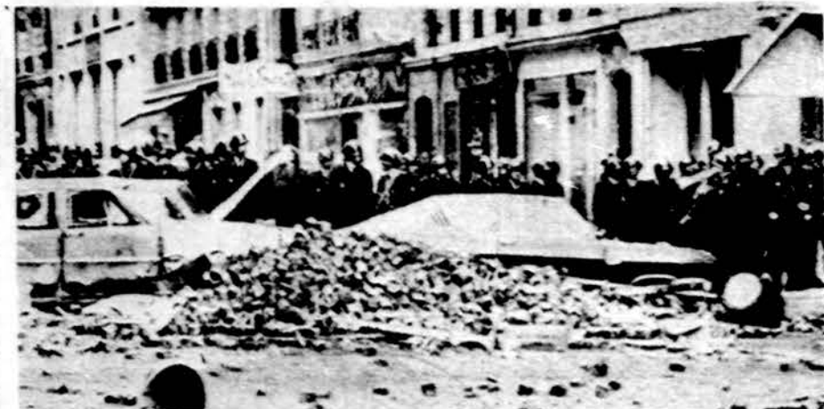
Paryžiaus gatvėse, po studentų susidūrimų su policija

De Gaulle prezidentavimo laikas baigiasi 1972 m. Dabar prižiūstama, kad vienu iš reikš-