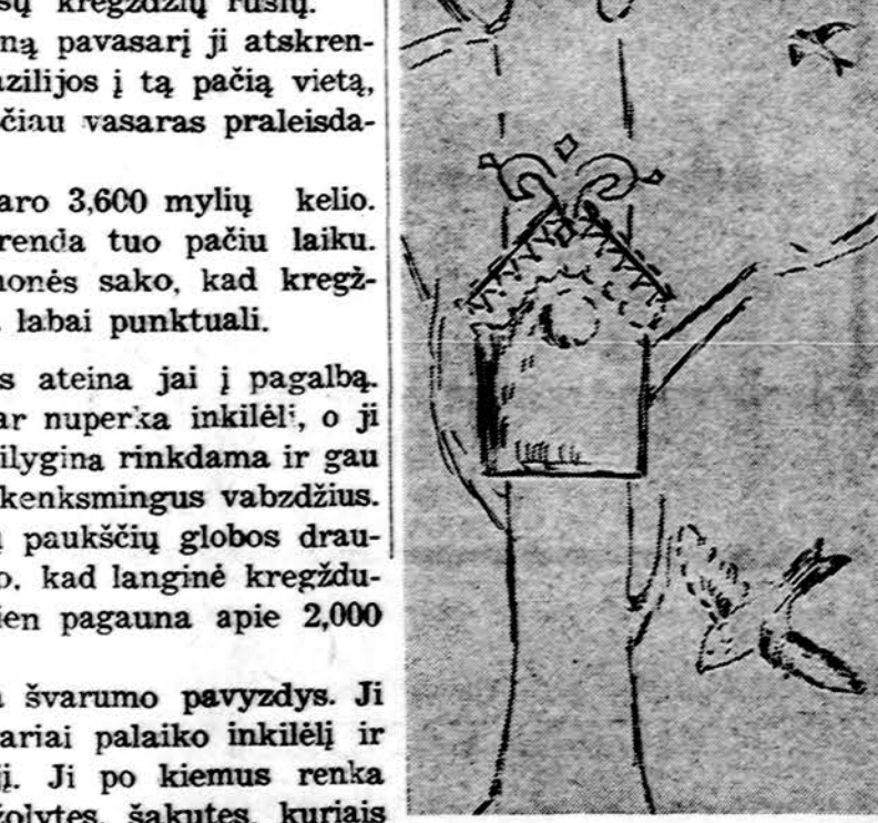
Langinė kregždutė. Piešė Ugnelė Stasaitė.