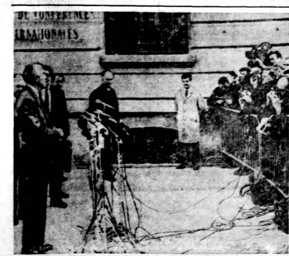
Posėdžiui su Hanojaus atstova's pasibaigus, JAV delegacijos pirm. A. Harriman ties pasitarimų rūmais atsako į žurnalistų klausimus. Žinoma virsta ir foto reporterių "auka".