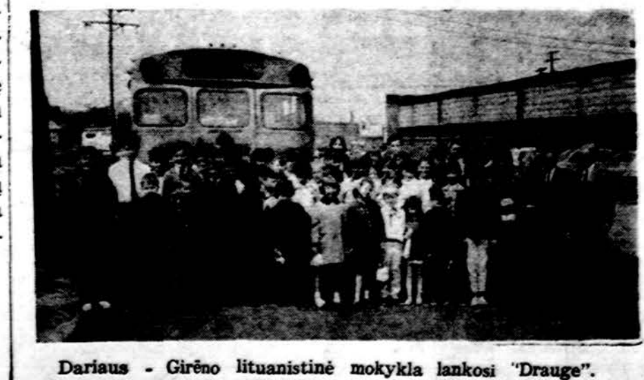
Dariaus - Girėno lituanistinė mokykla lankosi "Drauge".

* — Prašau man atnešti dešrelių. — Su malonumu. — Ne, su garstyčiom (mustard). — atsako svečias.