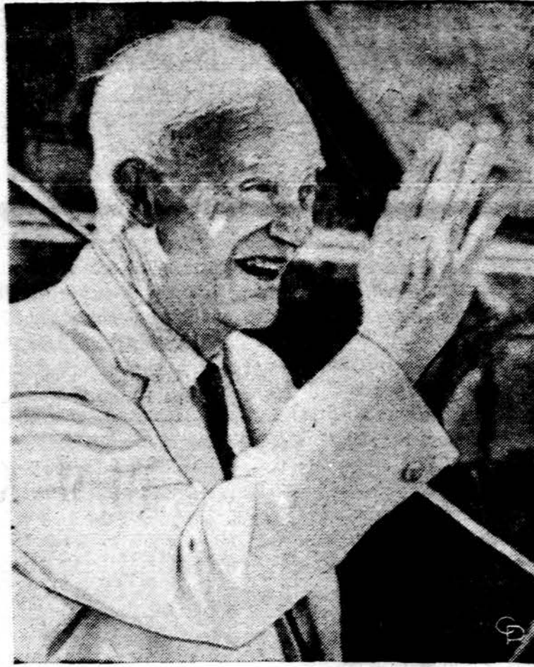
Buvęs prez. Eisenhoweris pora dienų prieš savo ligą Palm Springs, Calif.

Spauda daug dėmesio skyrė ir užsienio svečiams, kurių nemažai atvyko, kaip laimėtojai. Ypačingą dėmesys buvo Cekoslovakijos režisieriui. Gaila, kad jis nemokėjo angliskai. Neatsirado Cekoslovakų kalbos žinovo. Jis griebėsi rusų kalbos, bet nelabai sekėsi. O čia ir be manęs, taip pat silpnai rusiškai mokančio, geresnio vertėjo neatsirado. Zino-