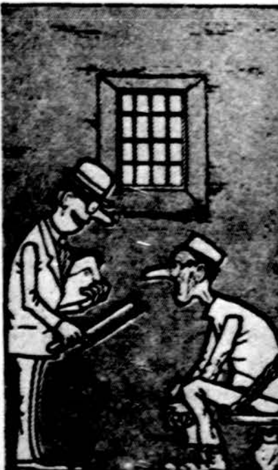
"Jūs esate dašnai rehabilituoti, štai pasimkite pūklę" (iš čekų humoro).