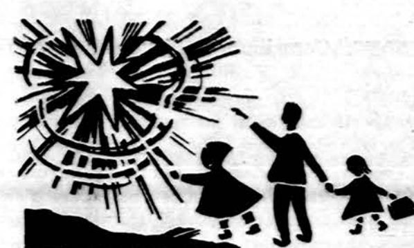
Isteigtas Lietuvių Mokyjų S-gos Chicago sk. Red. J. Placās Medžiagą siūsti: 7045 So. Claremont Ave., Chicago, Ill. 60636