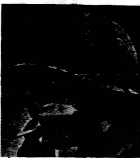
Sužeistas JAV karys Vietname ir cigarečių lūpose

Radiojėspėjimų prieš maisto atsargų sudarymą nepaisydamos, prancūzų šeimininkės gabenasi namo neprastai didelius maisto kiekius — konservuotas