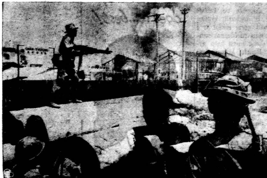
Kai kur Saigone dar pasitaiko pavieniai užsislėpę komunistiniai teroristai, kuriuos čia medžioja Pietų Vietnamo kariai.

Rusų kompartija engia žmones, juos laiko priespaudoje tardama, kad ateityje gyvenimas būtų geresnis. Kompartijos vadovybė, Sovietų valdančioji klasė, gali likti valdžioje tik atsirėmus į diktatūrą ir jėgą. Atskiri kraštai gali naudotis laisve, jei ji nekenkia Sovietų Rusijai. Cekoslovakijos reformos sukėlė Maskvoje nuodėgtą, atmetus proletarinę diktatūrą, prasidės griuvimas rūmo, kurį kompartija statė negailėdama kraujo ir aukų, nes žmonės ir tautos gali pradėti kovą dėl laisvės ir Sovietų kalbėjime.