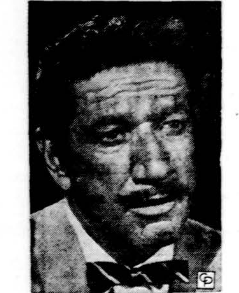
Richard Boone. "The Richard Boone" programoje, vienas kandidatų metinėms televizijos "Emmy" premijoms — statulėliams už ypatingą pranašumą šioj srity. Laimėtojai bus paskelbti geg. 25 d.

L. K. Kūrėjų Savanorių Sąjungos Čikagos skyriaus Valdyba