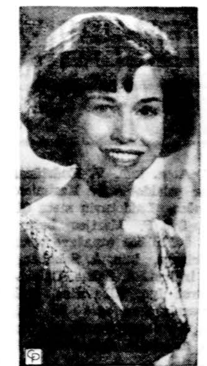
Mary Tyler Moore, "The Dick Van Dyke" programoje, kandidatė televizijos metinėms "Emmy" premijoms — statulėliams. Laimėtojai bus paskelbti geg. 25 d.

5759 So. Western Avenue Kampus 58th Street Telefonas PROspect 8-9535