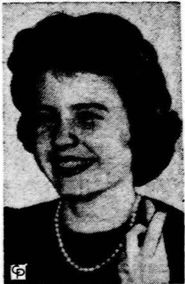
Patty Duke, "The Patty Duke" programos žvaigždė, yra viena 10 kandidatų-tų metinėms televizijos "Emmy" premijoms - statulėlėms. Laimėtojai bus paskelbti geg. 25 d.

Kaip matyti, Sovietų Sąjunga kaltina Kiniją diktatūrinėmis užmačiomis, tačiau Sov. Sąjungoje taip pat egzistuoja asmenybės kultas, tik nesutariama dėl asmens, nes Sov. Sąjungoje tas asmuo yra Chruščiovas, o Kinijoje — Mao Tse-tungas. Nepaisant, kad netikima, jog komunistai tarp savęs kariautų, tačiau sekant pasaulio komunistų veiklą, matyti, kad tas skaldymasis vyksta.