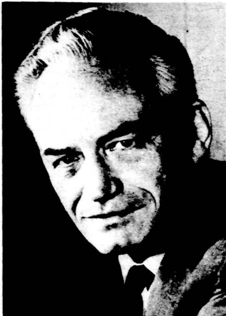
Senat. Barry Goldwater (R-Ariz.), įnešęs naują rezoliuciją (S. Con. Res. 85) Lietuvos ir kitų pavergtų kraštų laisvinimo reikalu.