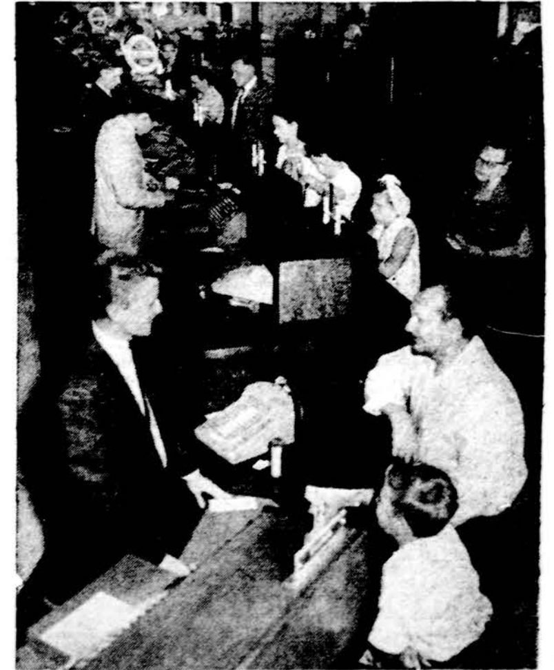
Chicago Savings bendrovės kasdieninis vaizdas darbo metu

CHICAGO SAVINGS & LOAN BENDROVĖ, 43 milijonų dolerių finansinė įstaiga, namus perkantiems ar statantiems žmonėms yra pilnai pasiruošusi duoti morgiausių priemiamiausių sąlygomis, lengvais mėnesiniais išmokėjimais. Susidomėjusius kviečiame atvykti į Amerikos Lietuvių sostinės centrą — Marquette Parko apylinkę į CHICAGO SAVINGS & LOAN BENDROVĖ ir susitari dėl paskolos.