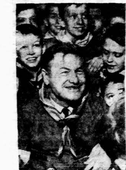
Gub. Rockefeller skautų tarpe Albanų, N. Y.