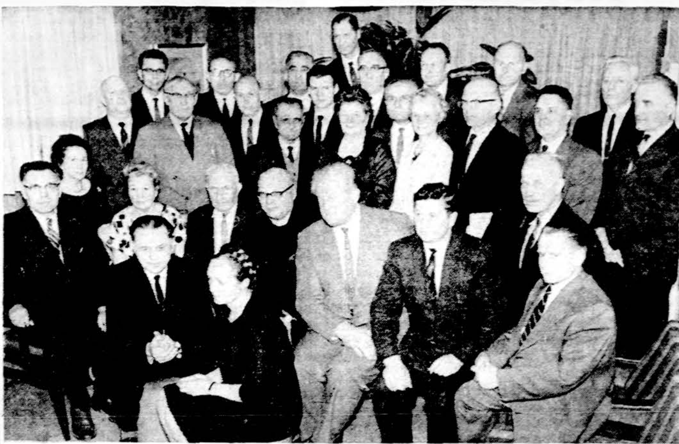
Posėdis baigiant Chicago Balfo vaju, kurio metu surinkta rekordinė suma, apie 22,000 dol.

Naujai įvestas dalykas yra Praktiškoji lituanistika, kurią dėstys Pr. Pusdešris. Mokiniai bus mokomi ir pratinami rašyti korespondencijas į lietuviškus laikraščius ir bus supažindinami apskritai su lietuvių literatūra.