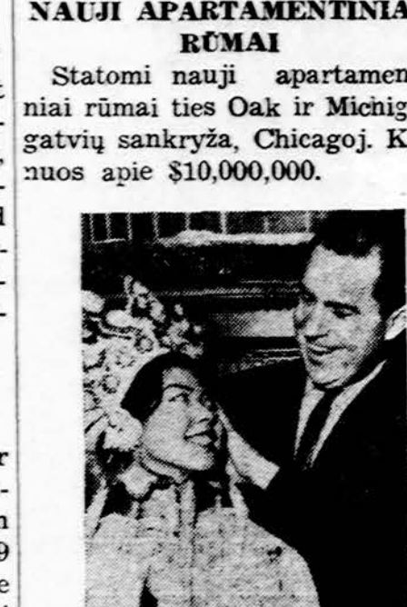
Richard Nixon, Philadelphia, Pa., vainikuoją kinietę karalaitę, mi-nint kinų tautinę 4662 m. sukaktį. Mergaitė kilusi iš Drexel Hill, Pa., studentė.

Statomi nauji apartamenti-niai rūmai ties Oak ir Michigan gatvių sankryža, Chicagoj. Kai-nuos apie $10,000,000.