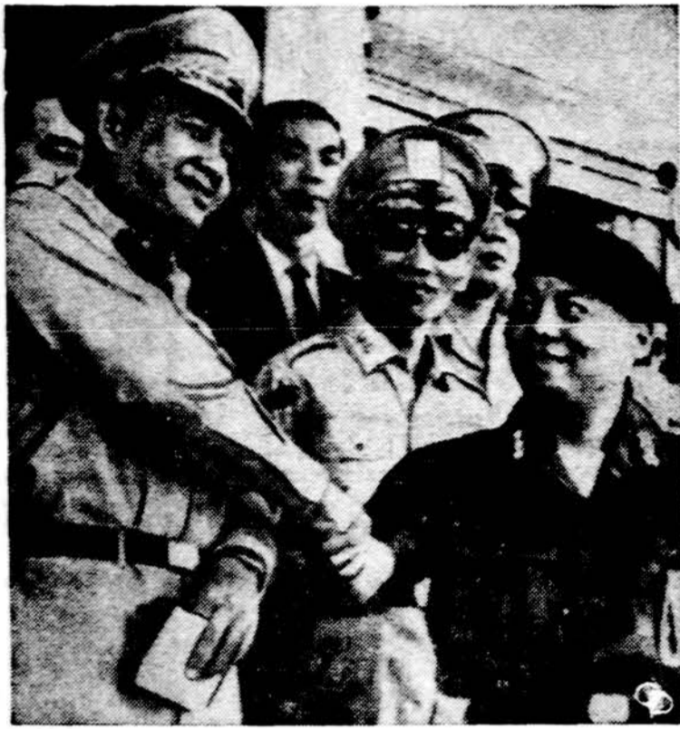
Maj. gen. Nguyen Khah (dešinėje), naujas Pietų Vietnamo ministras pirmininkas, sveikinasi su maj. gen. Duong Van Minh, kurio vyriausybę nuvertė Khanh, Minh sutiko jėgti į naują vyriausybę.