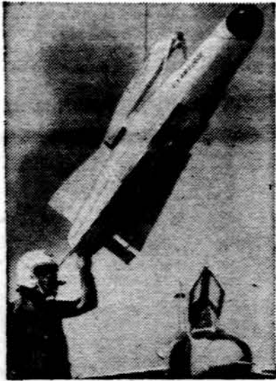
Falcon yra vairuojama raketa su atominė galvute. Ji pradėta gaminti 1960 m. Ši raketa, vairuojama radaru, gali sunaikinti kiekvieną bombonešį, nors taikinyr ir nebūtų matomas. Ji yra didelio greičio ir gaminama Tucson, Ariz.

Vilties teikia abiejų partijų užsibrėžta dinamiškesnė stalties politika, kuri nori nenori teikia ir ūkiui šviesesnių pers-