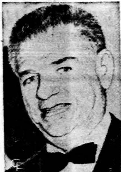
Oscar Hammerstein, padėjęs sukurti didelius filmus, kaip South Pacific, Oklahoma ir daug kitų muzikinių filmų, sunkiai serga savo farmoje Doylestown, Pa.