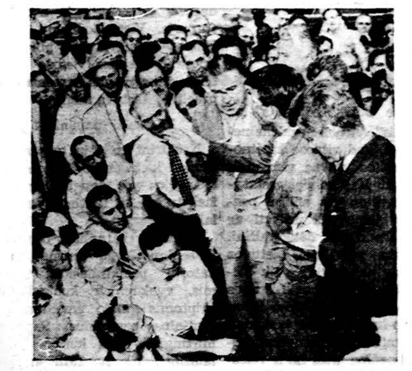
Sen. Kennedy, dėl sinuso negalėdamas kalbėti, rašo pastabas savo broliui Boč, kuris jas perduoda Brooklyn Navy uosto darbininkams. Šie gi nepatenkinti, kad vyriausybė nutarė slyti didį laivą privočių statykloj.

Jeigu Chruščevas paskelbtų visiška Berlyno blokadą, Sovietų premjeras pakartotinai vėl grąšintų, kad jeigu Vakarai nepadarys žingsnio, kad jie galėtų susilaukti visiškos to miesto blokados.