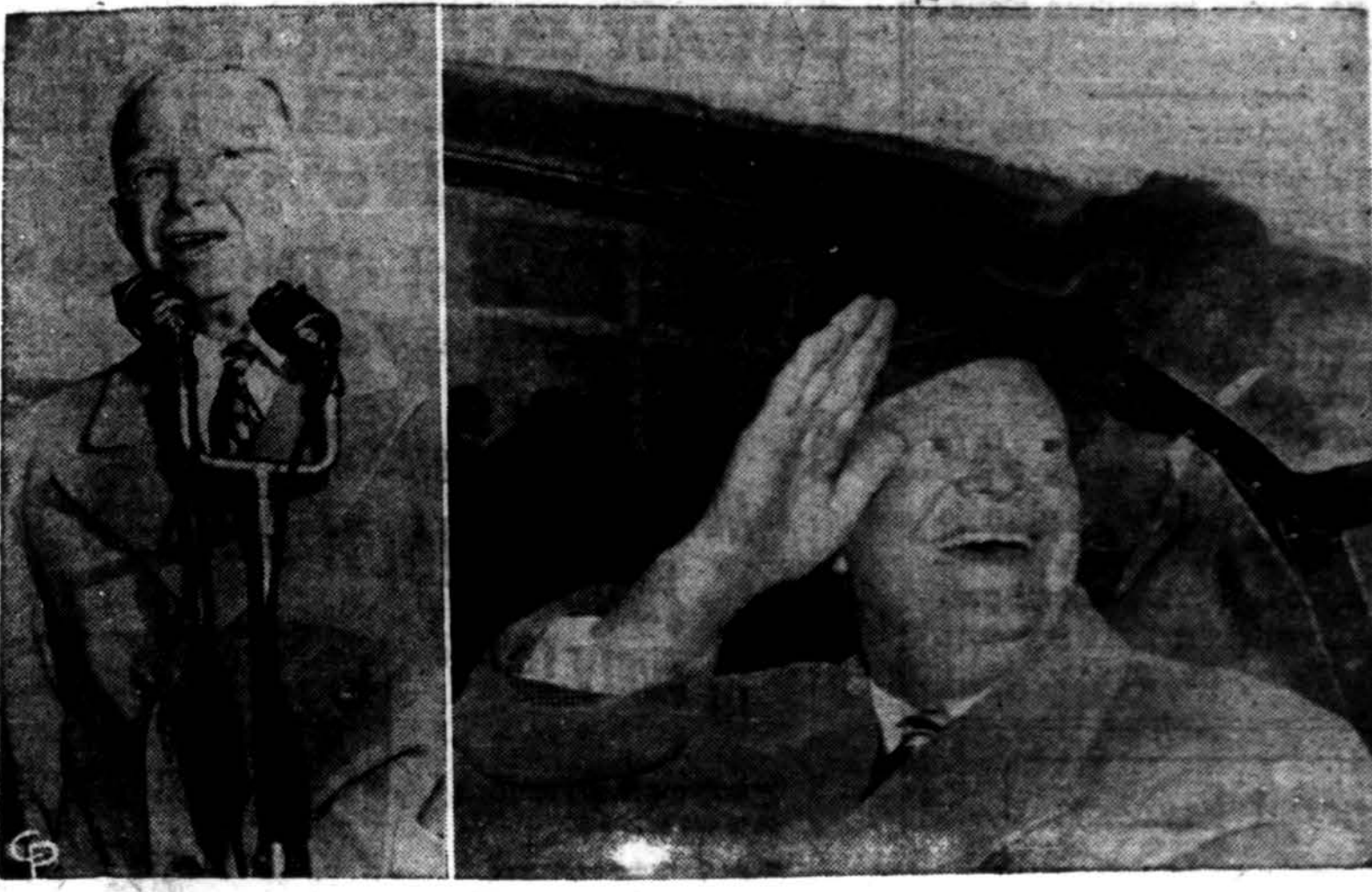
Prezidentas Eisenhoweris (kairėje), atvykęs iš Denver į Washington, kalba gausiai miniai, kuri jį ova- cijomis sutiko. Dešinėje prez. Eisenhoweris sveikina minią vykdamas iš aerodromo į Baltuosius Rumus.