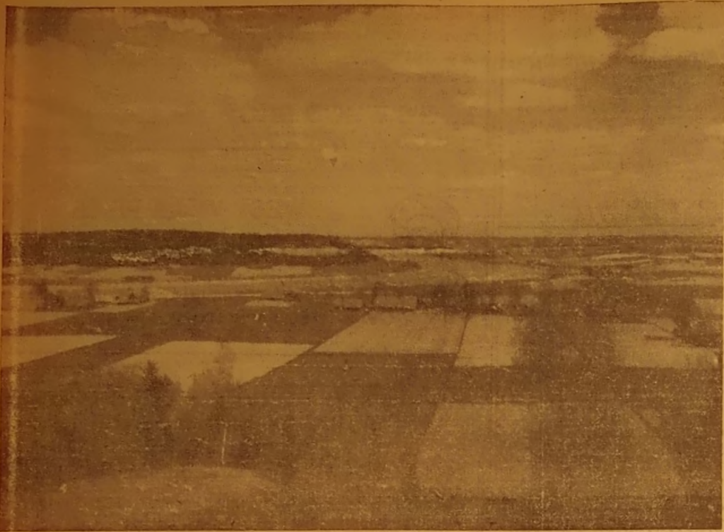
Nemuno kilpa ties Kaunu