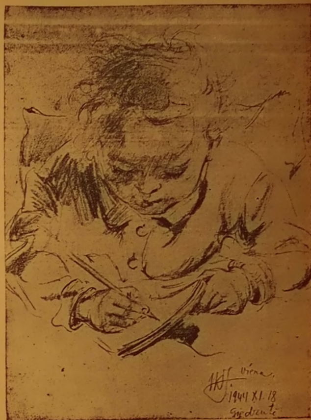
Mergaitė rašo — V. K. Jonynas

Milano Sv. Jėzaus Širdies Katalikų Universitetas minėjo savo gyvavimo 30 metų sukaktį. Šio laiko tarpas buvo našus, nežūrint didelių kliūčių ir karo. Studentų skaičius šiandien siekia 6,581 ir profesūros personalo 148. Universiteto biblioteka turi 478,084 toms knygy ir 2,087 žurnalus, kurių 280 italų, 782 įvairių Europos kraštų ir 387 kitų kontinentų. Universitetas leidžia keletą svarbių žurnalų, kaip: "Aegyptus", kuris yra vienas iš geriausių Italijos papirologijos ir egiptologijos žurnalų; "Aevum" istorijos, filologijos ir kalbos mokslų žurnalas; "Psichologijos, neurologijos ir psichiatrijos archyvas"; "Neoskolastinės filosofijos žurnalas" ir "Tarpautinis juridinių mokslų žurnalas". Universitetas išleido visą eilę vertingų mokslinių veikalų.