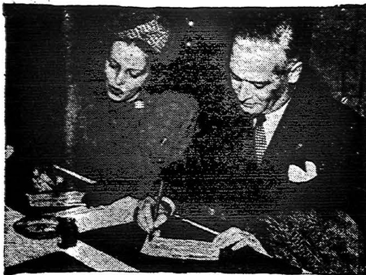
Illinoiš valstybės gubernatorių Green su žmona atlieka pilietinę pareigą — balsuoja. Šiandie jis džiaugias respublikonų "landslide".