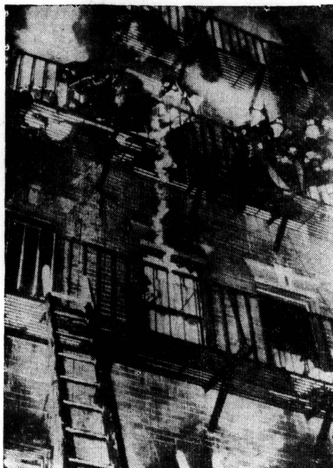
Penki asmenys žuvo ir 50 kitų buvo sužeisti kuomet gaisras sunaikino didelį gyvenamųjų namų pastatą Bostone. Ugniagesiai kovojo dūmus ir liepsnas, galų gale suvalgdami gaisrą.