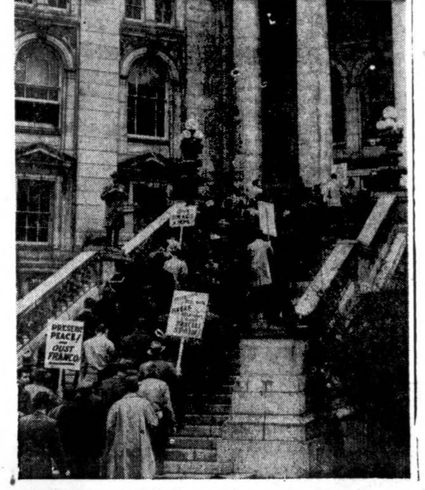
Antrojo pasaulinio karo veteranai lipa Wisconsinso gubernatūros laiptais, eidami į gubernatoriaus raštinę patiekti eilę protestų dėl gyvenamų vietų ir namų statybos, bonusų mokėjimo ir įvairių kitų reikalų.