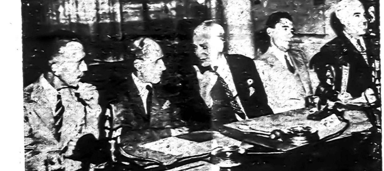
Valstybės Sekretorius Cordell Hull atidare tarptautinės apsaugos konferenciją Dumbarton Oaks'e, sakdamas, kad "taikos organizavimas turi būti paremtas jėga." Iš kairės į dešinę: britų delegacijos vadas Sir Alexander Cadogan; Anglijos Ambasadorius Amerikai Lord Halifax; Rusijos delegacijos pirmininkas Andrei Gromyko, ir Edward Stettinius, Jr., Amerikos delegacijos pirmininkas.