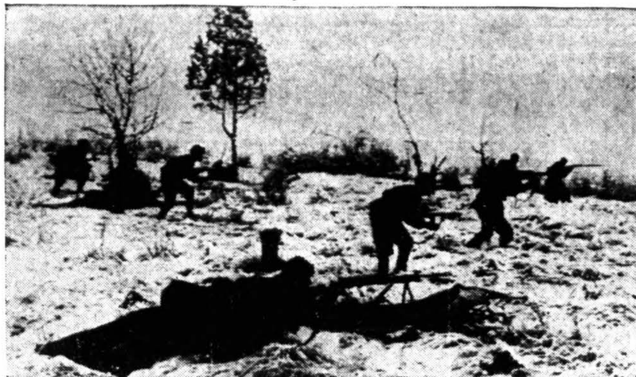
Radiophoto iš Maskvos parodo rusų kariuomenės žygiavimą šiaurės vakarų fronte, kur vokiečiai sutraukė didesnę sustiprinimą ir smarkiai kontratakuoja sniego tyrumose.