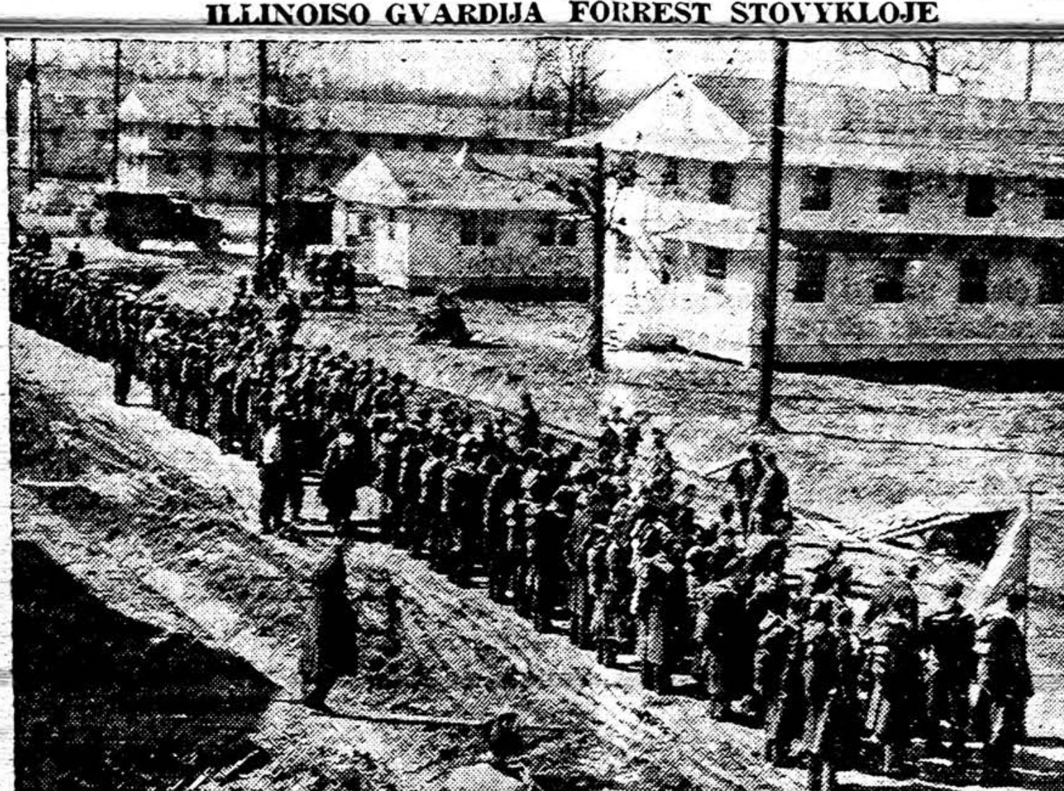
Illinois nacionalinės sargybos 33-ios divizijos pirmasis dalinys, nuvykęs į Forrest stovyklą, Tenn. Tenai visa divizija bus apmokoma. Pastatytos naujos kareivinės.