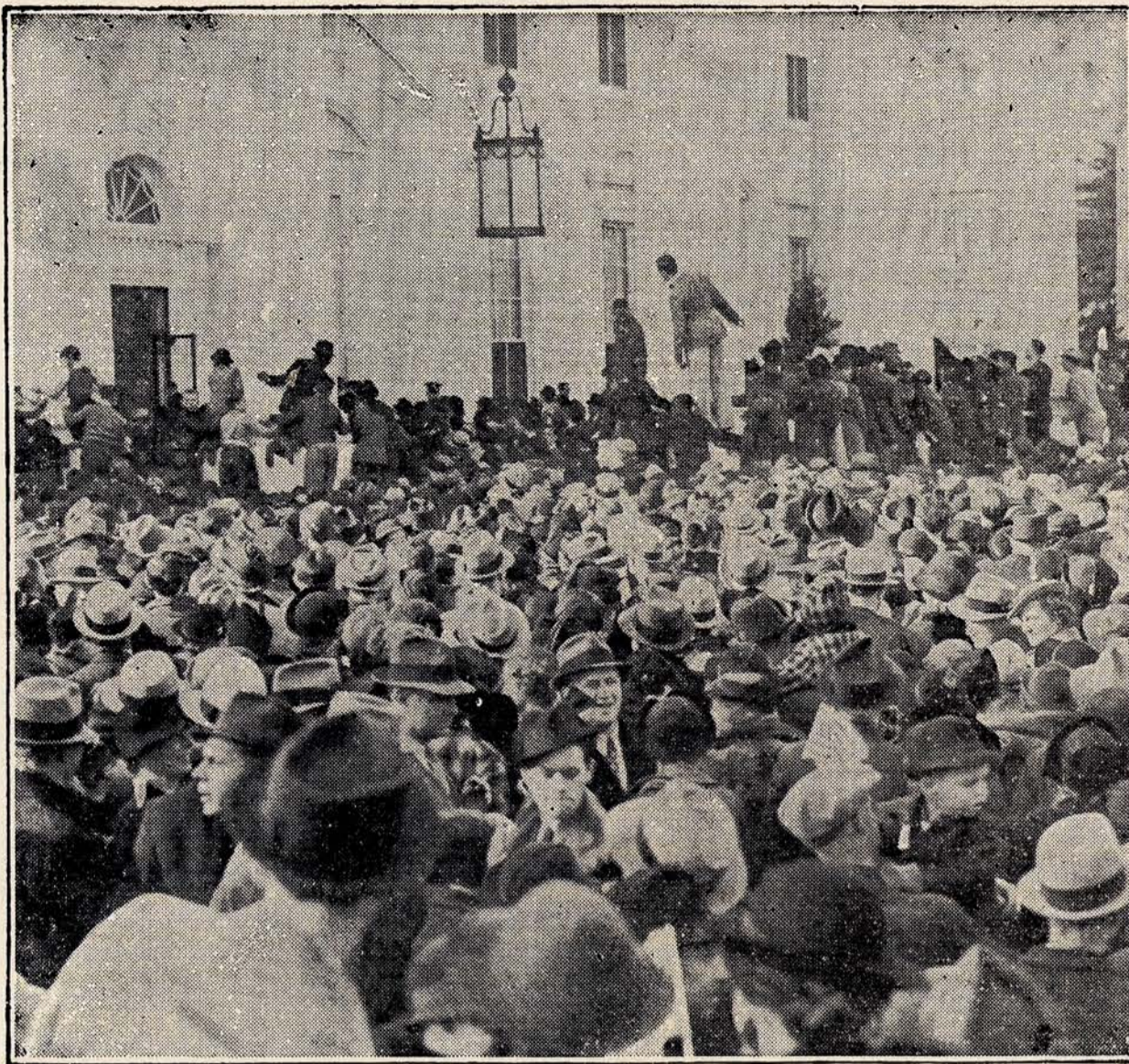
Prie prezidento rūmų. Dalis minios, kuri, pralaužus policijos liniją, apgulė Baltuosius Namus, Washingtono, kad pasveikinti grįžusį po laimėjimo prezidentą Roosevelta, kuris šūkavimais buvo priverstas išeiti ant balkono ir pasirodyti.