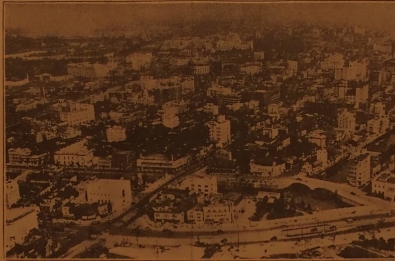
Tas yra Japonijos sostinės Tokijo dalis. Nuotrauka padaryta iš lėktuvo. Matomi du imoniai moderniškai ištaisyti distriktai: Ginza ir Marunouchi.