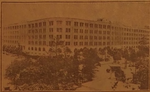
Japonijos vyriausybės ofisų rūmai sostinėje. Pranešama, kad šie rūmai esą sukildėlių rankose.

Vasario 23 d. įvyko svarbus pasitarimas klebono su parapijos komitetu reikale rengiamo bendro su Visų Šventųjų parapija vakaro, baland. 19 d., Fenger High School audi-