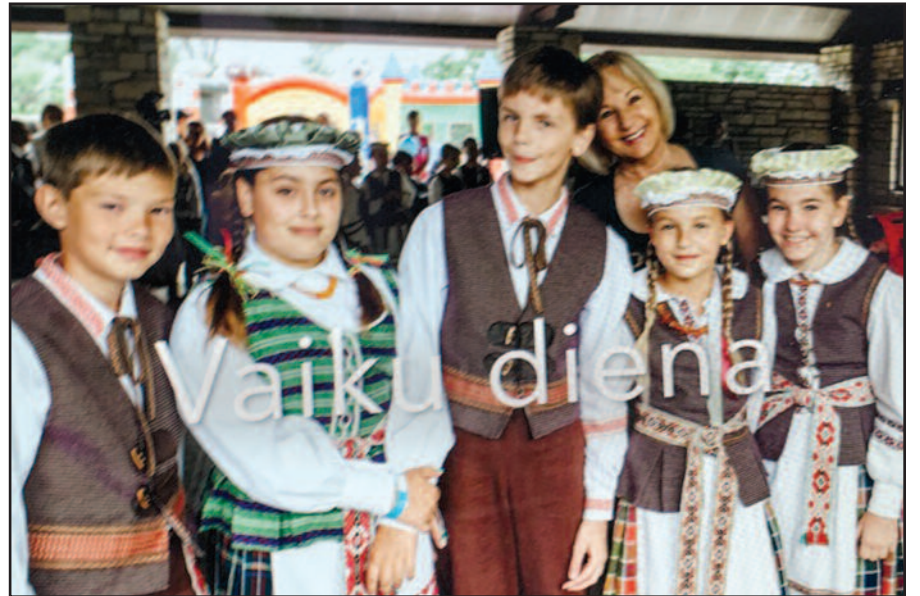
Jaunieji „Rusnės“ šokėjai.