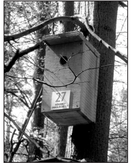
Vingio parko inkilas.