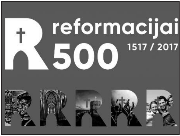
Reformacijos 500 metų jubiliejaus ženklas.

Projektas vyks visus metus, tarp organizatorių yra Lietuvos kultūros ir švietimo ministerijos, Lietuvos literatūros ir tautosakos institutas, Naciona-