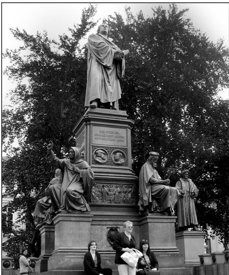
Prie paminklo Martynui Liuteriui ir jo pasekėjams Wormse (Vokietija) fotografuojasi keliautojai iš Lietuvos. 2009 m.