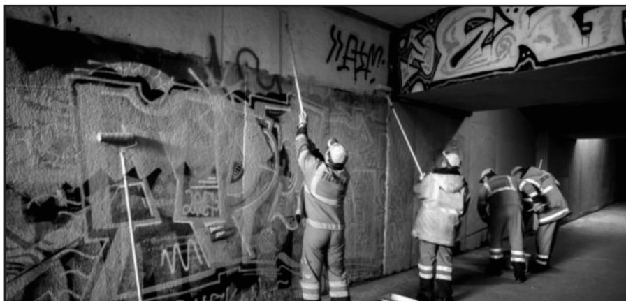
Savivaldybė skyrė rekordinę sumą grafičiams nuvalyti.