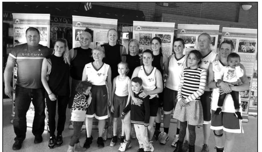
Balandžio 22 d. LTSC paroda „Sportas JAV lietuvių gyvenime“ buvo pristatyta Lietuvos Nepriklausomybei skirtame ŠALFASS krepšinio turnyre, vykusiam Rytiniame Long Islande.