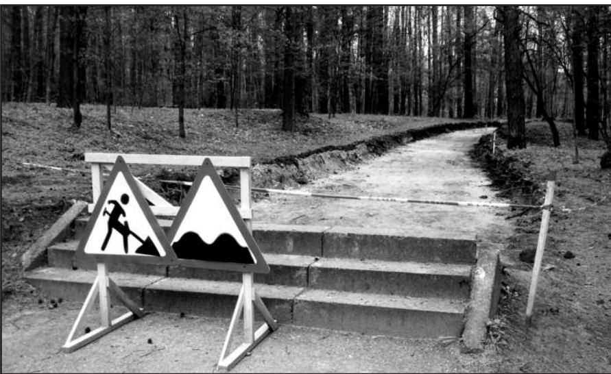
Tiesiamas naujas kelias į šventę.