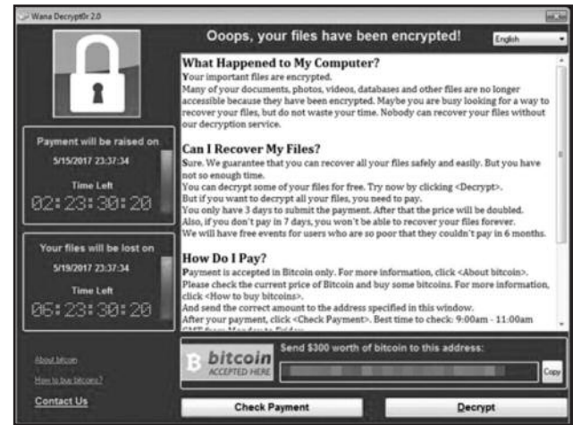
Manoma, kad tikrasis atakos mastelis paaškins artimiausiomis dienomis.

Jo teigimu, mažai kas pasidavė įsilaužėlių reikalavimams sumokėti, kad būtų atblokuoti užblokuoti failai, tačiau pareigūnas perspėjo, kad situacija darosi vis rimtesnė. Anot R. Wainwright,