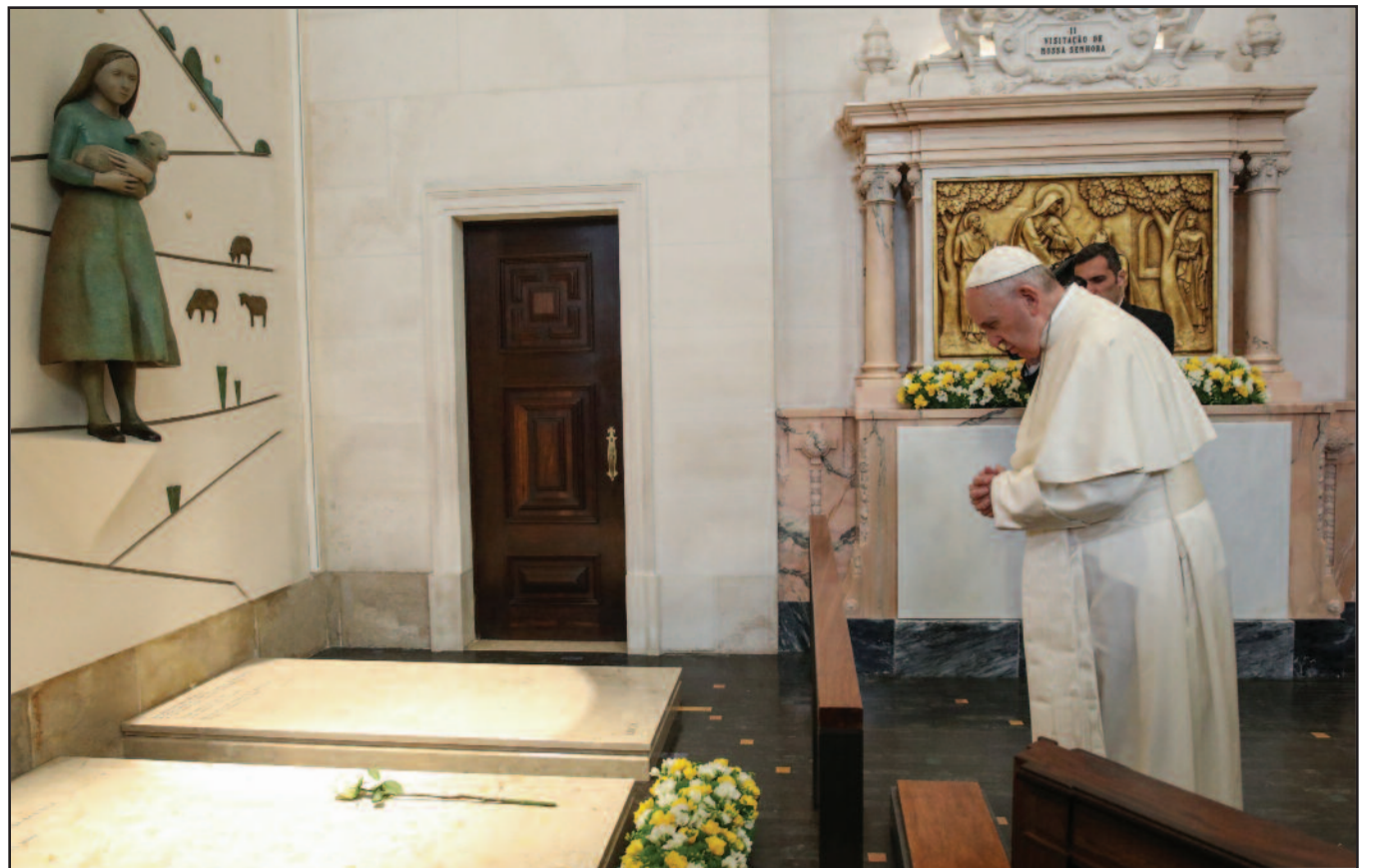
Popiežius Pranciškus prie piemenėlių, kuriems prieš 100 metų apsireiškė Mergelė Marija, kapo.