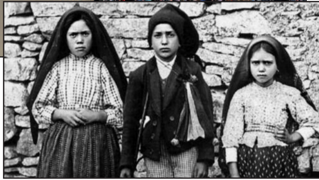
Nauji šventieji: Francisco ir Jacinta (d.)

retacija? Popiežius Pranciškus atsakė, kad ne, nėra jokios revizijos. Regėjimus anuomet labai gerai paaiškino tuometinis Tikėjimo mokymo kongregacijos prefektas kard. Joseph Ratzinger. Beje, ir popiežiui Pranciškui iškilo klausimas apie „Baltai vilkintį vyskupą”, nes maldą sukūrė Fatinos šventovės atsakingieji, ne popiežius. Pasak jo, „yra simboliškas ryšys su balta spalva: balta rūbą vilkintis vyskupas, baltai vilkinti Dievo Motina, baltai po Krikšto aprenkti nekalti vaikai... Balta spalva simbolizuoja nekaltumo ir taikos troškimą, norą būti nekaltiems, nežeisti kitų, nekariauti”.