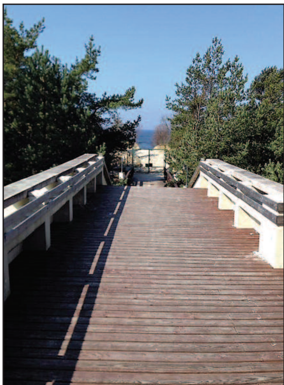
Visai šalia – kopos ir jūra.

Anksčiau vos 20 žmonių galinti sutalpinti vila dabar priima 64 poilsiautojus. Nors poilsis legendinėje viloje išties nepigus, bet nemaža dalis klientų kasmet renkasi „Auską“ ir dėl privatumo, ir dėl ramybės, ir dėl kitų privalumų. Vasarą vila dažnai būna užimta, čia atvykstantys poilsiautojai dažniausiai nėra jauni žmonės, jie jau tikrai gali susimokėti už komfortą. Daug klientų yra iš Rusijos, Baltarusijos, liepos mėnesį jie sudaro didžiąją dalį poilsiautojų, bet būna ir lietuvių, ypač sugrįžusių iš užsienio pailsėti, atvyksta nemažai skandinavų. Žinoma, nemažą jų dalį vilioja ir labai išpuodinga „Auskos“ vilos praeitis, ir galbūt sentimentai tam, kas jau niekada nesugrįš.