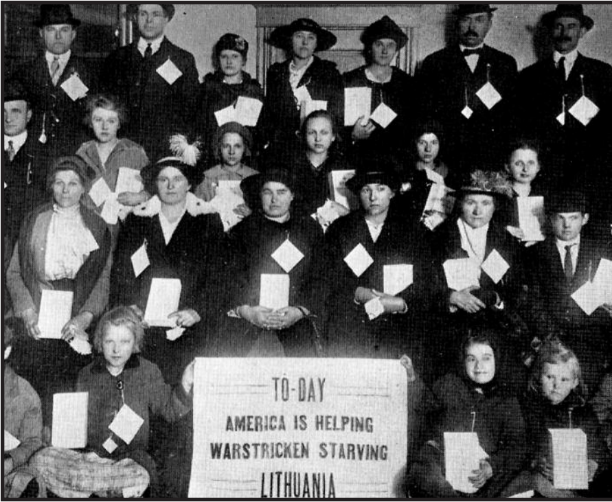
1916 m. lapkričio 1 d. JAV lietuvių pastangomis Prezidento Woodrow Wilson paskelbta Lietuvos šelpimo diena – visoje Amerikoje JASV lietuviai rinko aukas nuo karo nukentėjusiems Lietuvos gyventojams šelpti.