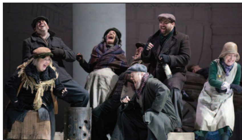
Scena iš spektaklio.