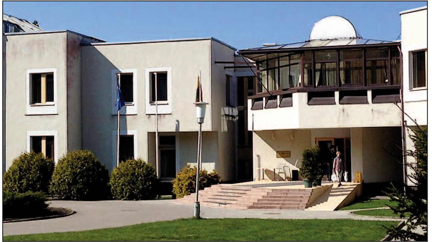
Vila mena daug garsių lankytojų.

Teigiama, kad šios vilos statyba davė nemažai naudos Palangos miestui. Poilsio namų sąmata tuomet siekė apie 8 milijonus rublių ir už tuos pinigus buvo pastatytas ir įrengtas ne tik šis pastatas, bet ir pakeista kanalizacija miestui, pastatyta nauja telefonų stotis, suremontuotos gatvės, įrengtas