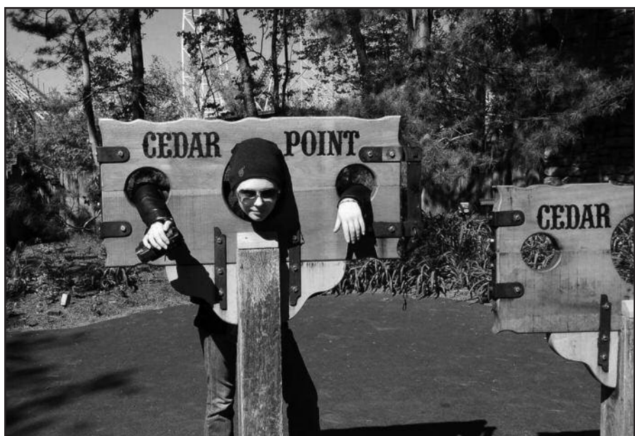
Keliauninkei Simai Tarvydaitei didelį įspūdį paliko amerikietiško kalnelių atrakcionų parkas Ohio valstijoje.

Žinoma, Niagaros kriokliai. Stovėdama prie jų supratau, kad gamta – tai didelė jėga. New Yorko miestas yra išpūdingas savo dangoraižiais, muziejų gausybe. Centrinis parkas man pasirodė labai gražus, tačiau varginantis dėl savo dydžio.