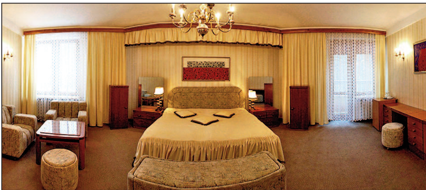
Nakvynė viloje prieinama ne kiekvienam.

Šioje viloje yra poilsiaavę daug garsių asmenų, čia ilsėjosi ir visi išrinkti Lietuvos prezidentai, išskyrus Dalia Grybauskaitę. Šie valstybiniai poilsio namai iki 2009 metų priklausė Vyriausybės kanceliarijai, todėl juose nemokamai galėjo ilsėtis šalies Prezidentas, Vyriausybės vadovas ir Seimo pirmininkas.