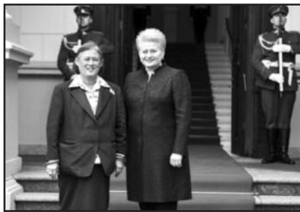
Pernai princesė Maha Chakri Sirindhorn lankėsi Lietuvoje.

Tailando sostinėje Bankoke šalies vadovė taip pat atidarys lietuviš-