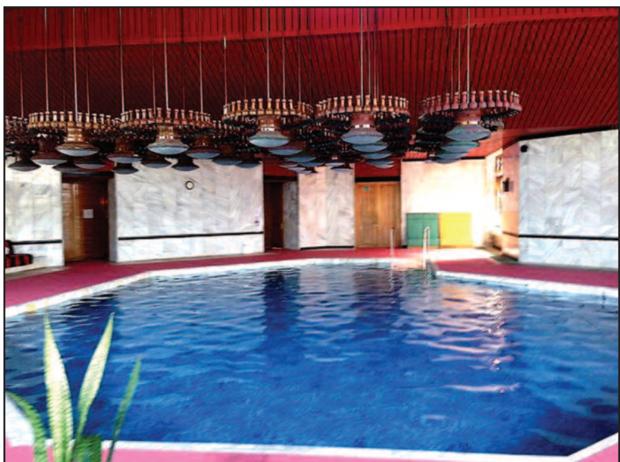
Legendinis „Auskos“ baseinas su pašildytu jūros vandeniu.