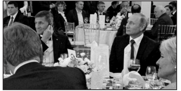
M. Flynn (k.) ne kartą buvo susitikęs su V. Putinu – dėlto gali būti šantažuojamas Kremliaus.

M. Pence sakė, kad M. Flynn paneigė, jog kalbėjosi su ambasadoriumi apie sankcijas, kurias B. Obama ad-