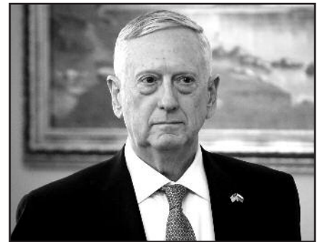
JAV gynybos sekretorius James Mattis.

Dvišaliame susitikime gynybos vadovai aptarė Lietuvos gynybos finansavimo didinimą, bendrą gynybą bei būtinybę stiprinti gynybos pajė-