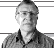
Parengė Vitalius Zaikauskas