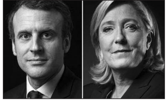
Antajame ture susirungs E. Macron ir M. Le Pen.

Jau seniai buvo tikimasi, kad M. Le Pen pateks į antrąjį rinkimų turą, tačiau centristo E. Macron iškilimas buvo greitas. Rezultatais besidžiaugiantiems savo šalininkams E. Macron