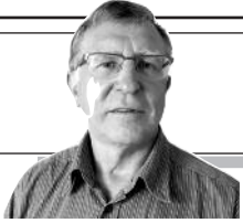
Parengė Vitalius Zaikauskas