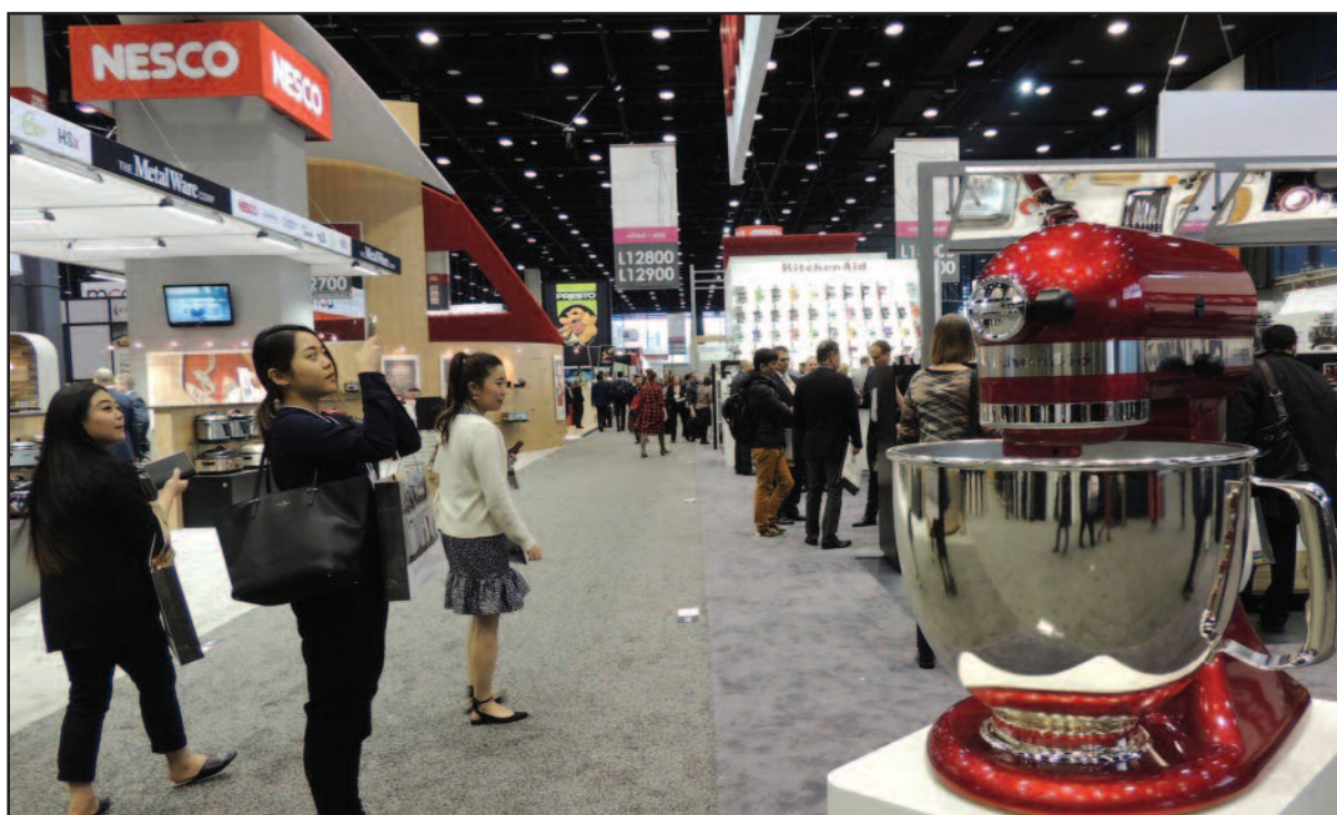
Čia susitinka tik gamintojai ir pardavėjai. Pirkėjai naujas prekes pamatys jau parduotuvėse.

V. Matranga pasakojo, kad svarbiausias dizainerių ir gamintojų tikslas – sukurti dar patogesnių ir įdomesnių namų apyvokos prekių, nei buvo su-