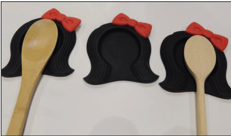
Dizaineriai nestokoja išmonės ir žaismingumo.