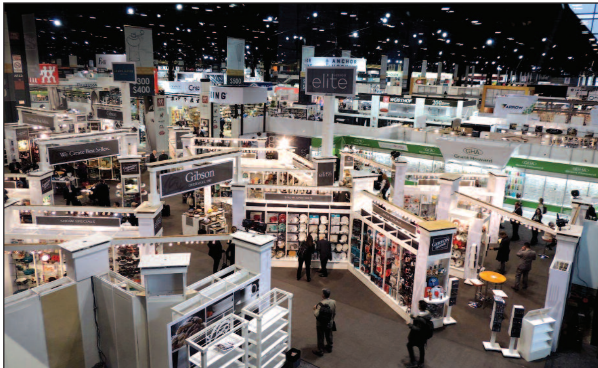
„International Home + Housewares Show“ užpildė tris didžiules parodoms skirtas erdves, užimančias per 200 tūkstančių kvadratinį metrų.