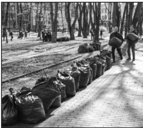
Akcijoje „Darom“ kasmet dalyvauja vis daugiau žmonių.

Pasak jos, šiemet atliekų surinkta maždaug 1 tūkst. tonų mažiau nei per-