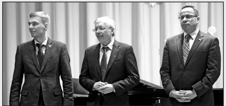
Mindaugas Puidokas, Gediminas Kirkilas ir Žygimantas Pavilionis. Čikaga, 2016 m.

Balandžio 25–30 dienomis į Jungtines Amerikos Valstijas atvyksta LR Seimo delegacija – pirmininko pavaduotojas, Europos reikalų komiteto pirmininkas Gediminas Kirkilas, Europos reikalų ir Užsienio reikalų komitetų nariai Andrius Kubilius, Žygimantas Pavilionis ir Mindaugas Puidokas.