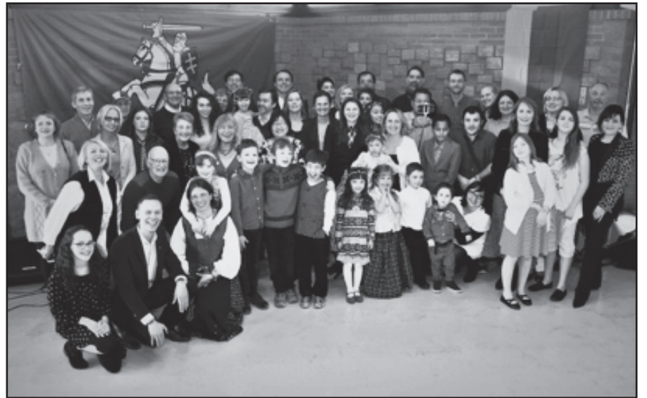
Cincinnati lietuvių bendruomenė.