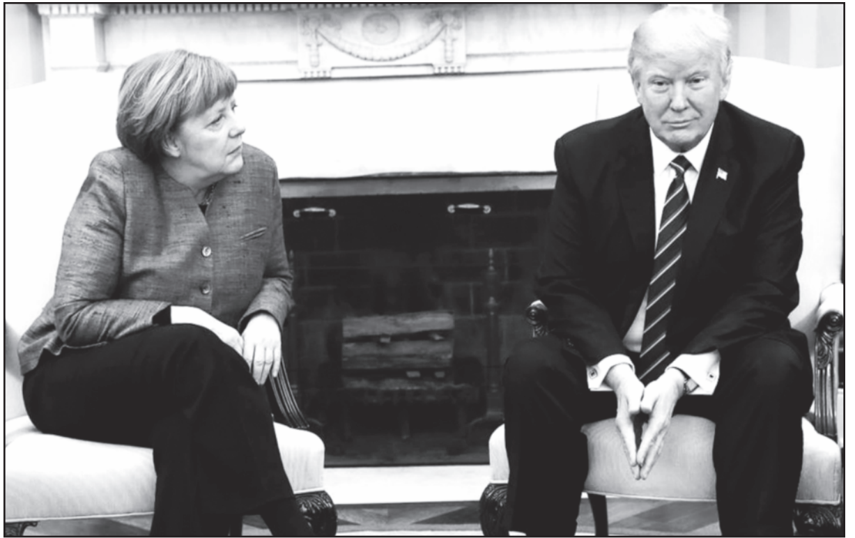
Net žurnalistų paklaustas, ar D. Trump taip ir nepaspaus rankos A. Merkel, jis nesujudėjo.

A. Merkel vizitu, kuris turėjo įvykti kiek anksčiau, bet buvo atidėtas dėl smarkios pūgos, siekta duoti naują impulsą šalių santykiams. Berlyno ir Washingtono ryšiai komplikavosi dėl D. Trump rinkimų kampanijos retorikos: būsimasis JAV pre-