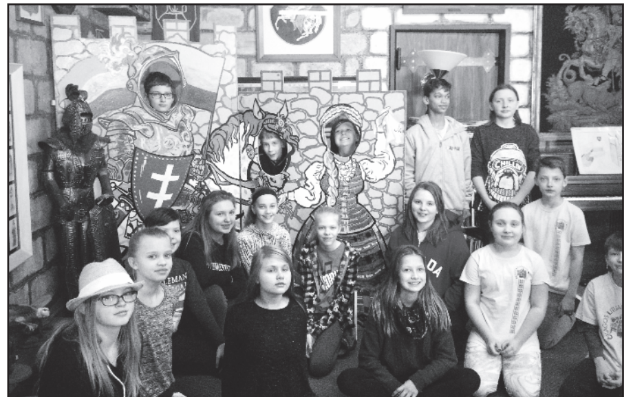
Berniukams smagu pabūti šarvuotais karžygiais, o mergaitėms – geltonkasėmis lietuvaiteimis!...

Parengė Aistė Šulcaitė ir Rasa Marganavičienė