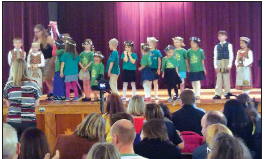
Programoje dalyvavo ir jauniausioji „Genio“ mokinukų karta.

Po bendros šventinės nuotraukos mažieji mokinukai mus nudžiugino smagiomis dainelėmis, o vyresniųjų klasių (7/8) mokiniai maloniai nustebinę atlikdami ritualinį pagonišką šokį, – apsiėmę gražiais tautiniais rūbais ir apsijuosę tautinėmis juostomis. Tada visi nudžiugo scenoje pamatę šokio grupę „Tiltas“. Ir turbūt tik San Francisco šokių grupėje galima pamatyti 4 vaikučius auginančią gydytoją, kelis bendruomenės valdybos narius, 27 metų „Google“ dirbantį lietuvi inžinierių arba kitoje techkompanijoje dirbantį amerikietį, kurio žmona – japonė, tėvai – Amerikos lietuviai, gimę Čikagoje, jis pats – San Francisko apylinkėse, o vaikai eina ir į lietu-