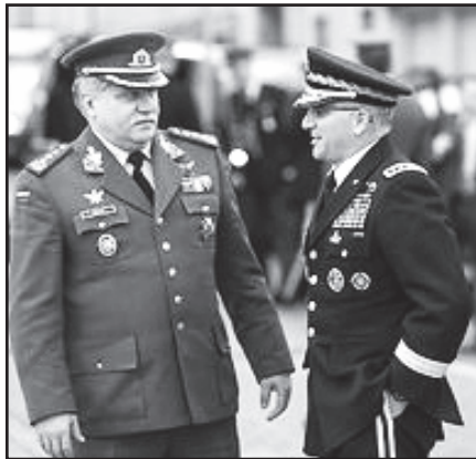
JAV karių matysime Lietuvoje tiek artėjančių Rusijos ir Baltarusijos pratybų ‘Zapad 2017’ metu, tiek ir po jų“, – sakė gen. ltn. J. V. Žukas (k.).

Pasak kariuomenės vado gen. ltn. J. V. Žuko, nuolatinis JAV pajėgų buvimas ne tik sustiprina Aljanso priešakines pajėgas, bet ir prisideda prie šalies saugumo, o bendros treniruotės kariams teikia didelę profesinę naudą ir tobulėjimą. „Susitikimo metu išreiškiau lūkestį, kad JAV karių matysime Lietuvoje tiek artėjančių Rusijos ir Baltarusijos pratybų ‘Zapad 2017’ metu, tiek ir po jų“, – sakė gen. ltn. J. V. Žukas.