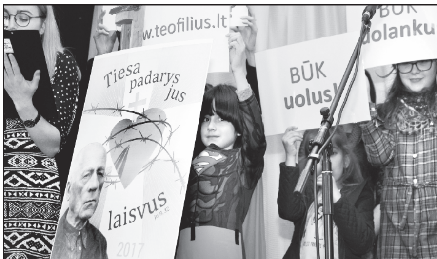
Parapijos nariai kūrybingai pristatė šv. Mišiose išskirtą garbingąjį Teofilijų Matulionį.

mas per išeivijos lietuvius, ragino savo tautiečius neapleisti bažnyčios, artintis prie sakramentų, tam ruošti vaikus, išlaikyti savo tautybę ir rūpintis tautos reikalais. Mus, lietuvius, visais laikais prasmingai jungia istorinė atmintis. Liepos 17-ąją minėsime lakūnų Dariaus ir Girėno atminimo dieną. Prieš 84 metus jie pradėjo savo istorinį atlantinį skrydį iš Čikagos per New Yorką, skrido virš Jungtinės Karalystės Lietuvos link. Lietuvos Respublikos Seimas yra paskelbęs tą dieną Pasaulio lietuvių vienybės dieną, kviečiančia susivienyti po visą pasaulį išsibarsčiusius lietuvius. Mūsų iškilių lakūnų lietuviškas ryžtas, kūrybingas darbas ir darbščios pastangos visiems laikams tapo lietuvių pasaulyje jungtimi su tėvyne Lietuva. Dabar mums vėl ypač reikalingi jungiantys