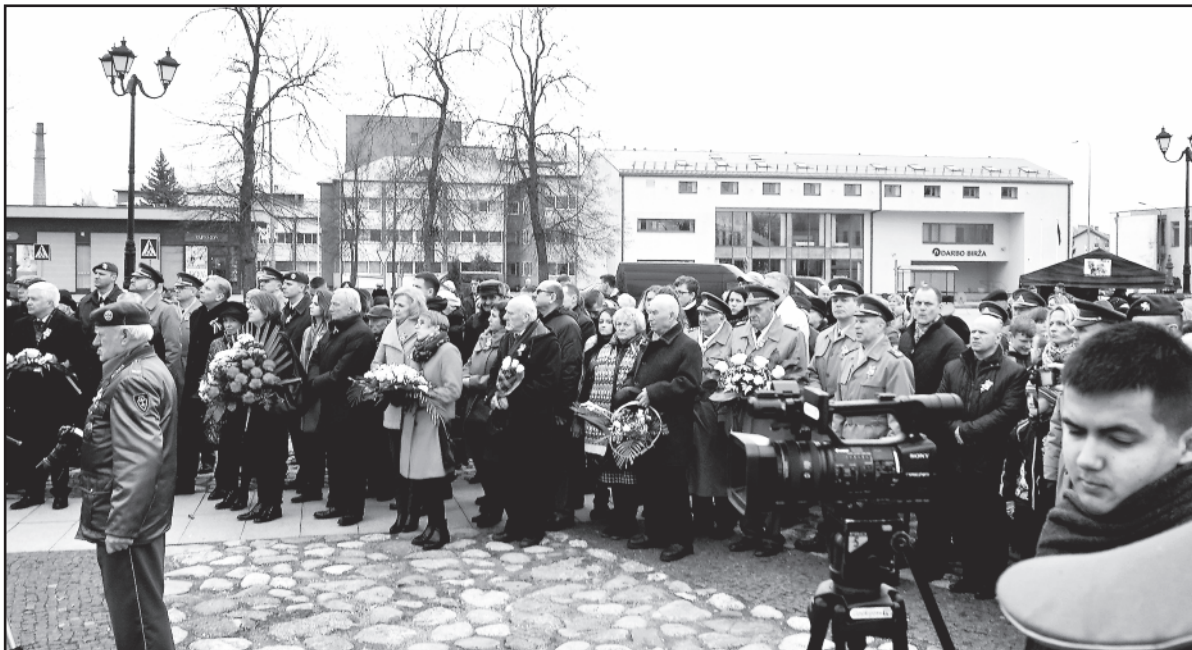
Renginyje Lazdijuose dalyvavo gausus svečių būrys.

Ji pasidžiaugė, kad šio partizanų vado atmini-