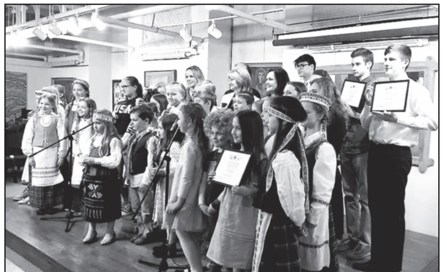
Konkurso nugalėtojai su organizatoriais.