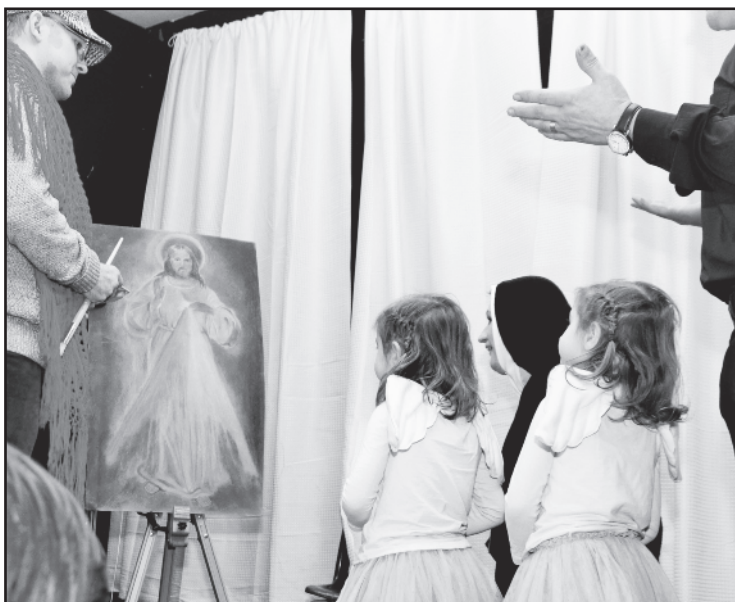
Kita parapijiečių grupelė teatralizuotai papasakojo apie šv. Kazimierą.

sumanymai ir bendros pastangos, kad visose lietuvių ir lietuvių kilmės kartose gilintume savo krikščioniškos ir tautinės tapatybės patirtį, stiprintume laisvos Lietuvos valstybės gyvenimą bei pilietiškumą ir pareigą pajusti savo bendruomeniškumą”.