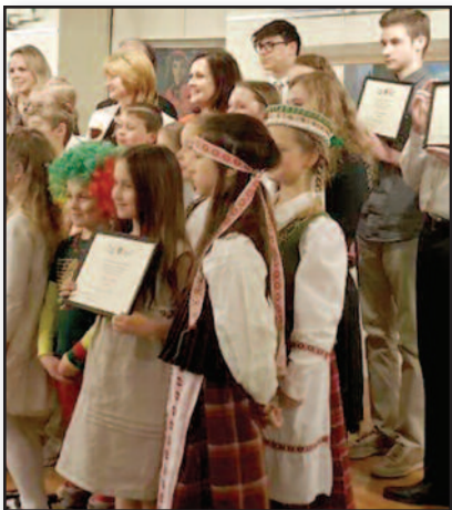
Jaunieji skaityvai eiles skyrė Lietuvai – 5 psl.