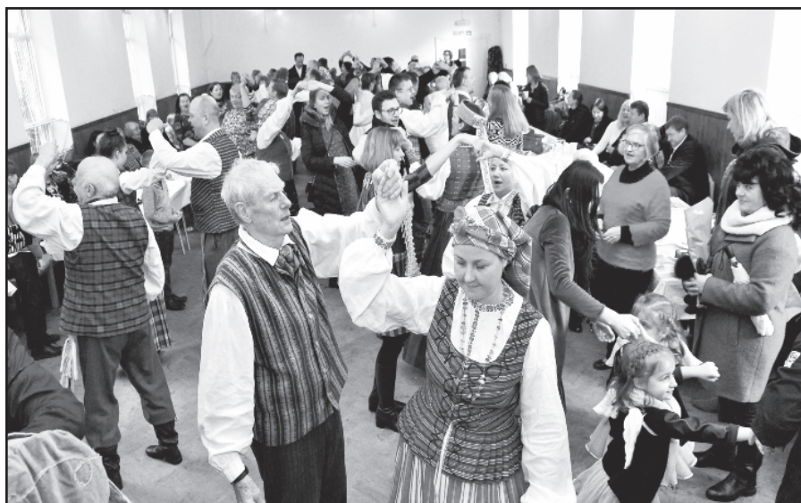
Į liaudiškų šokių sukūrį visus įsuko folkloro ansamblis „Saduto“.