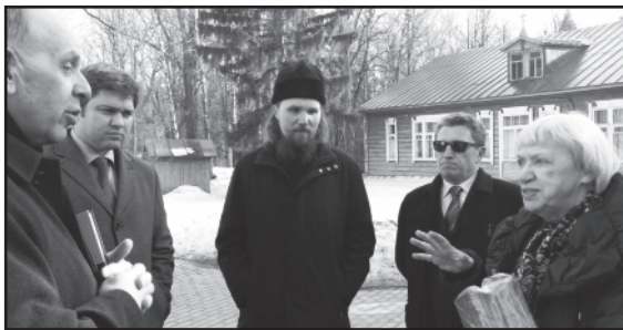
Palaidojimo vietą laikinai saugo ir prižiūri Rusijos stačiatikių bažnyčia.