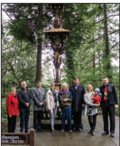
Lietuviškos šventės – nuo Portlando iki Havajų – 6 psl.