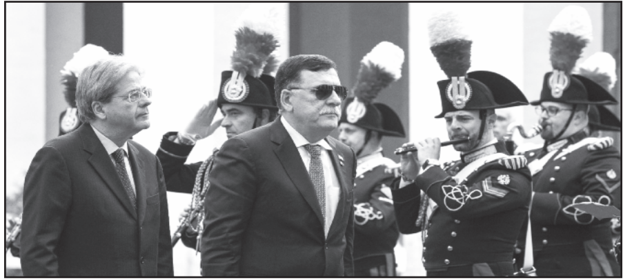
Italijos ministras pirmininkas Paolo Gentiloni (k.) Romoje priėmė Libijos premjerą Fayez al-Sarraj.

Roma (ELTA) – Europos Sąjungos (ES) ir Šiaurės Afrikos šalių ministrai susitiko Romoje, kur aptarė strategijas, galinčias padėti sumažinti į Europą atvykstančių migrantų skaičių.