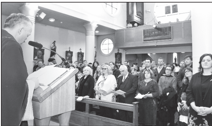
Savo globėjo dieną Londono šv. Kazimiero bažnyčia tradiciškai švenčia iškilmingomis šv. Mišiomis.