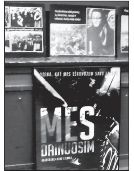
„Mes dainuosim“ filmo plakatas.