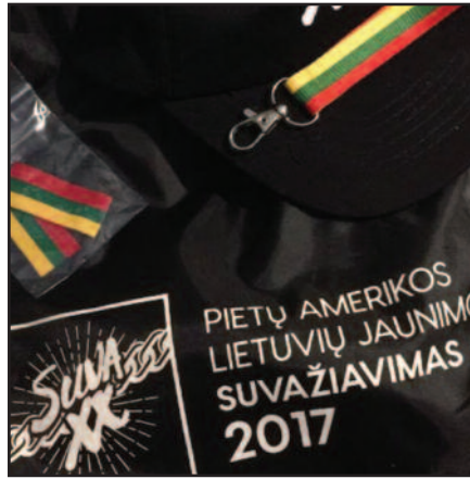
Kelionės prisiminimuose – ir Pietų Amerikos jaunimo suvažiavimas.

Į suvažiavimą susirinko jaunimas iš Brazilijos, Urugvajaus ir Argentinos. Berisso jaunimas viską organizavo, kūrė atributiką.