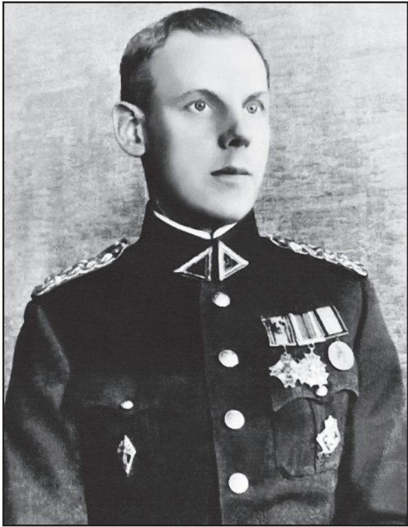
Plk. Juozas Vitkus-Kazimieraitis

Praėjusiais metais Jungtinėse Amerikos Valstijose buvo surengtas išskirtinai sėkmingas paramos telkimo vajas, skirtas surinkti lėšų garsaus partizanų vado, pulkininko Juozo Vitkaus-Kazimieraičio atminimui Lietuvoje įamžinti.