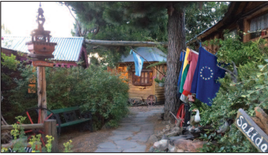
Taip atrodo jėjimas į muziejaus „Olgbun“ teritoriją, kurioje yra namelių, pavadintų Lietuvos miestų vardais.

kančiais lietuvių muziejų, šeiminkai kalbasi ispaniškai.