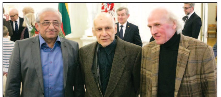
Nacionalinės premijos laureatai – džiazo muzikai Viačeslavas Ganelinas, Vladimiras Čekasinas ir Vladimiras Tarasovas.