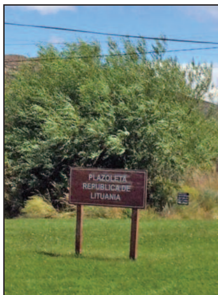
Mažoji Lietuvos aikštė Esquel mieste.