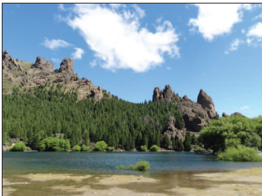
Keliautojus žavėjo Patagonijos kraštovaizdis.