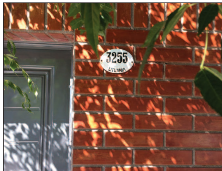
Buenos Aires priemiestyje Lanus yra ilga Lietuvos gatvė.