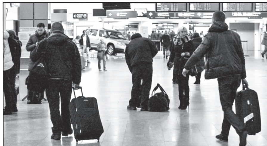
Abi Lietuvos Respublikos seko dėl didžiulės emigracijos. Bet dabartinė emigracija savo mastais gerokai lenkia tarpukario Lietuvą.

Bet panašu tai, kad nepriklausomybės paskelbimas abiem atvejais buvo tik kertinis akmuo – dar reikėjo daug pastangų kurti tą nepriklausomą valstybę. Pirmosios Respublikos Steigiamasis Seimas pradėjo darbą tik 1920 m., praėjus daugiau nei dvejiems metams po nepriklausomybės paskelbimo. To meto diplomatams, tarp kurių buvo kaip reta daug išskirtinių asmenybių, teko atlikti didžiulį darbą naujos valstybės vardą įtvirtinant Europoje – ir tai jiems pavyko. Ir pirmosios išsiveržusios iš Sovietų sąjungos, tuo pradėjusios šios aižėjimo procesą, Lietuvos pasaulis neskubėjo pripažinti: pirmoji tai išdrįso padaryti Islandija tik po 11 mėnesių (pirmoji gegužę tokį pareiškimą padarė Moldova, tačiau ji pati neturėjo nepriklausomos valstybės statuso). O paskutinis okupacinės Rusijos kariuomenės dalinys Lietuvos sieną kirtė po daugiau nei trejų nepriklausomybės metų 1993 m. rugpjūčio 31 d., beje, metais anksčiau nei Vokietijos, Latvijos, Estijos. Bet šiandien Lietuva – visų pagrindinių tarptautinių organizacijų narė.