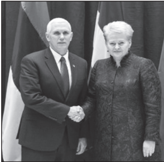
Prezidentė D. Grybauskaitė susitiko su JAV viceprezidentu M. Pence.

Pasak Lietuvos vadovės, išaugusi karinių incidentų bei provokacijų rizika verčia labai rimtai galvoti apie papildomas gynybos ir atgrasymo priemones. Visų pirma tobulinti ir greitinti NATO sprendimų priėmimo procesą, turėti pagal realias grėsmes nuolatos