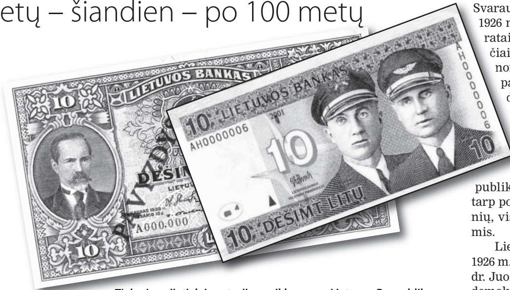
Tiek pirmoji, tiek ir antroji nepriklausoma Lietuvos Respublika neskubėjo leisti į apyvartą nacionalinės valiutos – litų.