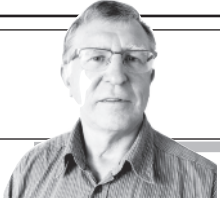
Parengė Vitalius Zaikauskas