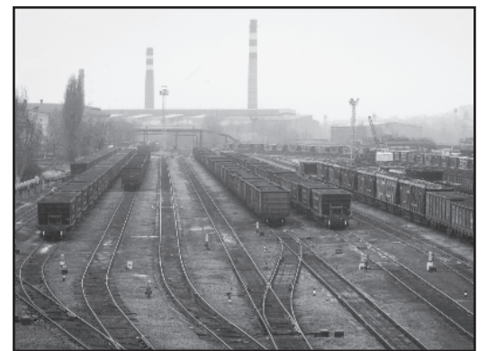
P. Porošenka tvirtina, kad negali neprekiuoti akmens anglimi iš okupuotų savo žemių.

„Perspėjame valdžią, prekiaujančią anglimis su okupuotomis teritorijomis ir darančia pinigus iš kraujo“, – demonstrantams sakė Ukrainos nacionalistų organizacijos savanorių ba-