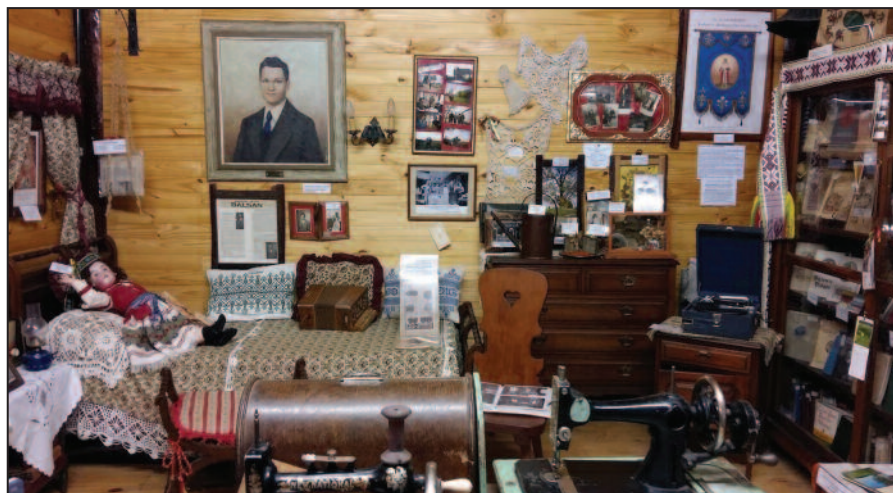
„Olgbrun“ muziejuje – daugybė apie Lietuvą pasakojančių eksponatų.