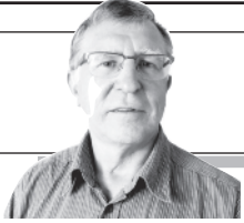
Parengė Vitalius Zaikauskas