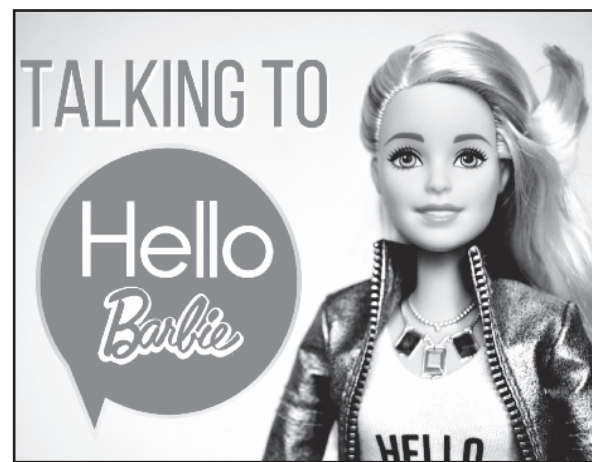
Žaislai apie vaikus gali žinoti daugiau, nei jų tėvai.

„Šie žaislai įrašo ir kaupia privačius mažų vaikų pokalbius be jokių apribojimų šios asmeninės informacijos rinkimui, panaudojimui ar atskleidimui, – savo skunde nurodo, EPIC ir kitos JAV tarnybos. – Šie žaislai nuolat stebi mažus vaikus ir yra naudojami daugelyje namų Jungtinėse Valstijose jiems netaikant jokių duomenų ap-