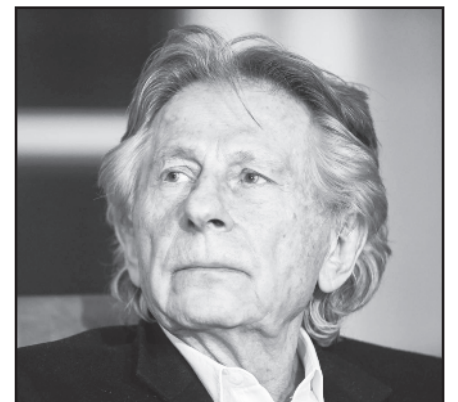
Lenkija neišduos R. Polanski.

JAV jau kelerius metus mėgina patraukti atsakomybėn R. Polanski dėl nepilnametės išprievartavimo 1977 metais. 2014-aisiais Lenkijai vėl buvo pateiktas prašymas išduoti režisierių, jį pernai teismas Krokovoje atmetė. Kadangi prokuratūra nepateikė apeliacijos, Z. Ziobro gegužę kreipėsi į Aukščiausiąjį Teismą.