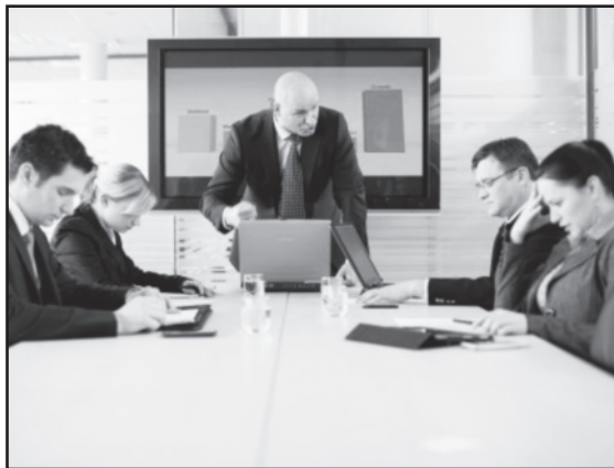
Pagalvokit apie save – ar nesat bjaurus vadovas?

Jei vadovas laiko visas įmonės valdymo vadžias savo rankose, tai dar tikrai nereikia, kad jis tinkamai vadovauja komandai. Specialistai pažymi, kad šiuolaikiniai vadovai neturėtų būti bjaurūs ar pernelyg griežti: jie privalo būti efektyvūs.