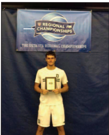
D. Šakinis: „Tikslas – laiminga šeima“ – 8 psl.