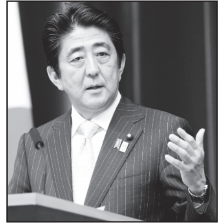
Japonijos premjeras Sh. Abe lankysis Havajuose, bet neatsiprašys.

tino 1941 metų gruodžio 7 dienos puolimo prieš JAV karinę jūrų bazę metinės. Tada žuvo apie 2 400 amerikiečių.