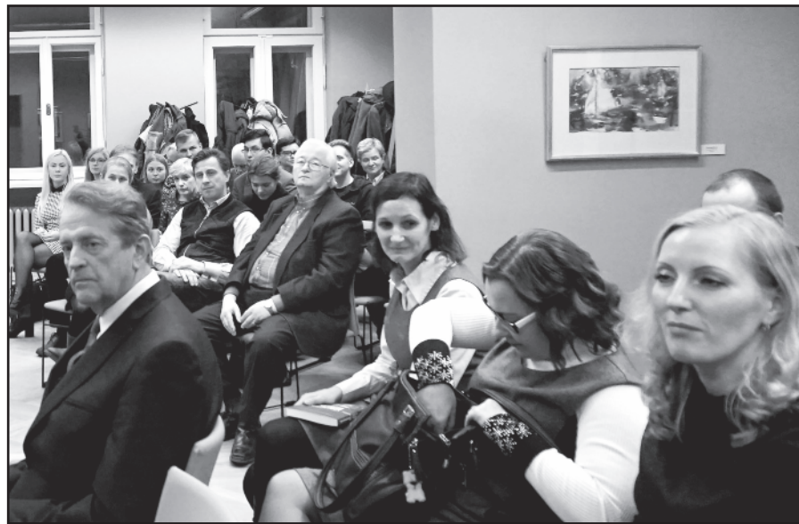
Minėjimas Prezidento V. Adamkaus bibliotekoje-muziejuje.