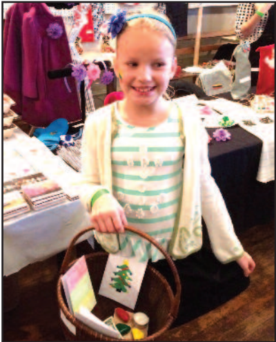
„Krėviukų kampas“ Philadelphijos mugėje – 4 psl.