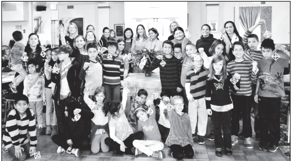
Mažieji muziejaus svečiai išmoko, kaip pagaminti kalėdinės eglutės žaisliuką iš plastikinių šiaudelių.