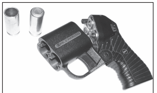
JAV policininkai bus apginkluoti rusiškais ginklais „Osa“.

Jame pažymima, jog tai – pirmasis šių laikų atvejis, kai JAV jėgos struktūros oficialiai įsigyja Rusijoje pagamintus neletalinius ginklus, kurie skirti ne priešininkui nukauti, o jam neutralizuoti. Vadinamasis „humaniškas“ trauminis pistoletas, galintis