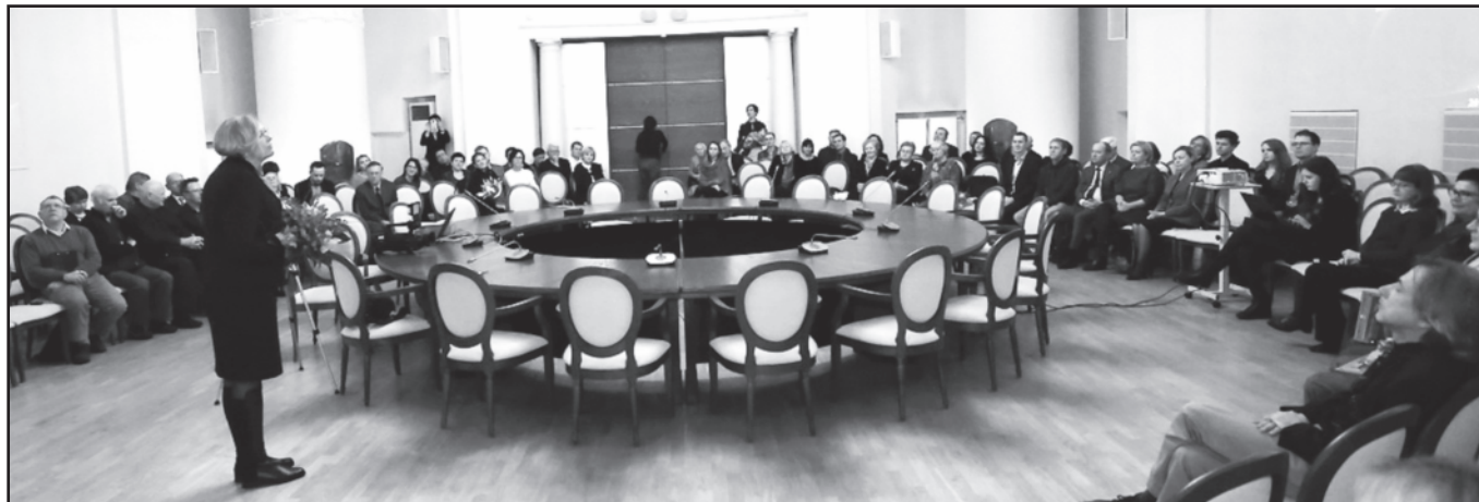
Užsienio lietuvių mokslininkų apdovanojimo iškilmės.