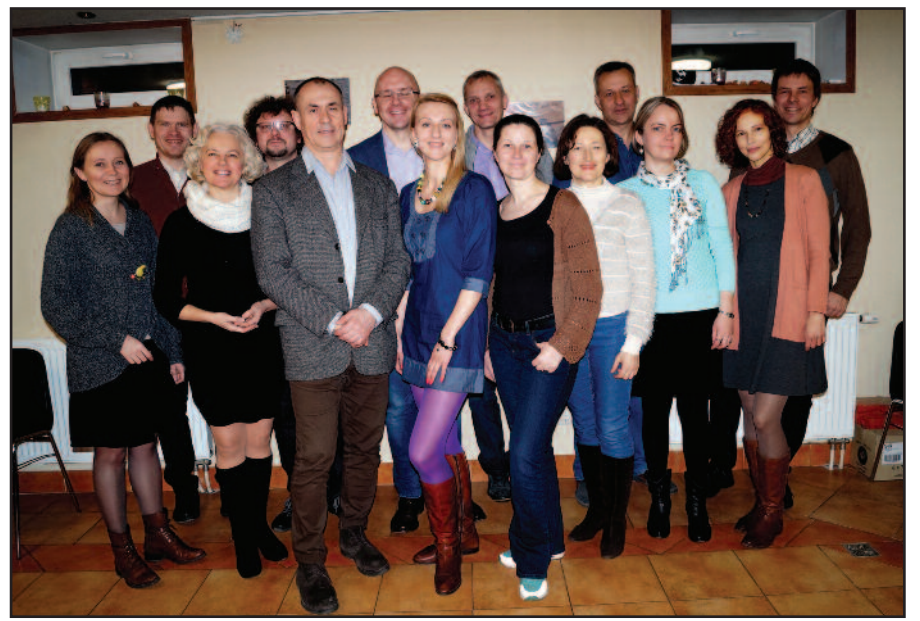
LGUVO „Sugrįžus” visuotiniame susirinkime 2016 m. vasario 27 d.

Organizacija „Sugrįžus” gyvuoja jau dešimt metų. Tuoj švęsime įkūrimo jubiliejų. Reguliariai, kartą per mėnesį, susitinkame. Kartais užtenka tik susibėgti kavinėje, pabendrauti ir gerai praleisti laiką. Ateina vis naujų žmonių. Kiti išeina, bet branduolys išlieka. Organizacija dabar vienija ne tik Ame-