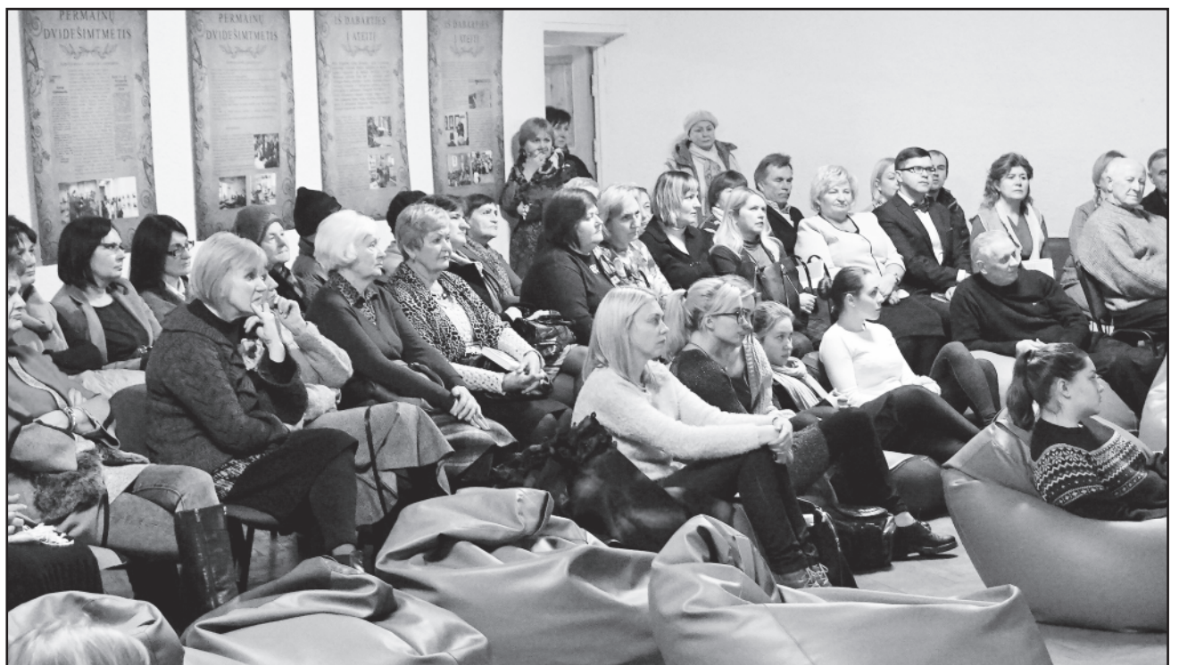
Susitikimas su knygos autoriumi Marijampolėje sulaukė nemažo susidomėjimo.

Jis baigė Vilniaus kunigų seminariją, po to studijavo Prancūzijoje, o 2007 m. buvo išsventintas į kunigus. Po studijų Italijoje 2012 m. kunigas apsigynė dvasinės teologijos licenciatą laipsnį ir buvo pa-