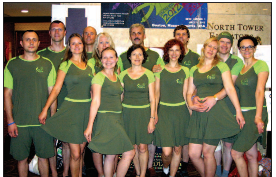
Kolektyvas „Sugrįžus” 2012 m. vasarą XIV Lietuvių tautinių šokių šventėje Bostone: „Sugrįžome į Lietuvą, sugrįžome ir į JAV”.

rikijoje gyvenusius ir iš jos sugrįžusius lietuvius, – į susitikimus ateina ir kitose pasaulio šalyse gyvenę ar lankę lietuviai. Mūsų bendravimo pagrindine priežastimi tapo grįžimas į Lietuvą”.