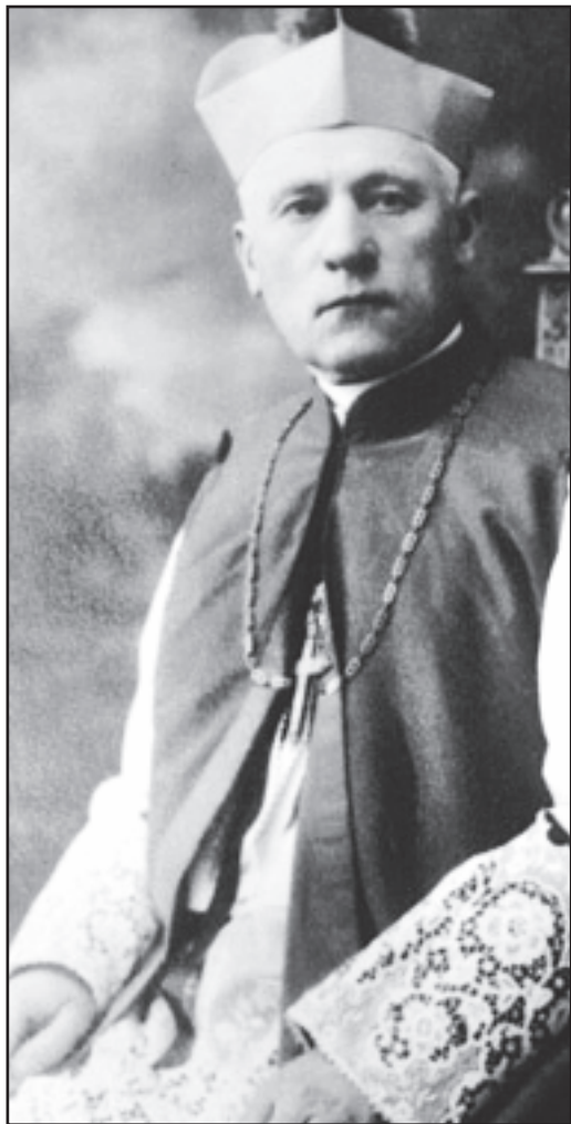
Arkivyskupas T. Matulionis.