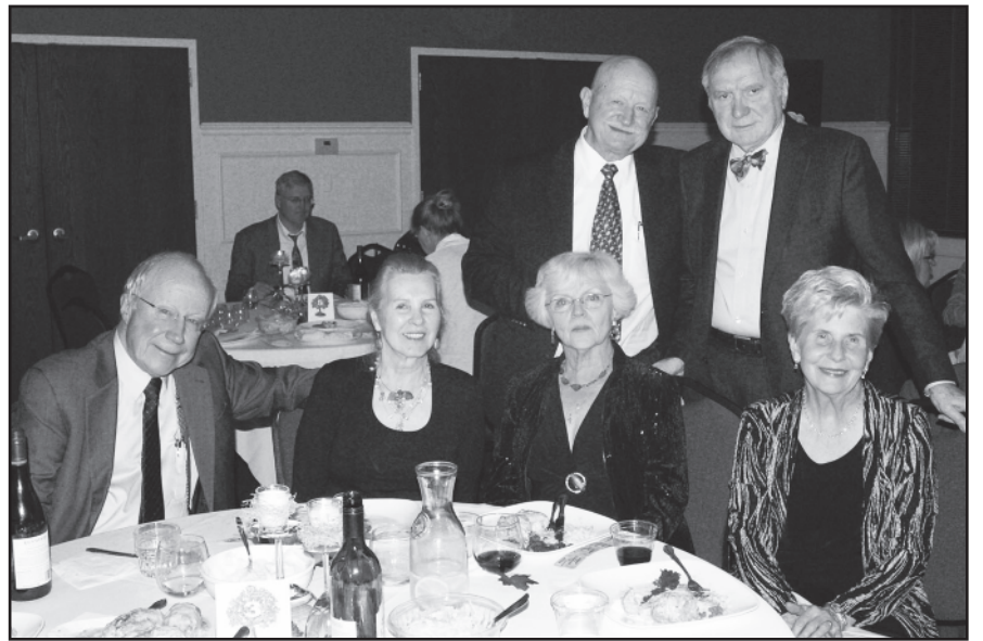
„Gintarinio rudens“ dalyviams buvo smagu susitikti ir pasikalbėti rūpinčiomis temomis. Vakaro svečiai atsinešė gerą nuotaiką.