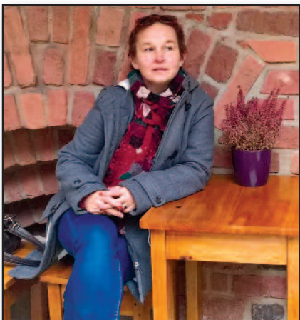
Lietuvių kalbos vėliavnešė Krokovoje – 3 psl.