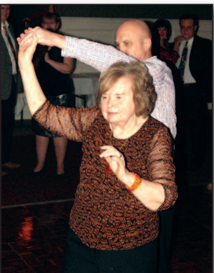
Prasminga „Gintarinio rudens“ vakaronė – 4 psl.