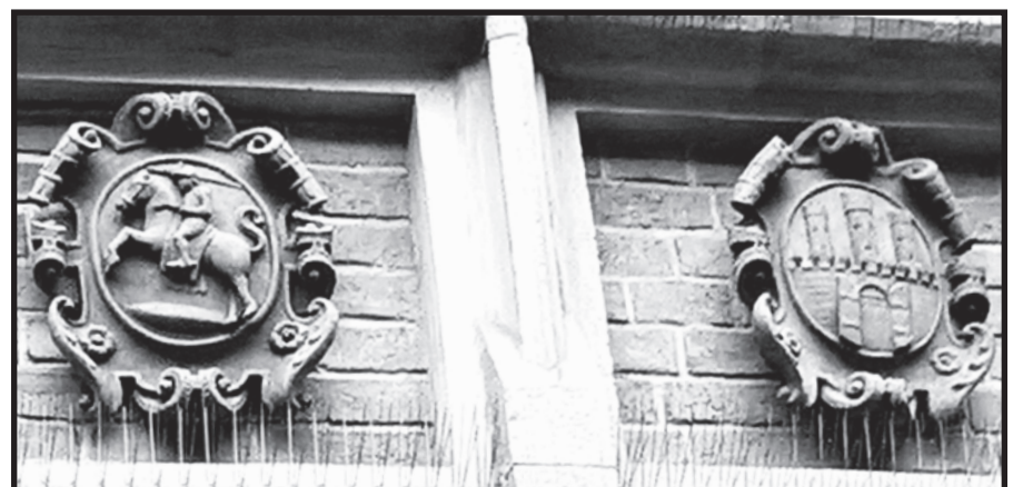
Tai, kad lietuvių ir lenkų istorija tampri, o šių dviejų tautų intelektualų dialogas vyksta iki šiol, byloja ir mūsų Vyčio herbas, puošiantis Jogailaičių universiteto pastato frontoną.