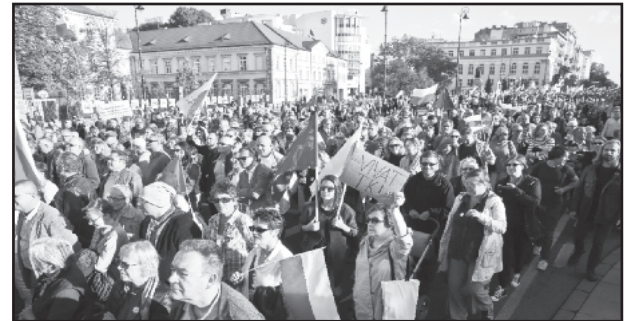
Varšuvoje protestuota prieš vyriausybę. Miesto valdžios duomenimis, į gatves išėjo iki 30 000 lenkų.

Prieš protesto eitynes buvęs lenkų disidentas ir publicistas Adam Michnik išpėjo vyriausybę dėl galimų konstitucijos pažeidimų. KOD, anot jo, nenori nuversti vyriausybės, o tik siekia,