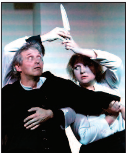
„American Dream“ prisilietė prie jautriausių jausmų – 5 psl.