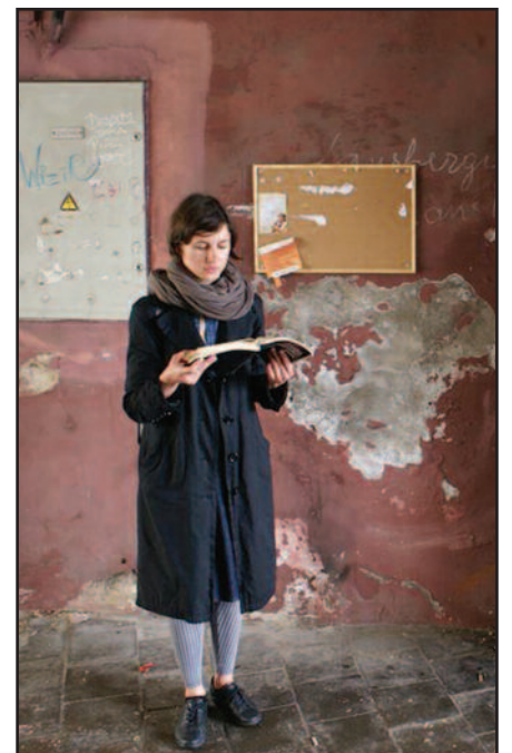
Minint 75-tąsias Lietuvos žydų žudynių metines Holokausto aukų vardai buvo skaitomi visoje Lietuvoje.