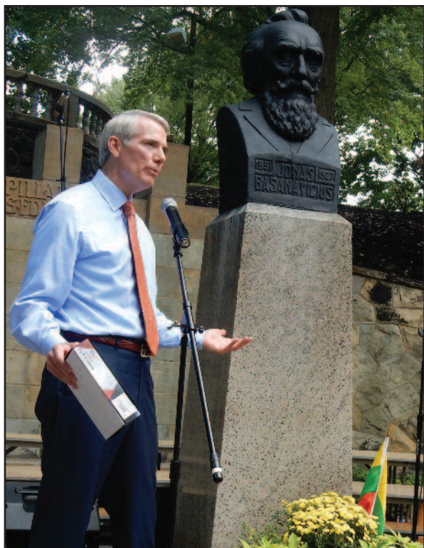
Senatoriaus R. Portman pasakė įspūdingą kalbą, kurios metu Darželių atstovai buvo iškelta Amerikos vėliava, plevesavusi virš JAV kapitolijos Washingtone.

Lietuvių kultūriniuose darželiuose, apart senatoriaus Portman, yra kalbėję: Prezidentas Antanas Smetona, Clevelando merai, JAV senatorius John Glenn ir Ohio gubernatorius Bob Taft.