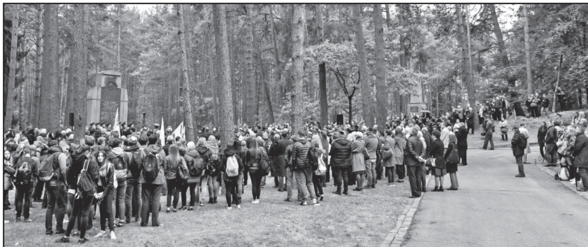
Panerių memoriale – Lietuvos žydų genocido aukų pagerbimo apeigos.