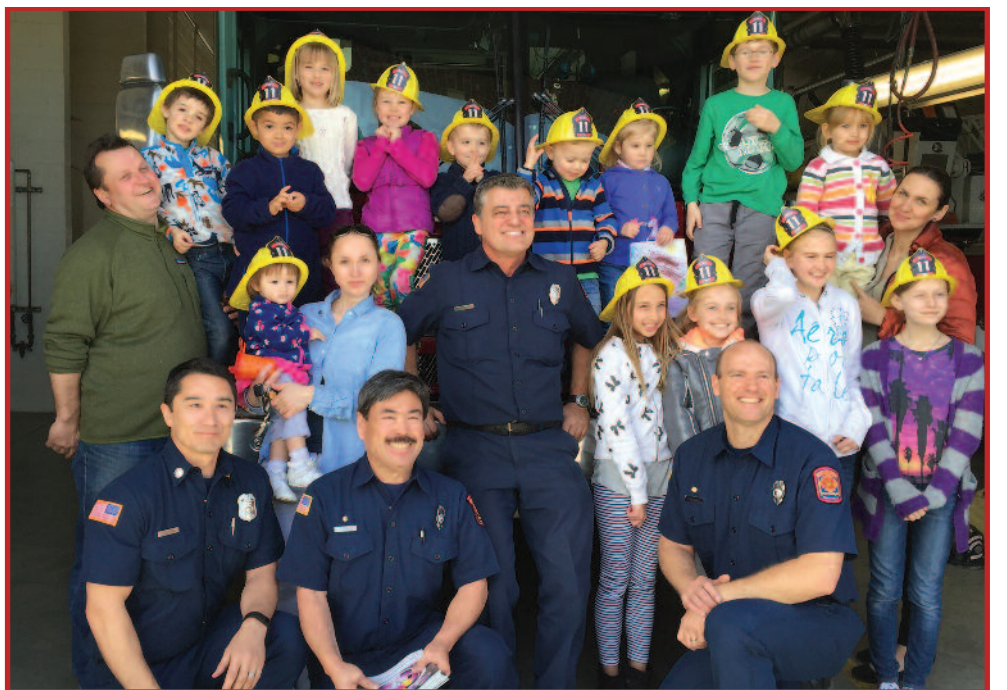
Ugniagesių stoties Nr. 11 patalpose laikinai veikia Reno, Nevados, vaikų lituanistinė sekmadieninė mokykla.

Netiesa, kai sakoma, kad mūsų norai visada pavaldūs galimybės. Yra tvirtai manančių, kad svarbu labai norėti, o galimybės visada atsiras. Aki-vaizdus pavyzdys – vos prieš pusę metų Nevadoje, Reno mieste, įsikūrusi pirmoji naujos kartos lietuvių išėivių bendruomenė. „Nevada“ – taip pasivadino šis išėivijos sambūris ir per labai trumpą laiką jau spėjo įsitikinti, koks