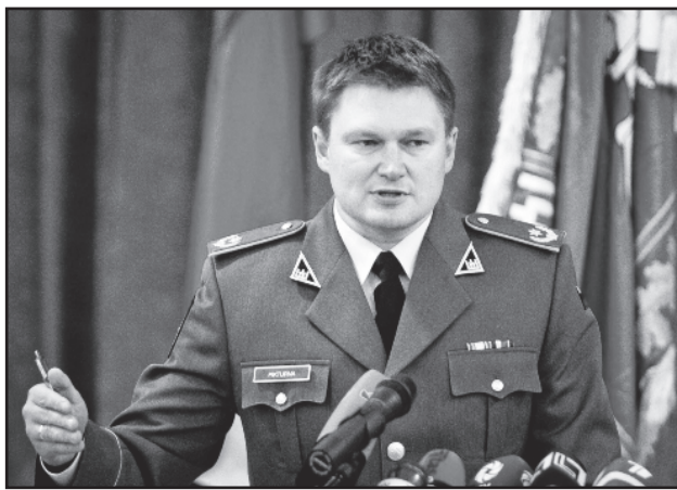
Pulk. S. Piktorna nuslėpė vedęs Lietuvos nepripažįstamos Krymo aneksijos pilietę.

Dėl karininko ministerija yra kreipusis į Lietuvos karinę žvalgybą, kad būtų išsiaiškintos visos aplinkybės. „Antrasis operatyvinių tarnybų