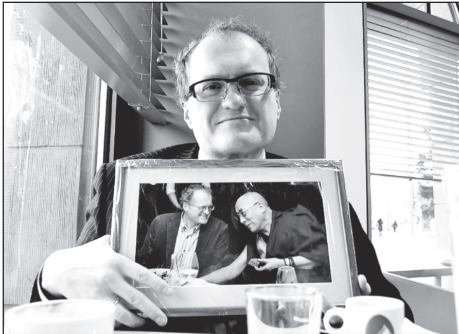
Leonidas Donskis susitikimą su Dalai Lama įamžino nuotraukoje.

turėjo tokią pat formalią teisę būti piktas dėl Lietuvos teritorijoje išžudytos prieškarinio žydų bendruomenės ir mėtytis tokiais pat apibendriniais kaltinimais, kaip ir daugelis kitų Lietuvoje ir pasaulyje, bet jis buvo kitoks. Štai paskutiniame interviu prieš keletą savaitių „Kauno dienos“ korespondentui L. Donskis sakė: Holokaustas „yra tiesiogiai palietęs mano šeimą, todėl į tai žvelgiu labai atsargiai. Gyvenimas išmokė praeitį vertinti labai ramiai, subalansuotai, suvokiant, kad tie dalykai labai daug sveria. Visada jaučiu pavojų pradėti perkelti atsakomybės našą (kartais visiškai neuztarnautą politinę ir etinę) ant niekuo dėtų žmonių pečių. Vengiu to, nes tai būtų labai neteisinga ir nehumaniška. Nenoriu traumuoti žmonių ir jiems pasakoti dalykų, kurie sukurtų jausmą, kad jie kažkodėl yra nusidėję ir kalti. Tai būtų visiškai nesąmonė. Nespekuliuoju tais dalykais, jaučiuosi atsakingas už orų ir garbingą kalbėjimą apie šį sudėtingą reikalą. Pripažinsiu, apie tai kalbėti labai sudėtinga, nes tai tiesiogiai palietė mano šeimą. Esu Holokaustą išgyvenusio žydo sūnus. Mano tėvas per stebuklą liko gyvas Butrimonyse, mažame miestelyje šalia