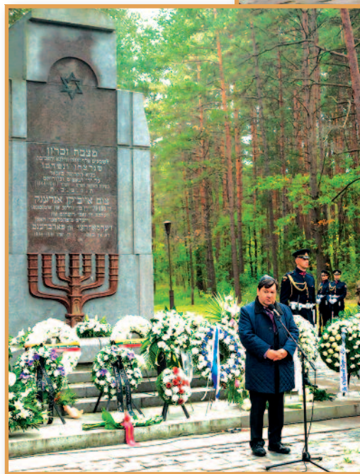
Tarptautinės komisijos nacių ir sovietinio okupacinių režimų nusikaltimams Lietuvoje įvertinti pirmininkas, Nepriklausomybės akto signataras Emanuelis Zingeris prie Panerių memorialo.

Penktadienį, rugsėjo 23 d. Panerių memoriale pagerbtos žydų genocido aukos. Aštuoniolikoje šalies miestų ir miestelių buvo skaitomi žydų genocido aukų vardai. Tolerancijos ugdymo centrai ir kitos švietimo institucijos dalyvavo pilietinėje iniciatyvoje „Atminties kelias“ – ėjo į masines žydų žudynių vietas tais keliais, kuriais žydai buvo varomi į paskutinę savo kelionę. Lietuvoje tokių vietų yra daugiau nei 200.