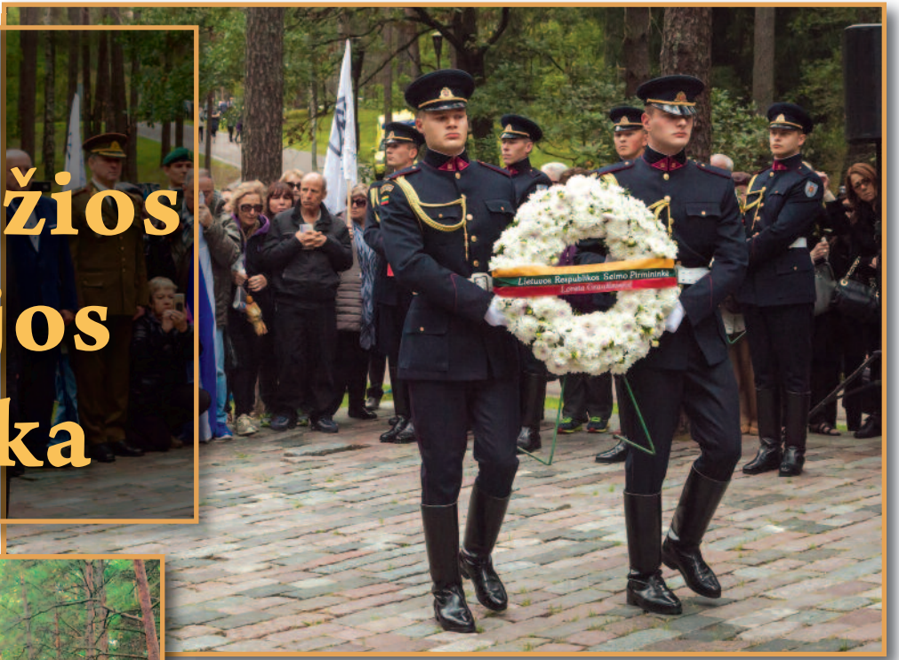
Panerių memoriale – Lietuvos žydų genocido aukų pagerbimas.