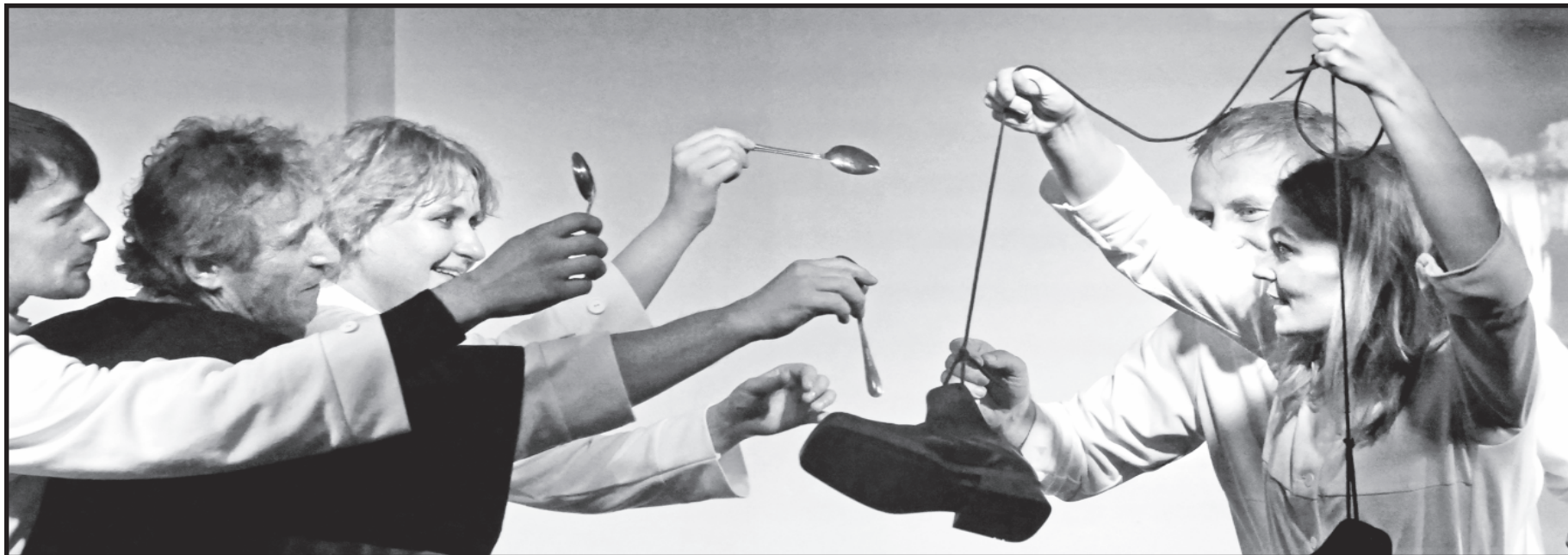
„Šaukštas“ – šeima, namai, sotumas – emigranto atiduodamas į kelionės batą.