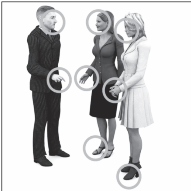
Sėkmės versle gali atnešti ir kūno kalba.

Verslininkai labai dažnai dalyvauja pristatymuose. Finansinių ataskaitų pristatymas įmonės vadovams ar investuotojams, verslo paslaugų pristatymas potencialiam klientui – netgi gali tapti pasakoti savo sėkmės istorijas verslo reginiuose. Kad ir kokia tai būtų proga, visais atvejais reikės nuoseklumo, aiškumo, pasitikėjimo ir stovėsenos, todėl mokykitės šių dalykų iš anksto.