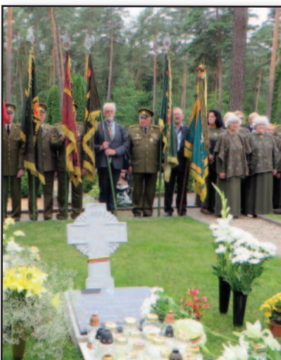
Monsinjero A. Svarinsko ir jo bendražygių minėjimas – 14 psl.

DRAUGAS Mano laikraštis nuolatinis, patikimas, mus rišantis.