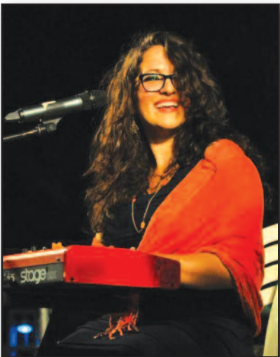
Džiazo atlikėja su lietuviškom šaknim – 4 psl.