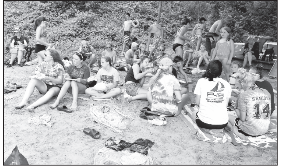
Buriavimo stovyklos stovyklautojai skaniai valgo pietus prie ežero.