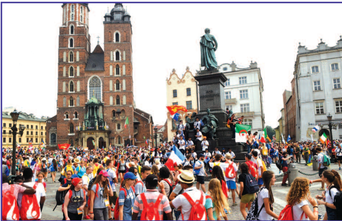
Krokvą užtvindė jauni žmonės, atvykę iš įvairių žemės kampelių.

Neškite Kristaus gailestingosios meilės, apie kurią kalbėjo šventasis Jonas Paulius II, liepsną į savo kasdienio gyvenimo aplinką ir ligi žemės pakraščių. Šioje misijoje lydėsiu jus savo palinkėjimais bei maldomis. Šioje paskutinėje dvasinio pasirengimo artėjančiai Pasaulio jaunimo dienai Krokuvoje kelionės atkarpoje visus jus patikiu Mergelei Marijai, Gailestingumo Motinai, ir iš visos širdies laimiu.