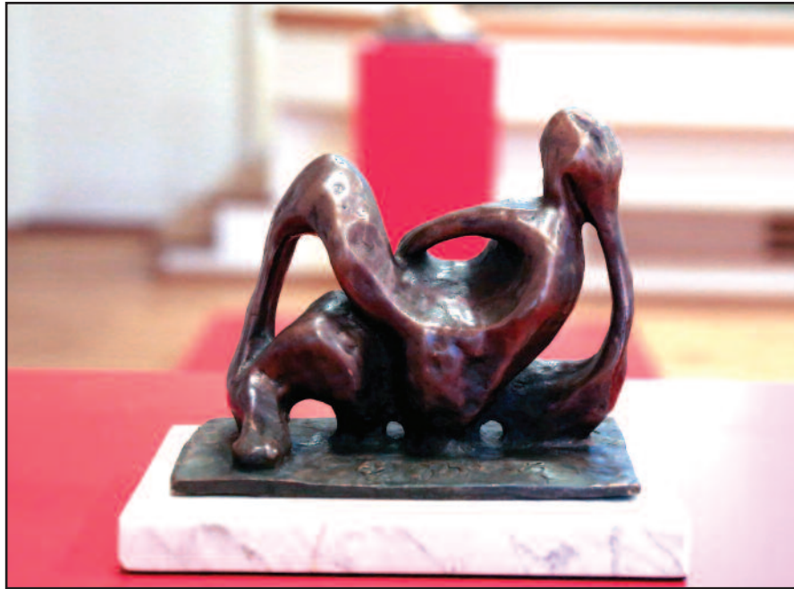
J. Lipchitz miniatiūra, pavadinta „Russian-Lithuanian Abstract“.

Parodoje eksponuojamos menininko litografijos (eskizai žymiosioms skulptūroms), piešiniai, asme-