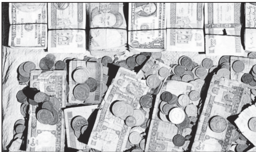
Auga ir perlaidų skaičius ir siunčiamos pinigų sumos.