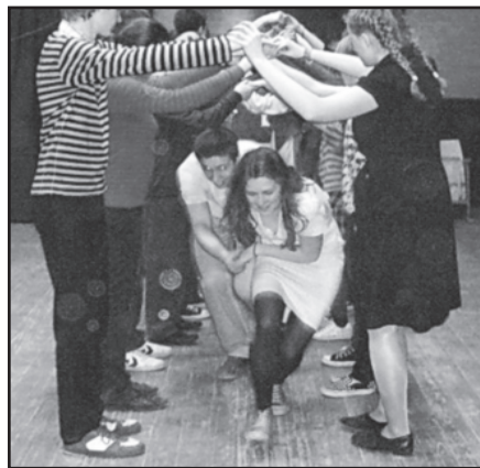
Įvairaus amžiaus žmonės mokysis šokti.

Šiomet stovykla vyks Žemaitijoje, Burbiškių kaime, todėl daug dėmesio