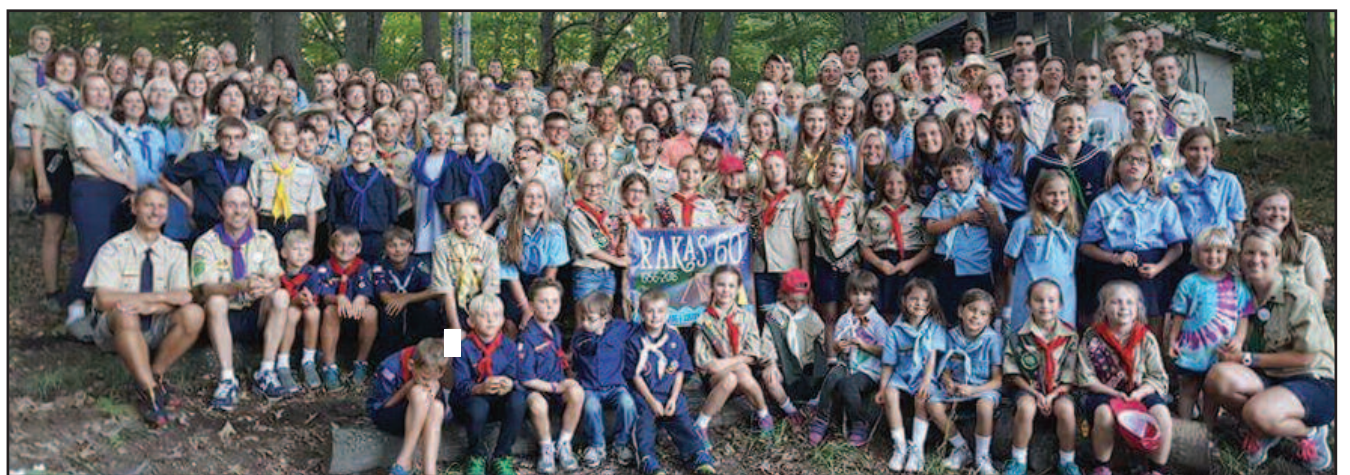
Rakas-60! Stovyklautojai ir vadovai.

Šių, 31-ųjų, Jaunimo dienų globėjai yra šv. Jonas Paulius II ir s. Faustina Kowalska. Nors gyvenę panašiu metu, tačiau nė karto nesusitikę šventieji nešė į pasaulį Dievo Gailestingumo žinią. – 9 psl.