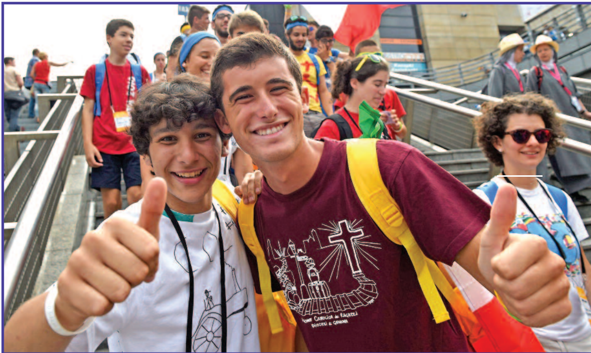
Dalyvavimas Pasaulio jaunimo dienose išliks atmintyje visą gyvenimą.