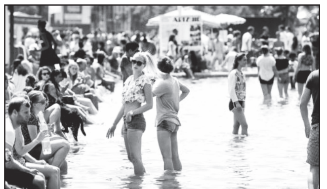
Šis birželis buvo karščiausias.

New Yorkas (ELTA) – Praejęs birželis vėl pagerino temperatūros rekordą: JAV Nacionalinės vandenynų ir atmosferos administracijos (NOAA) duomenimis, tai buvo karščiausias birželio mėnuo pasaulyje nuo orų stebėjimo pradžios 1880-aisiais.