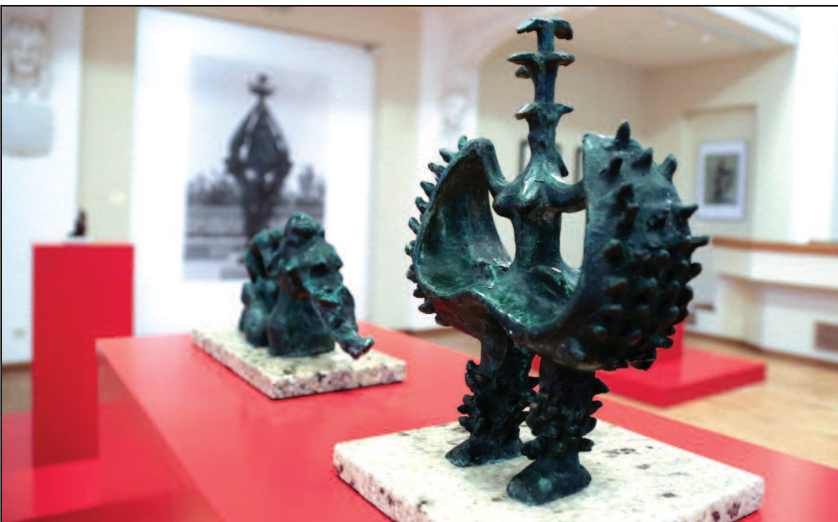
Viena iš parodos „Gyvenimas skulptūroje“ salių Tolerancijos centre Vilniuje.