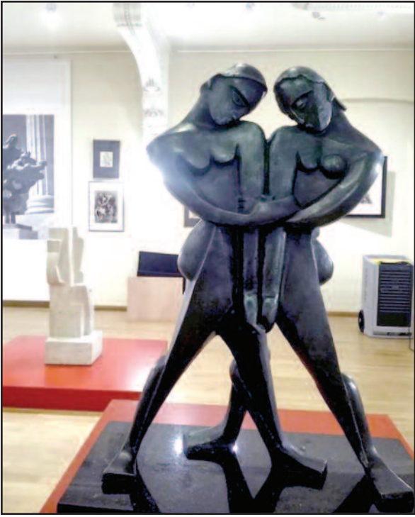
J. Lipchitz skulptūra „Susitikimas“.