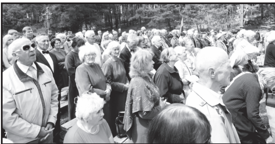
Šv. Mišių susikaupimas.