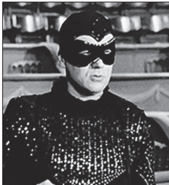
Georg Ots – „Misteris Iksas“