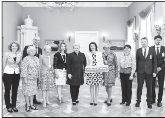
Prezidentė priėmė PLB valdybą.

Prezidentė pakvietė užsienyje gyvenančius lietuvius aktyviai dalyvauti