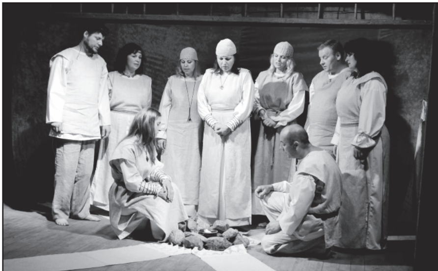
Utenos „Žaliaduonių“ teatras, V. Baltrušaičio prizo „Veidu į Lietuvą“ laureatas.