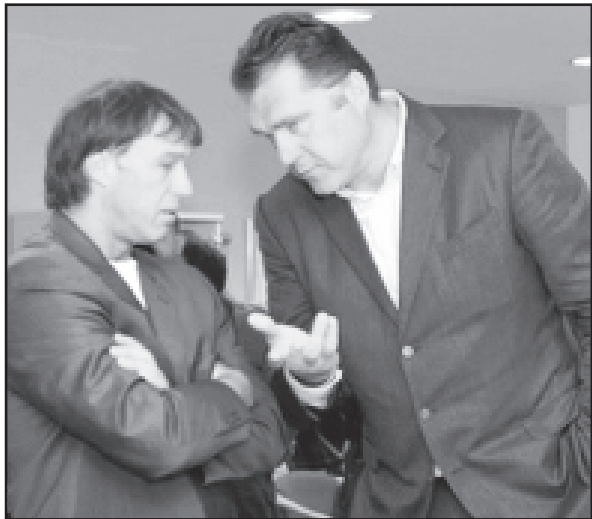
Krepšinio grandai Šarūnas Marčiulionis ir Arvydas Sabonis po Atlantos žaidynių atsisveikino su rinktine

Tęsinys. Pradžia liepos 9, 12 ir 4 d. laidose