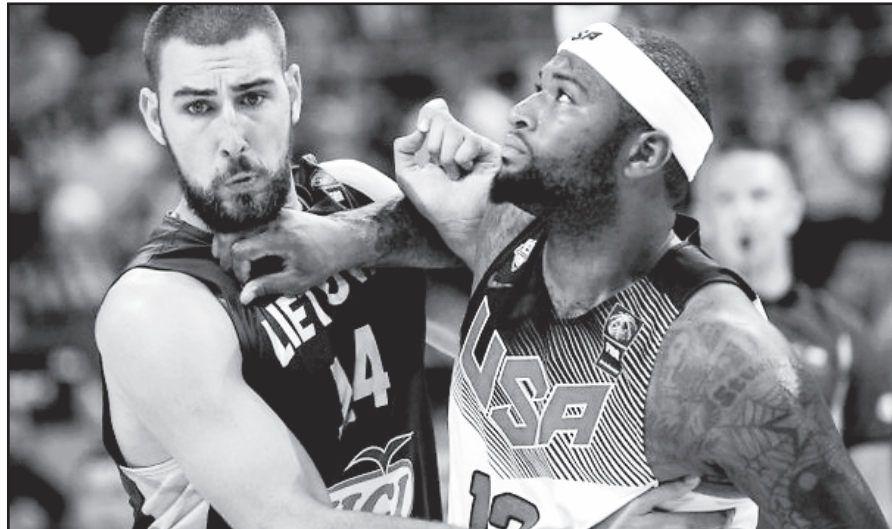
Lietuvos krepšininkai priskiriami prie olimpinė žaidynių pajėgiausių. Jų prisibijo netgi JAV komanda.