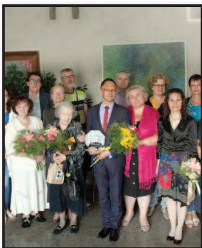
Jurbarke prisimintas Vladas Baltrušaitis – 5 psl.