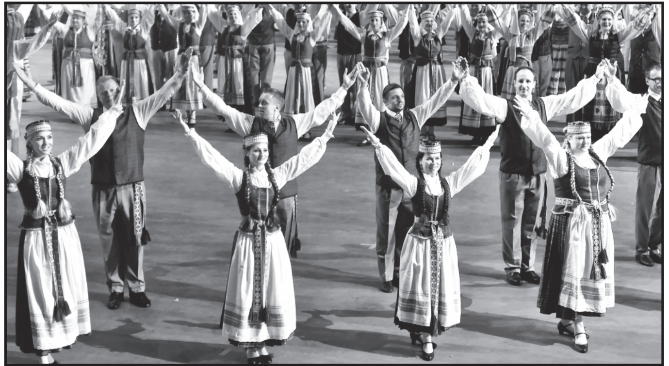
Malonu buvo stebėti nuostabios „kelionės“ vaizdus.