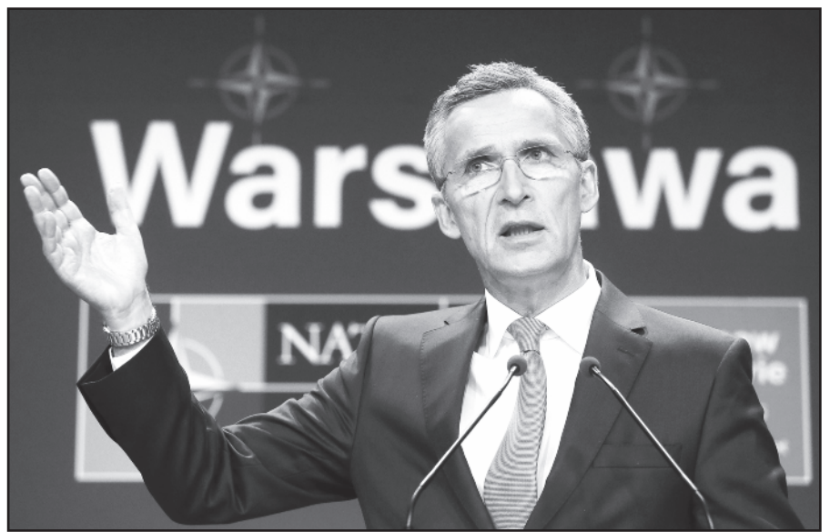
NATO generalinis sekretorius Jens Stoltenberg.

Būta ir dar aštresnių pasisakymų Rusijos atžvilgiu.