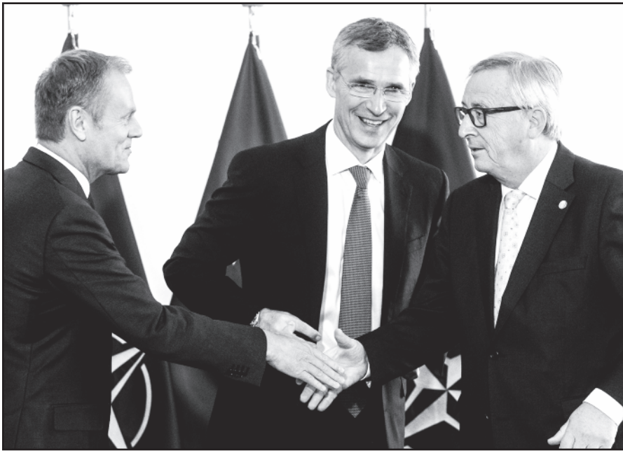
Iš k.: Europos Vadovų Tarybos pirmininkas D. Tusk, NATO generalinis sekretorius J. Stoltenberg ir Europos Komisijos pirmininkas J. C. Juncker pasirašė NATO ir ES deklaraciją dėl bendradarbiavimo plėtojimo.