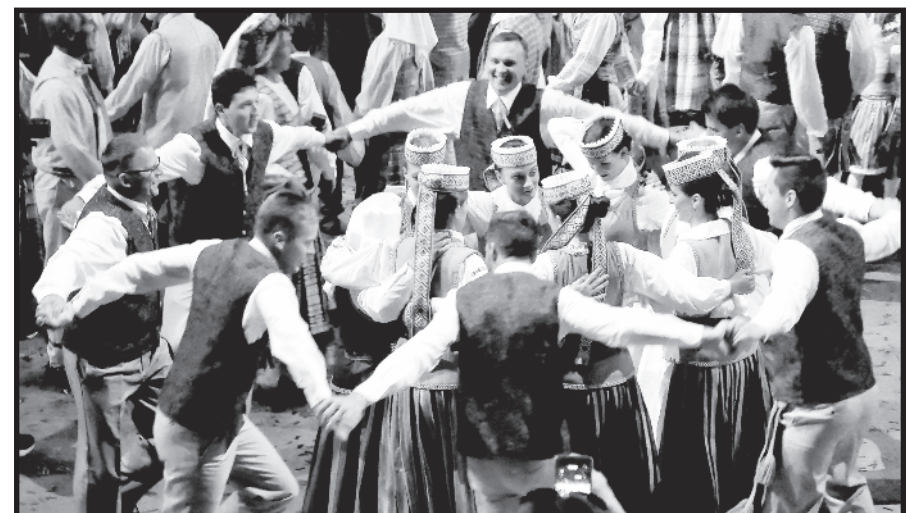
Jackson, NJ šokėjai pateisino savo grupės vardą – „Viesulas“