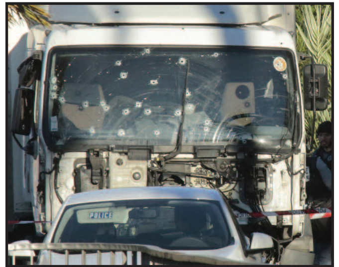
Kulkų suvarpytas žudiko įrankis – sunkvežimis.

Pasaulio šalių vadovai, kalbėdami apie 84 žmonių gyvybes nusinešusį išpuolį Nijoje, išsako baimę, liūdesį ir reiškia solidarumą Prancūzijai.