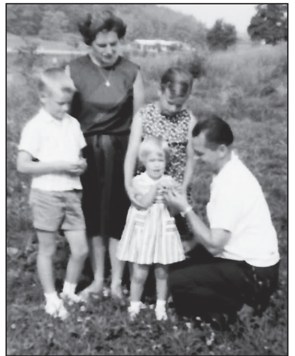
Zarankų šeima Dainavoje. 1968 m.

Į Ateitininkų stovyklą važiuodavau dar nevedęs, o sukūręs šeimą vasaromis Dainavon važiuodavom kiekvieną sekmadienį. Pamenu, kai Dainavoje dar nebuvo sąlygų su šeima nakvoti, kelis sykius miegojome name, kuris stovėjo stovyklos žemėje Austin Rd., kitoje pusėje. Siuntėme vaikus į stovyklą. Apie