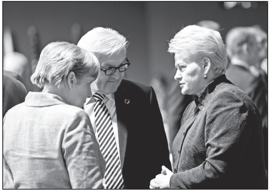
Prezidentė Dalia Grybauskaitė su Vokietijos kanclere Angela Merkel ir Vokietijos užsienio reikalų ministru Frank Steinmeier.