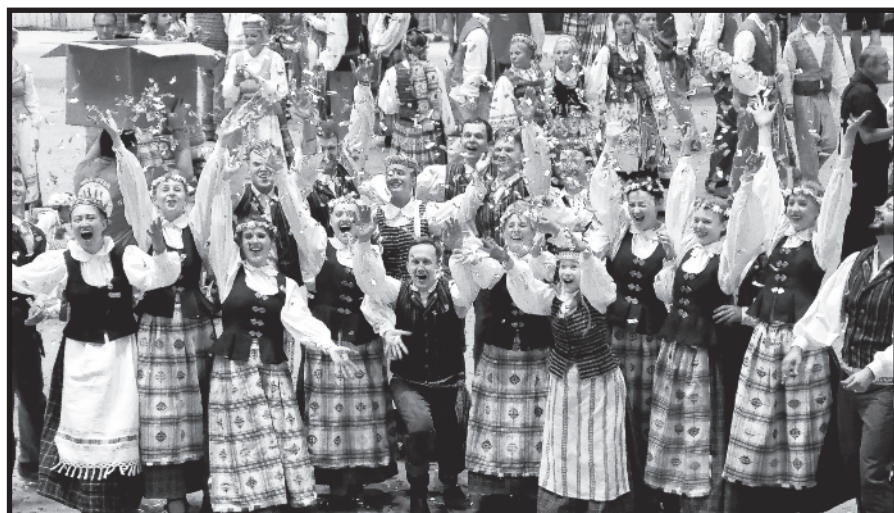
Į šventę atvyko net ir lietuvičiai iš Švedijos – šokių grupė „Baltija“