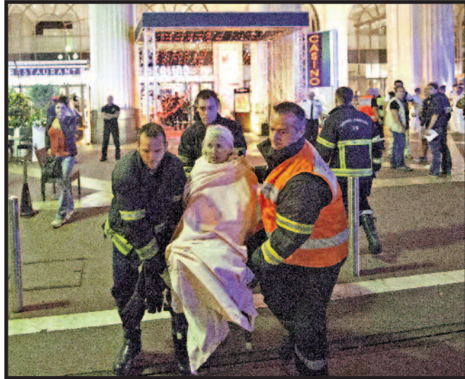
Vietoje šventės – kraujas, baimė ir siaubas.