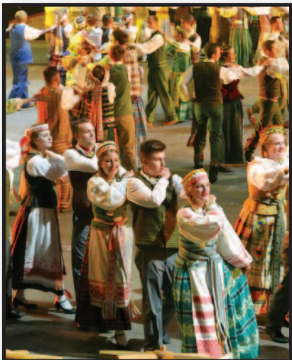
Šokių šventė: žvilgsnis iš Rytų pakrantės – 4 psl.