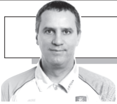
Parengė Dainius Ruzevičius