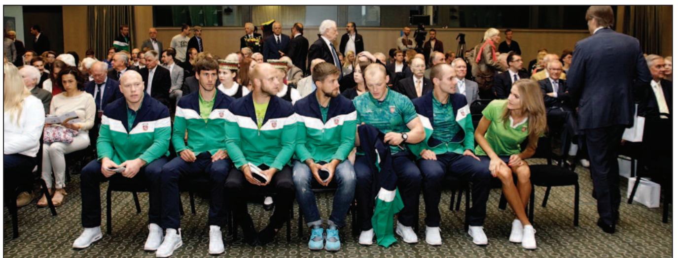
Lietuvai olimpinėse žaidynėse atstovaus 68 sportininkai.