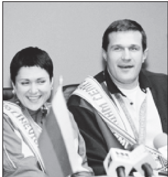
Olimpiniai čempionai Daina Gudzinevičiūtė ir Virgilijus Alekna.