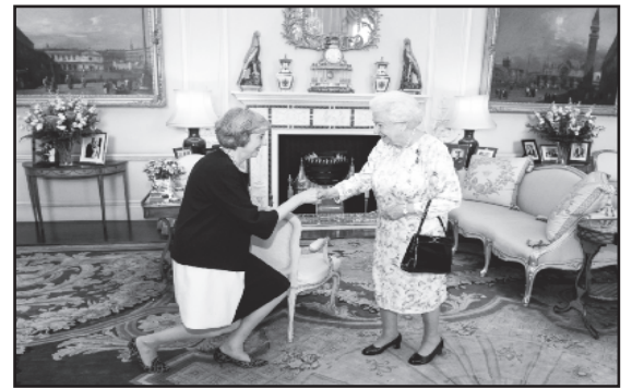
Jungtinės Karalystės karalienė T. May pavedė premjerės pareigas.

Praėjus kelioms minutėms po paskyrimo T. May prie Downing Street 10 pasakė savo pirmą trumpą kalbą. Ji pareiškė kovosianti su neteisybe. Didžioji Britanija esą turi būti visų piliečių sąjunga. Ji nuteikė gyventojus