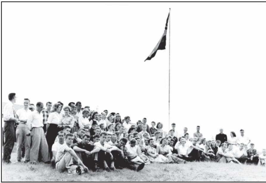
Ateitininkų stovykla Dainavoje. 1957 m.