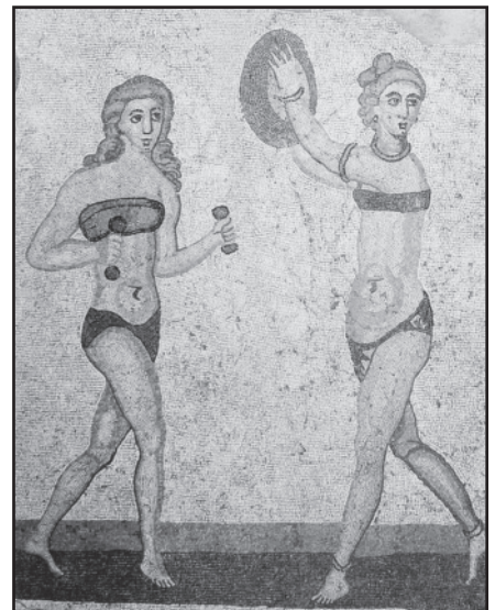
Freskos fragmentas senovės romėnų Villa Romana De Casale Sicilijoje. 283–305 m. pr. m. e.

riausiu maudymuku pasaulyje. Anot prancūzo madų istoriko Olivier Sailard, tai įvyko „moterų, o ne madų pasaulio dėka“. „The Costume Institute of the Metropolitan Museum of Art“ tyrimų specialistė Beth Dincuff Charleston tvirtina, jog nuo 2000-ųjų bikinių tapo net 811 milijonų dol. metiniu verslu. Dėl jų populiarumo tapo labiau perkamos ir kitos prekės, pavyzdžiui, saulės apsaugos kremai.