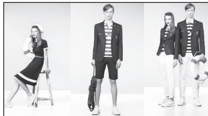
Prie estų olimpinės aprangos prisidėjo ir Lietuvos įmonės.

Estų dizainerė Maja Lullu pabrėžia, jog ši kolekcija apima viską – joje