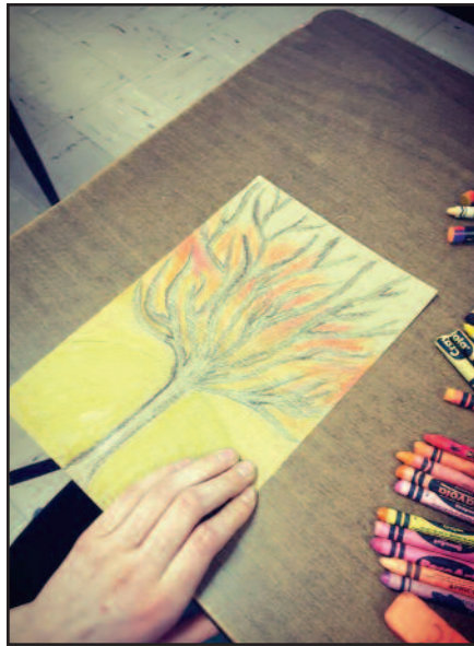
Tairas Čikotaitis piešinys.

Mokiniai, apibūdindami paveikslus, kalba apie savo asociacijas: ką jie mato? Kas sudaro tą ypatingą paveikslų aurą ir skambėjimą? Jeigu patys mokiniai groja muzikiniu instrumentu, kokie jiems žinomi instrumentai galėtų „įgarsinti“ šiuos paveiks-