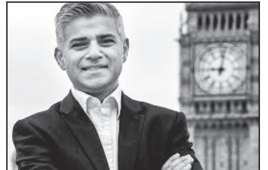
Londono naujasis meras atsakė D. Trump.