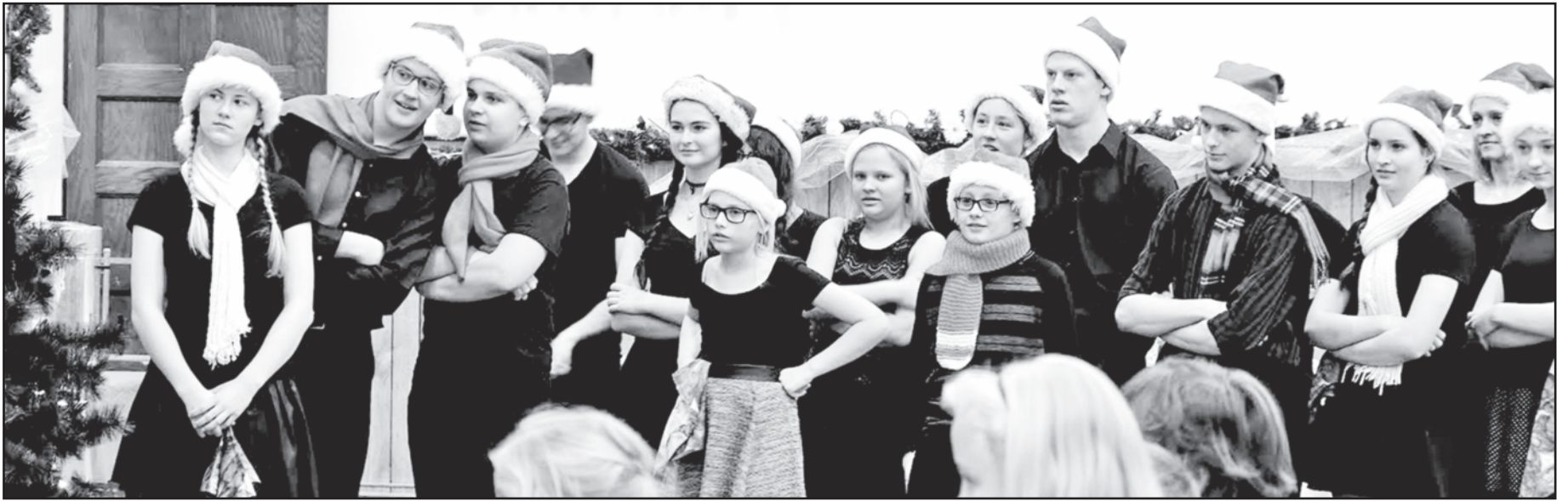
Ar Kalėdų senelis duos „Varpelio“ šokėjams dovanų?