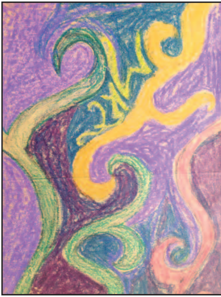
Indrąjos Kirvelaitytės piešinys.