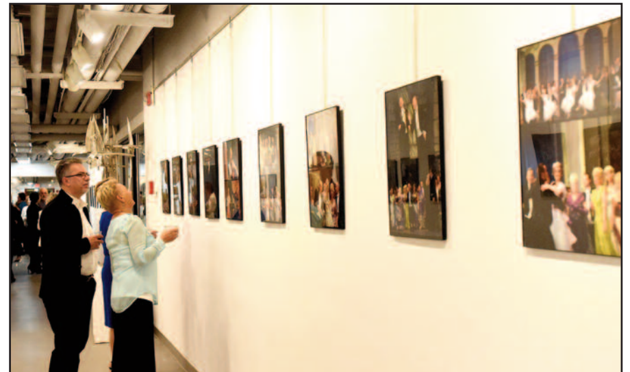
Jono Kuprio Lietuvių Operos Čikagoje nuotraukų paroda