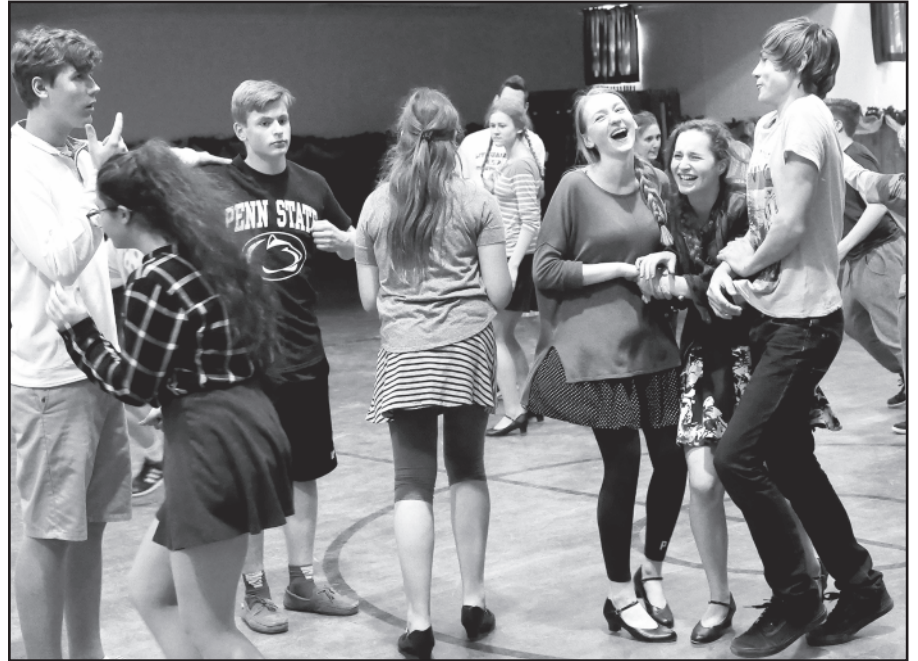
Kartais įvyksta susidūrimų.