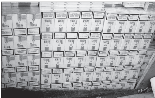
Šešėlinė ekonomika Lietuvoje mažėja, tačiau visvien didžiulė.

Didžiąją dalį nelegalaus alkoholio šalyje sudaro stiprieji gėrimai. Per pastaruosius trejus metus stipriųjų nelegalių alkoholinių gėrimų rinka mažėjo nuo 36 iki 22 proc. Vis dėlto, Lietuvos laisvosios rinkos instituto užsakymu atlikta Lietuvos seniūnų apklausa atskleidė, kad nelegalus alkoholis yra lengvai prieinamas ir plačiai vartojamas. Net 36 proc. teigia, kad jų seniūnijose galima įsigyti nelegaliai platinamo (gaminamo) alkoholio. Penktadalis įsitikinę, kad nelegalus