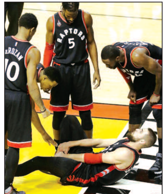
J. Valančiūno trauma tapo milžinišku smūgiu Toronto „Raptors“ komandai.