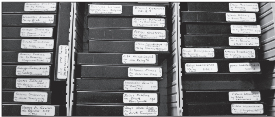
DP stovyklų atsiminimų garso įrašai.