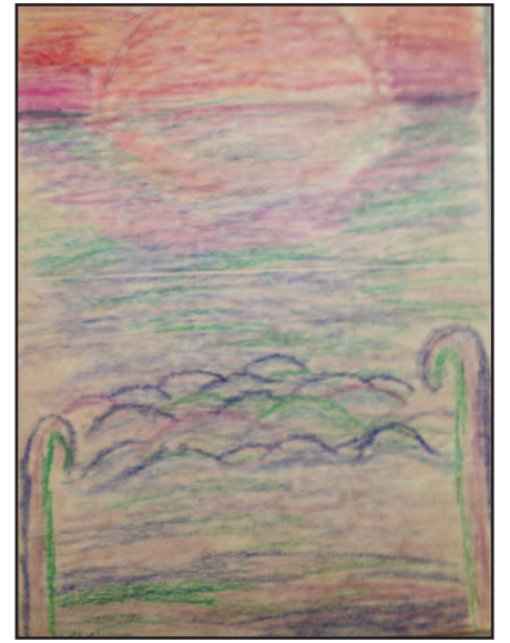
Kovo Kirvelaičio piešinys.