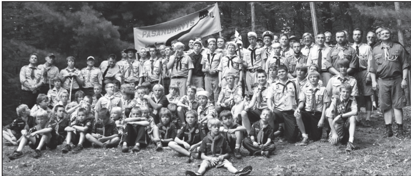
Lituanicos tunto pastovyklė „Pasandravys“ Rako stovykloje.