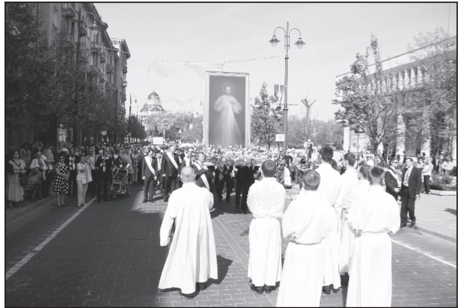
Dievo gailestingumo paveikslas, palikęs savo mažą bažnytelę Dominikonų gatvėje, buvo iškilmingai nešamas procesijoje nuo Seimo rūmų iki Arkikatedros.