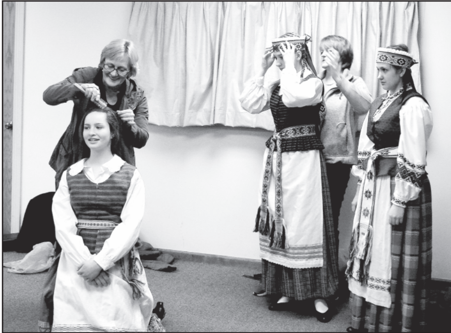
Visos ruošiamės, puošiamės koncertui.

Redaktorė Vaida Lowell • El. paštas: draugas.east.coast@gmail.com