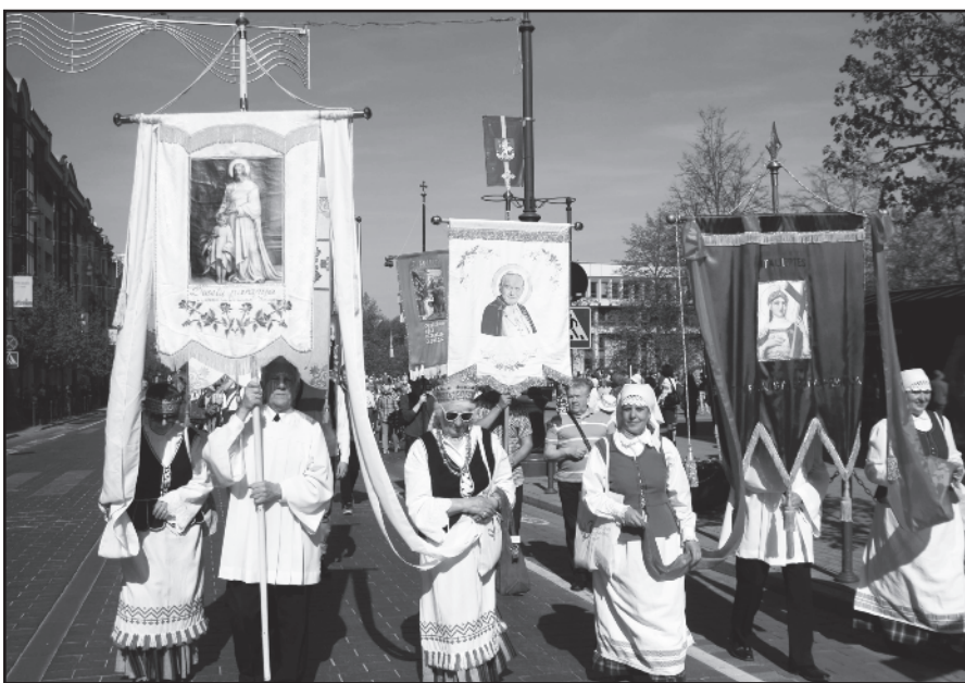
Piligrimai Vilniaus miestui liudijo apie Dievo Gailestingumą.

skaitoma: „Įtakingųjų vaikai ypatingi... o Dievo?... Palaiminti kuriantys taiką – gyvenime vykdančys Dievo valią... Palaiminti mes, kai visuose konfliktuose ne vienas kitam įrodinėjam, trokšdami vienas kitą nugalėti, o drauge ieškom Tiesos – Kristaus... kuris atneša laisvę ir taiką... Palaiminti mes, kai išdrįstam užsikresti dangiškojo Tėvo skausmu, kai jis kantriai kviečia paklydėlį Namu... Taikoje su Dievu gimsta tikroji mūsų taika...“