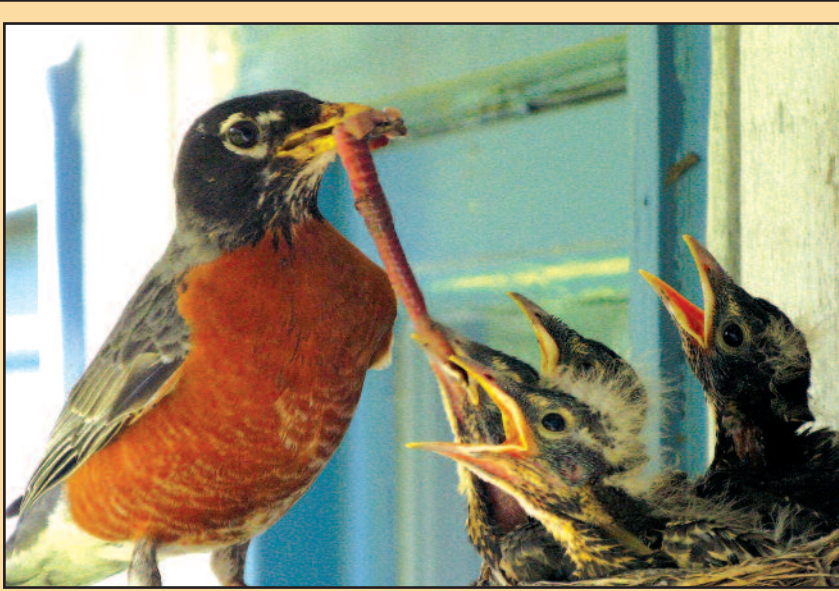
„Kova dėl sliekų“