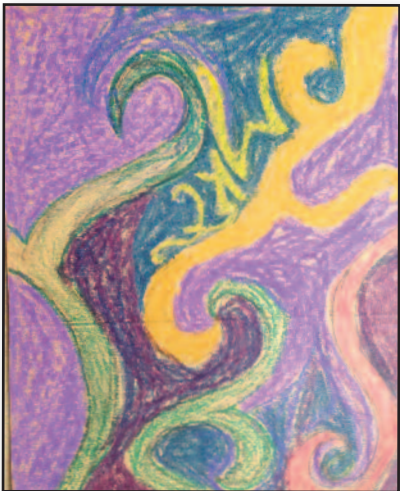
Šeštokų pažintis su Čiurlionio kūryba – 8 psl.