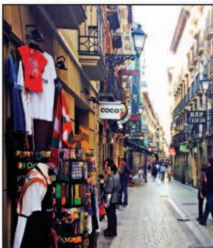
Miestas, į kurį svajoji sugrįžti – 7 psl.