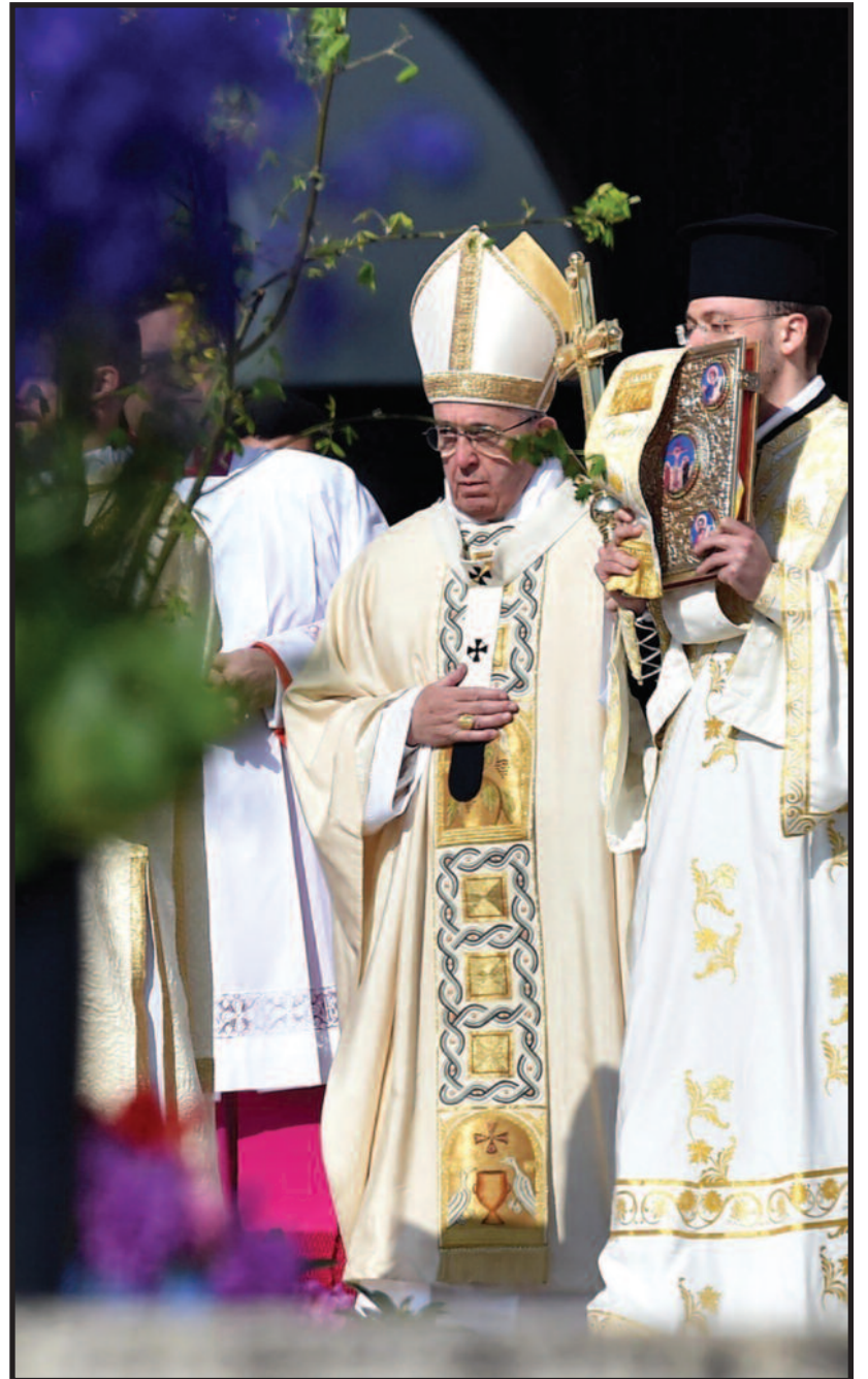
Velykinis popiežiaus palaiminimas.

Kiek anksčiau, Velyknakčio pamoksle, popiežius Pranciškus stengėsi įkvėpti vilties po teroru paženklintos savaitės Europoje ir ragino krikščionis nepasiduoti baimei bei pesimizmui. Jis ragino „neleisti tamsai ir baimei išblaškyti ir užimti mūsų širdis“. Velyknakčio Mišių metu popiežius taip pat tradiciškai pakrikštijo 12 suaugusiųjų iš Kinijos, Pietų Korėjos ir kitų pasaulio šalių. – 2 psl.