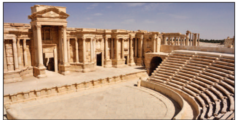
Šis antikinis amfiteatras išliko tik todėl, kad čia buvo vykdomos viešos egzekucijos, galvų nukirsdinimai..

Palmyra („Draugo“ info) – Sirijos vyriausybės pajėgos su Rusijos oro pajėgų pagalba atgavo Palmyros miestą. Tai buvo rimta pergalė prieš „Islamo valstybę“ (IS), kuri dykumoje esantį miestą kontroliavo nuo praėjusių metų gegužės mėnesio.