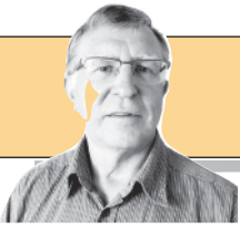
Parengė Vitalius Zaikauskas