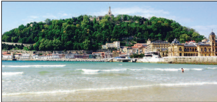
San Sebastian panorama primena Rio de Janeiro.

Baruose prie „pintxos“ daugelis barmenų jums pasiūlys išgerti kelias