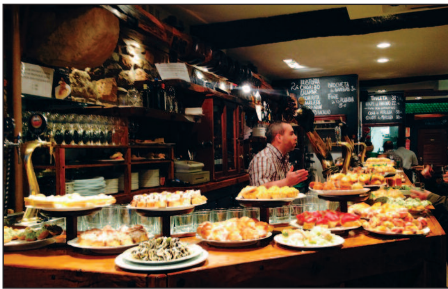
Save gerbiantis gourmet per vakarą aplanko ne vieną pintxos barą...

taures vietinio putojančio balto vyno „txakoli“. Prieš išeinant kartais įpila dar vieną – paskutinę taurę baro sąskaita. Įdomu žiūrėti, kaip teatrališkai barmenas pila vyną – iš labai aukštai, kiek tik gali pasiekti, kad „pravėdintų“ gėrimą. Pro šalį nenuityška nė vienas lašas, vynas plona čiurkšle patenka tiesiai į taurę.