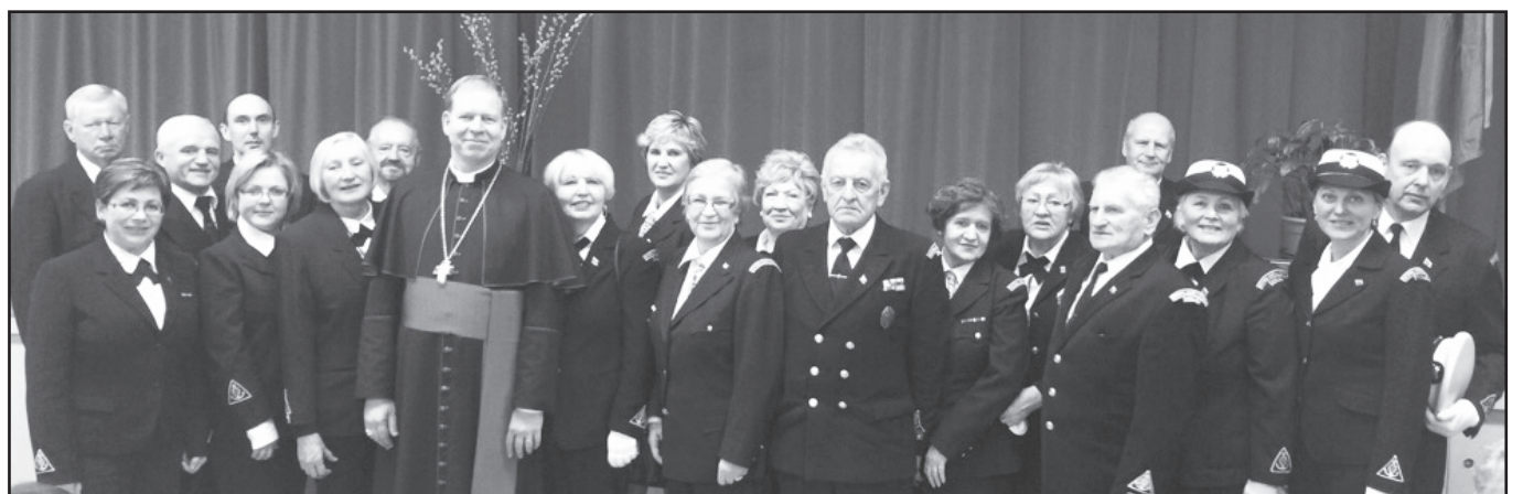
Lietuvos šaulių sąjungos išeivijoje nariai su Vilniaus arkivyskupu Gintaru Grušu.