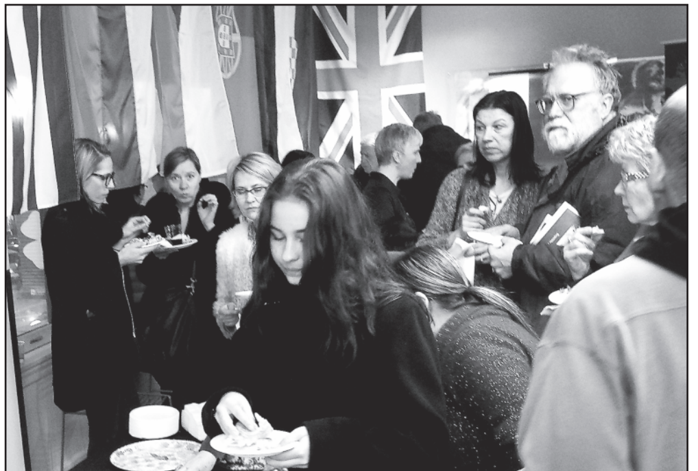
Filmo „Dainų šalis“ režisierė Aldona Watts