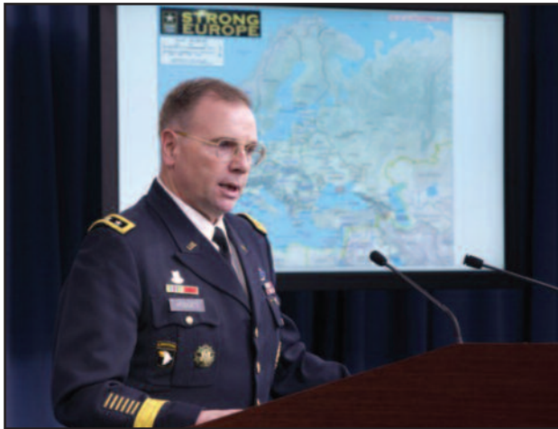
Ben Hodges pažadėjo sustiprinti karinius pajėgumus Lietuvoje.

tijoje ir Lenkijoje yra dislokuota po kuopą amerikiečių karių. Šios pajėgos atsiųstos reaguojant į Rusijos veiksmus Ukrainoje.