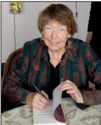
Nugalėti ligą gyvenimu – 5 psl.