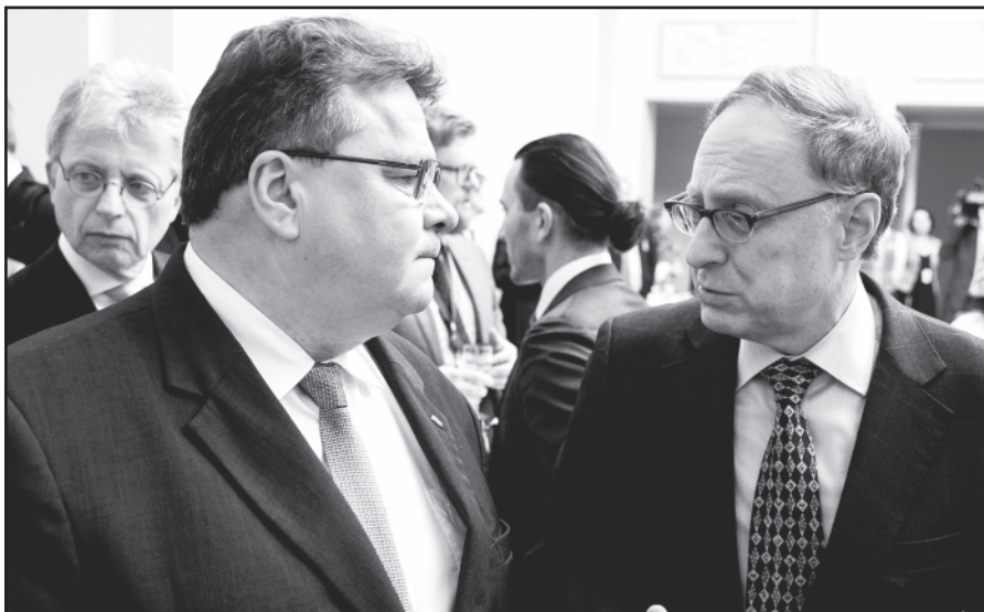
Ministras Linas Linkevičius su NATO generalinio sekretoriaus pavaduotoju Alexander