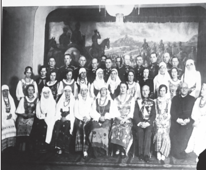
Renginio dalyviai pamatė ir įdomių fotografijų.