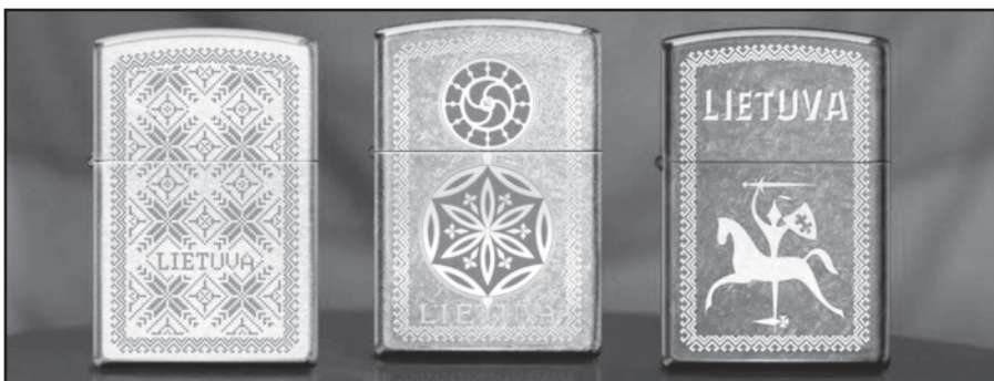
Kolekciniai „Zippo“ žiebtuvėliai.