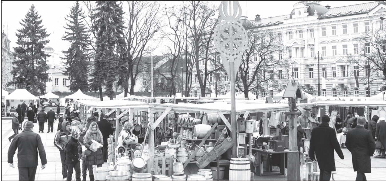
Visą savaitgalį Vilniaus centre – šurmulinga ir linksma.