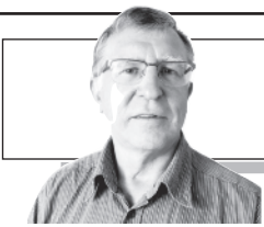
Parengė Vitalius Zaikauskas