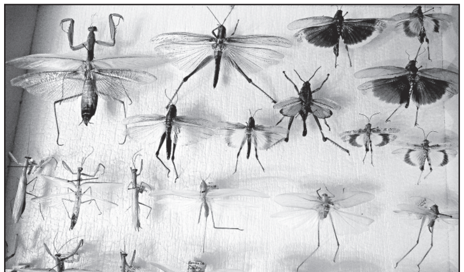
Jono žiogų „archyvas”.