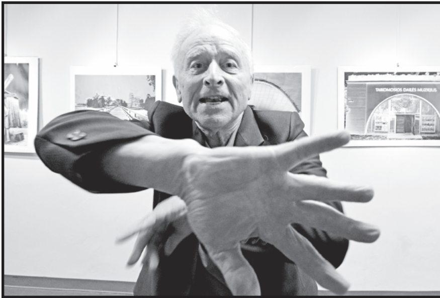
Algimantas Kezys: Kam fotografuoti tai, kas jau įamžinta!

– Pirmos nepriklausomybės laikais Lietuvoje buvo po-