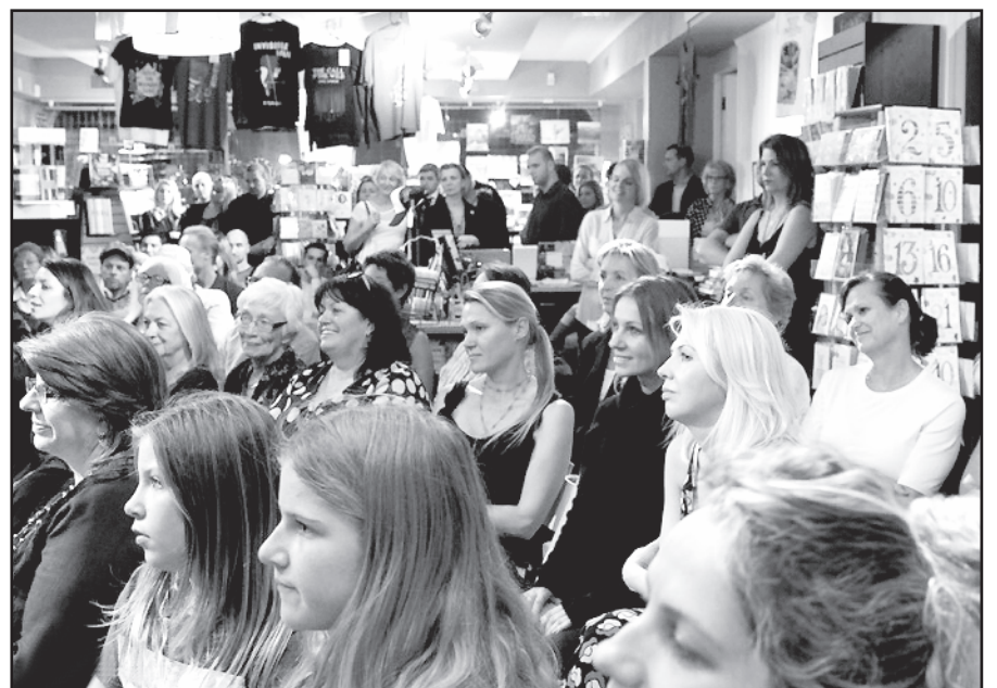
„Salt to the sea“ knygos pristatymo dalyviai.