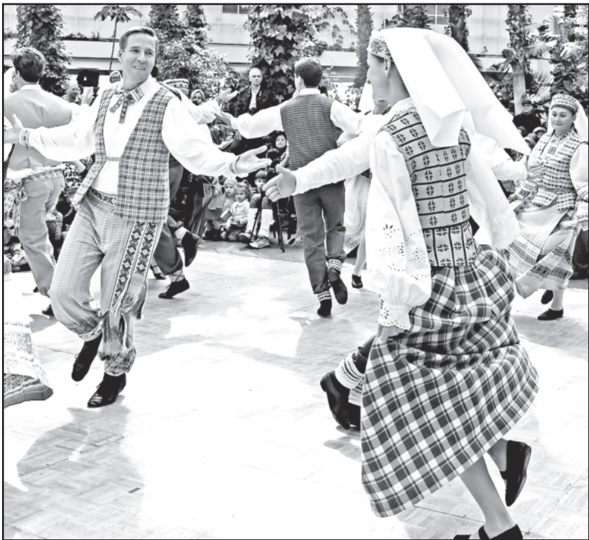
Praėjusių metų šventės Navy Pier akimirka.

„Kaziuko mugė – pavasario šauklys. Šimtmečius skaičiuojančioje šventėje atgimsta pasididžiavimas savo šalies spalvingomis tradicijomis ir senaisiais amatais. Mugė vilniečius ir miesto svečius džiugina savo šiluma ir pakilia nuotaika“, – sakė mugėje apsilankiusi Lietuvos prezidentė Dalia Grybauskaitė. Šalies vadovės teigimu, gausus dalyvaujančių tautodailininkų ir amatininkų iš Lietuvos ir kaimyninių šalių skaičius įrodo, kad senosios tradicijos yra gyvos.