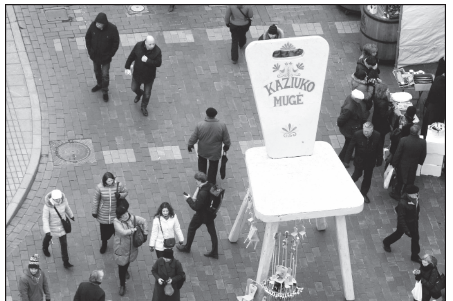
Mugė iš paukščio skrydžio.