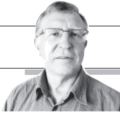
Parengė Vitalius Zaikauskas