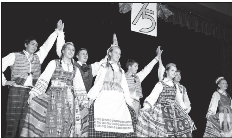
Nuotaikingas šokių ansamblio „Spindulys“ pasirodymas.