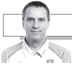
Parengė Dainius Ruževičius