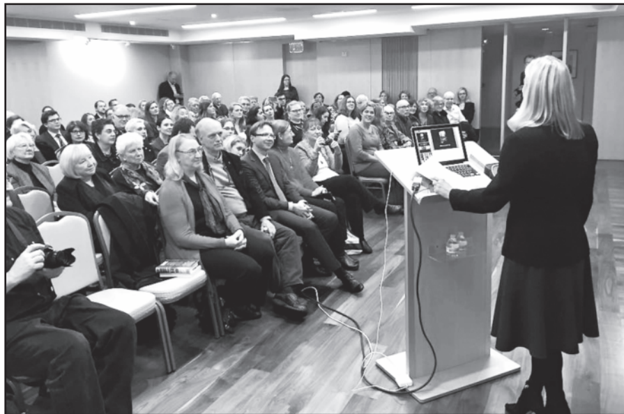
Rūta Šepetys pasakoja apie savo naują romaną gausiai į LR ambasadą susirinkusiems svečiams.