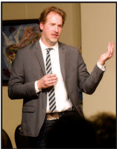
Susitikimų Čikagoje įspūdžiai – 7 psl.