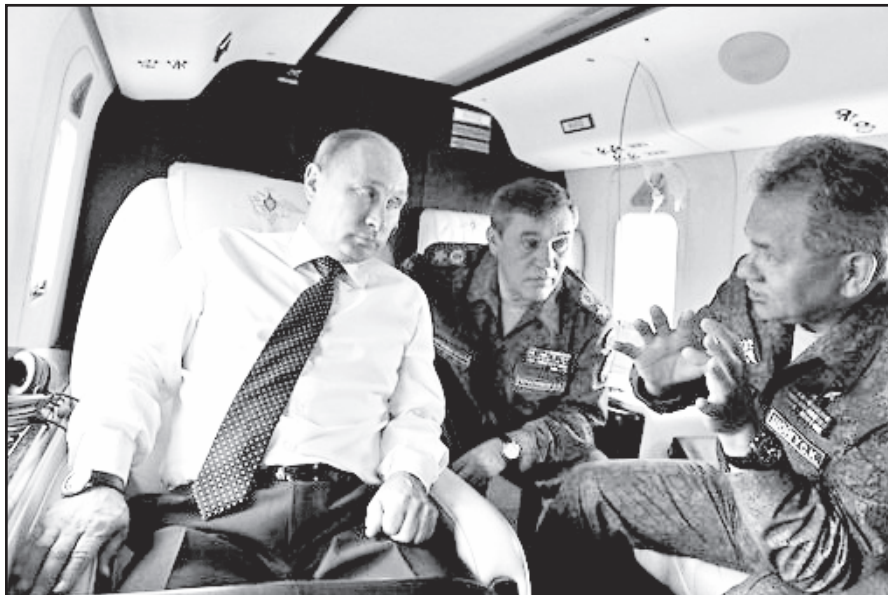
NATO rytinis sparnas yra pažeidžiamas

Maždaug septynių brigadų jėga, įskaitant ir tris itin gerai ginkluotas