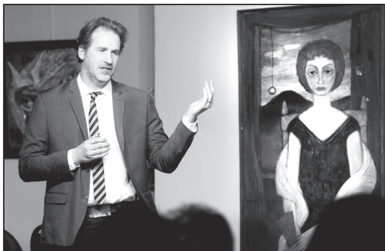
Režisierius Vincas Sruoginis