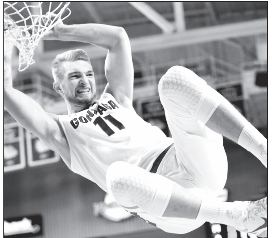
Domantas Sabonis gali pelnyti taškus iš keistų padėčių po krepšiu.

Domantas Sabonis kenčia čiurnos skausmus, kurie riboja devyniolikmečio žaidimą, tačiau tai lietuviui netrukdo siautėti NCAA studentų krepšinio lygoje.