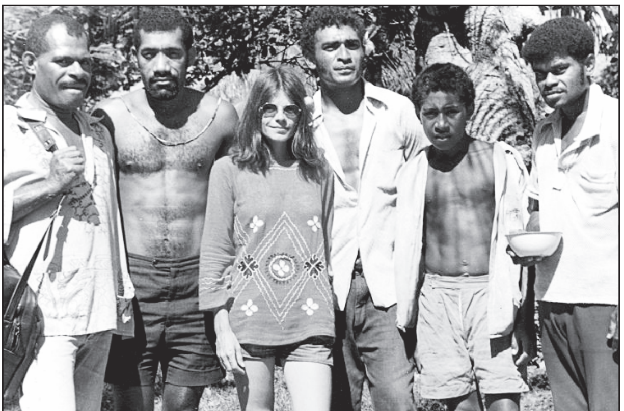
Fiji saloje stilinga ilgakojė mergina darė įspūdį vietos vyriškiams. 1972

– Bet aš ir pati niekada nebuvau labai geras vaikas. Išėjau iš tėvų namų ir pradėjau gyventi savarankiškai, kai tik suėjo aštuoniolika. Namie man buvo sunku, tėvai dažnai kraustėsi, kas porą metų turėdavau adaptuotis vis naujoje mokykloje, be to, jaučiausi visai kitokia nei jie – buvau jau iš kartos, kuri augo ir gyveno su šūkiu: „Sex & Drugs & Rock & Roll.“ Tėvams tada buvo svarbu lietuviškumą, o man – būti „amerikone“: laisva, hipiška, protestuojančia prieš karą ir neteisybę, pasinėrusia į patinkančią muziką. Buvau kaip reikiant pasiutusi... Turbūt todėl ir labai jauna ištekėjau – kad galėčiau gyventi savo gyvenimą.