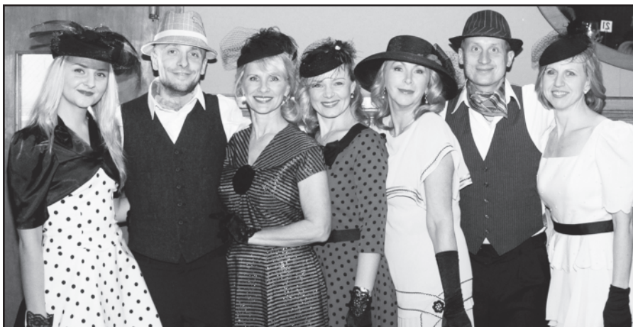
Stilingi šokių grupės „Retro“ dalyviai.