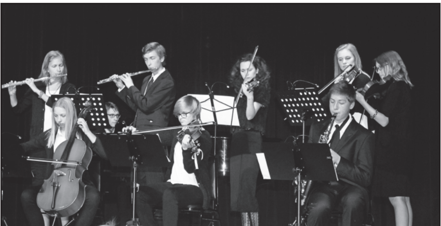
Programoje dalyvavo ir jaunieji ansamblio „Gintarėliai“ muzikantai.