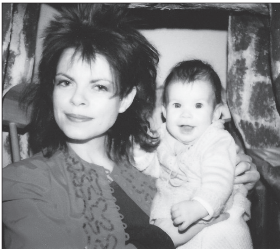
Tuomet, kai motinystė visai netrukė koncertinei veiklai. New Yorkas, 1985 m.