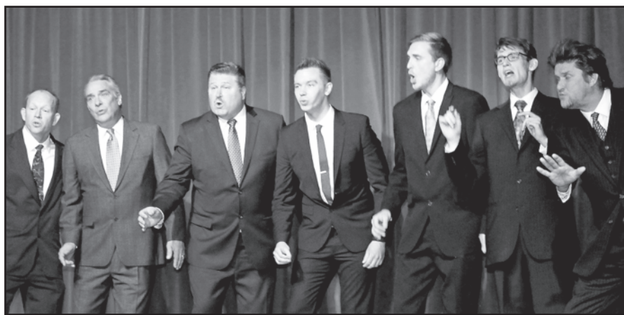
Koncertuoja vyrų oktetas „Tolimi aidai“