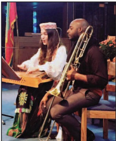
„Pabūkim kartu“ suburia Rochesterio lietuvius – 5 psl.