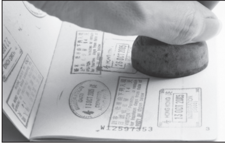
Svarstoma registruoti atvykstančius į Lietuvą.