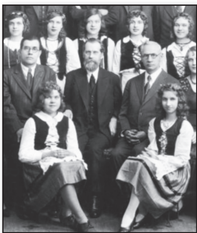
Prof. M. Biržiška pas JAV lietuvius – 11 psl.