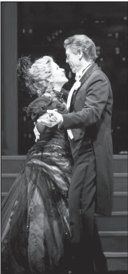
Renée Fleming ir Thomas Hampson

Lyric Opera pateikė žiūrovams spalvingą, šventinį, tarsi šampanas trykštantį spektaklį. Pagrindinį Hannos Glawari vaidmenį atliko operos diva, nuostabi Renée Fleming, nuo pirmųjų pasirodymo scenoje akimirku užvaldžiusi žiūrovų dėmesį savo Franz Lehar legendinio personažo interpretacija. Spektaklio metu nebuvo kada