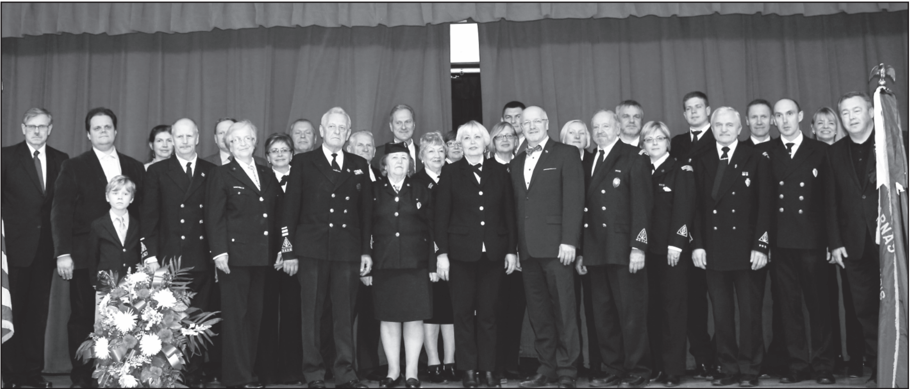
Krašto apsaugos ministras J. Olekas su LŠSI nariais.