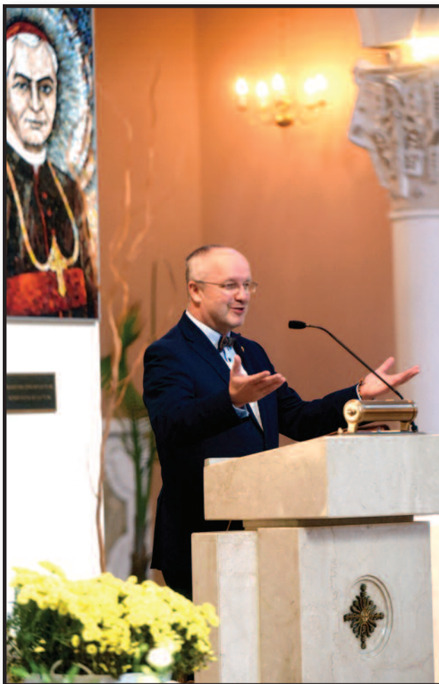
Po Mišių Švč. Mergelės Marijos Gimimo bažnyčioje ministras Juozas Olekas sveikina susirinkusiuosius.

Sekmadienį ministras Juozas Olekas, lydimas LR