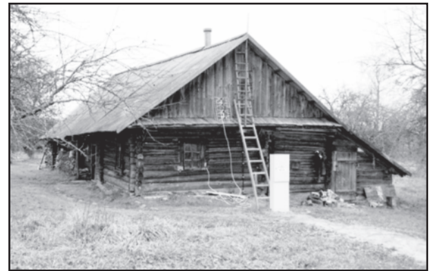
Internetas nebestebina atokioje kaimo vietovėje.

Europos Komisijos paskelbtame konkurse Europos plačiajuosčio interneto apdovanojimams pelnyti projektas „Kaimiškųjų vietovių informacinių technologijų plačiajuosčio tinklo RAIN plėtra“ (RAIN-2) įvertintas „Socialinio ir ekonominio poveikio bei prieinamumo“ nominacija. Tai paaiškėjo Briuselyje vykusioje apdovanojimų ceremonijoje.