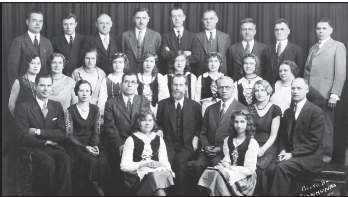
Vilniui vaduoti sąjungos pirmininkas Mykolas Biržiška su JAV lietuviais. Čikaga, 1931 m. balandžio mėn.