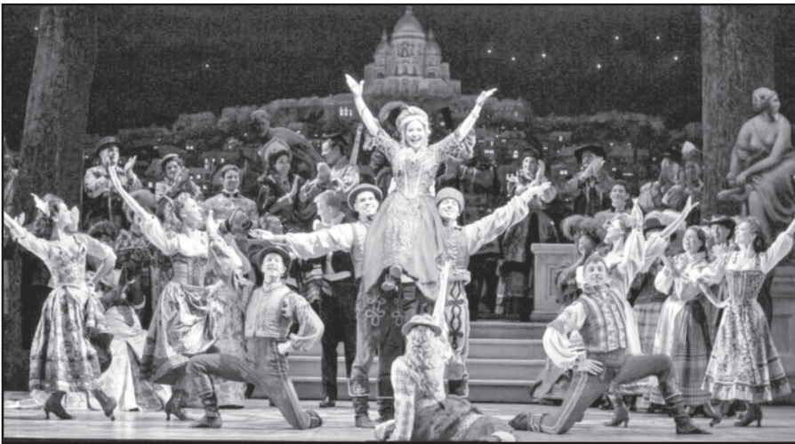
Scena iš spektaklio. Hanna – Renée Fleming.