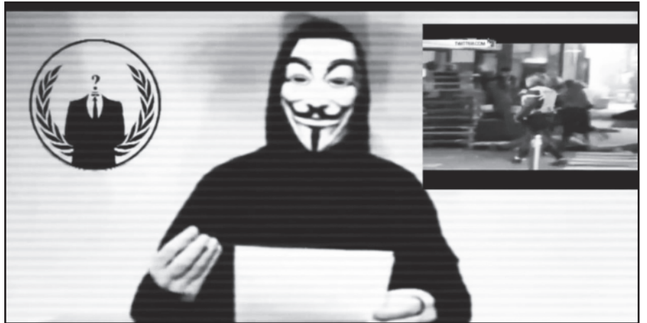
Hakeriai imsis teroristų.