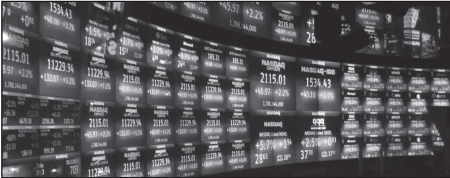
„Nasdaq“ savo centrą atidarė ne kur kitur pasaulyje, bet Vilniuje.

Vilnius (Prezidentūros info) – Vilniuje spalio 13 dieną iškilmingai atidarytas „Nasdaq“ technologijų ir verslo kompetencijų centras, kuriame kuriamos pasaulio finansų rinkoms skirtos šiuolaikinės technologijos ir sprendimai, valdomos vertybinių popierių rinkų, finansų apskaitos, IT sistemų administravimo ir kitos operacijos.