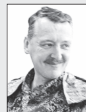
Liudininkų parodymai: Buvusio Rusijos karininko Igorio Girkino žinutė buvo trumpam pasirodžiusi socialiniuose tinkluose – jis gyrė savo karius esą numušius Ukrainos

Atstatytą įvykių eigą galite stebėti: https://www.youtube.com/watch?t=1013&v=KDILeyT9spI