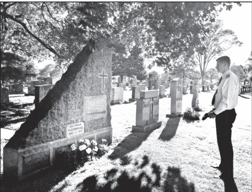
Prie gen. Plechavičiaus kapo Šv. Kazimiero kapinėse Čikagoje.