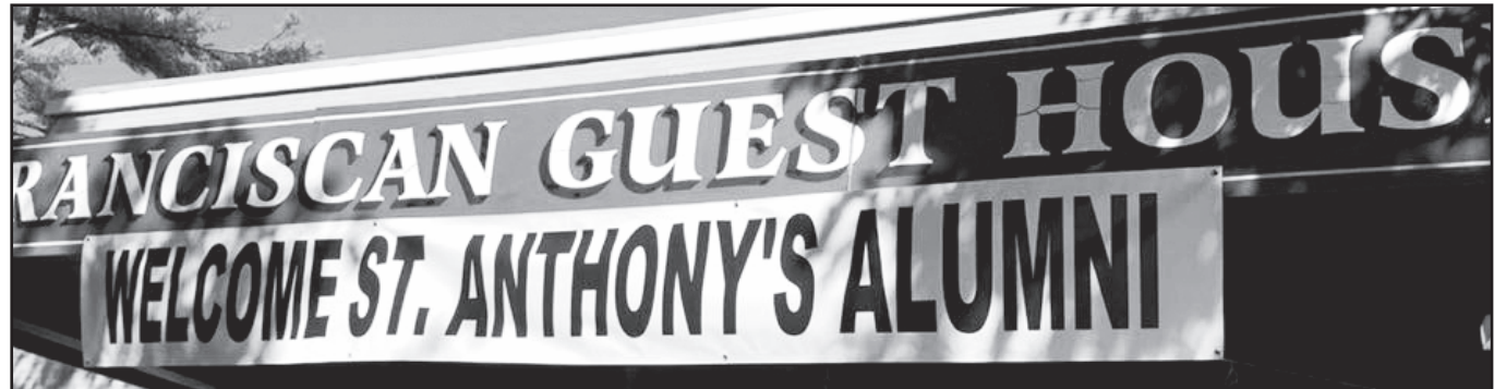
Susirinkusius pasveikino iškaba: „Sveiki sugrįžę, Šv. Antano gimnazijos studentai!”

Nepaisant kuriais metais teko lankyti gimnaziją, buvo aišku, kad visų kartų išdaigos buvo tos pačios! Vyresnieji studentai visuomet „išnaudavo” ir pasijuokdavo iš jaunesnių, ypač pirmų metų gimnazistų. Pavyzdžiui, pirmos gimnazijos klasės mokiniai dažnai turėjo slaptai vykti į mies-