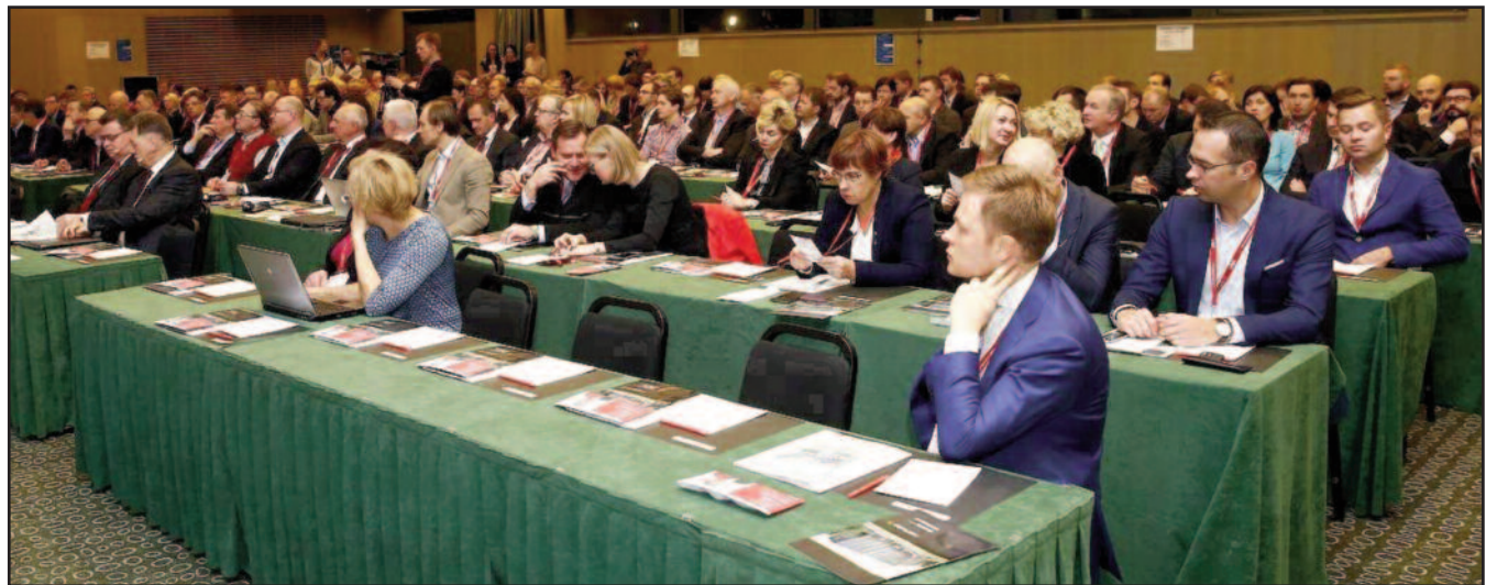
Konferencijos „Verslas 2016“ dalyviai

NEWSPAPER - DO NOT DELAY - Date Mailed 10-14-15