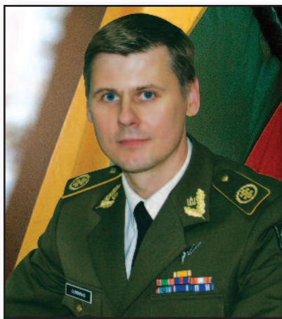
L. Gumbinas: Esame viena šeima – 10 psl.