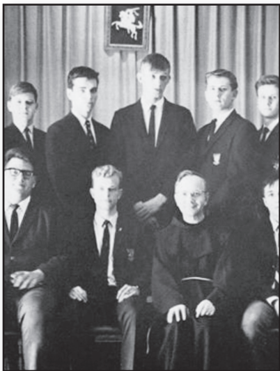
Susitikimas po daugelio metų – 4 psl.