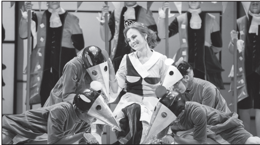
Pelenė – Isabel Leonard