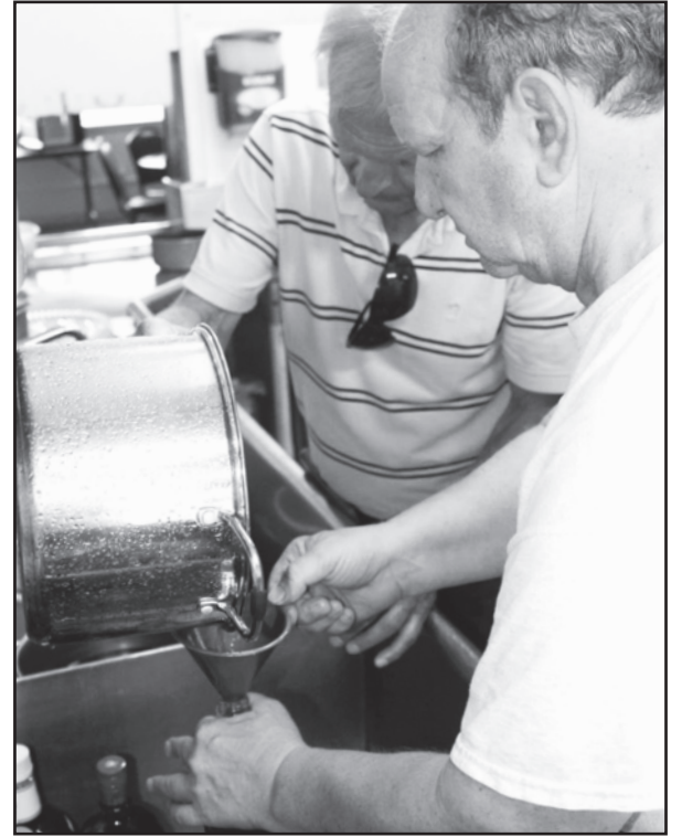
Be baimės užsitraukti mokytojų nemalonę, gimnazistai gamino krupniką gimnazijos patalpose.