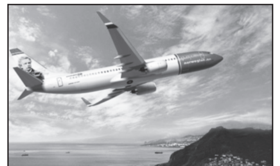
Bus galima pigiai skristi iš JAV į Europą.

Nors nemažai tokių skrydžių bendrovių kaip „Deutsche Lufthansa AG” siūlo klientams šimtus kryptų su persėdimais, Norvegijos bendrovė siekia ambicingesnio tikslo – nepertrau-