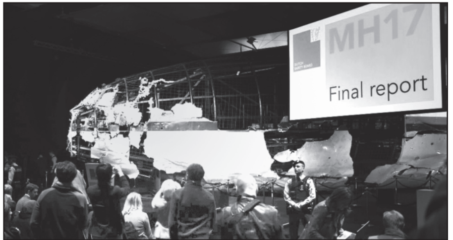
Pristatoma tyrimo ataskaita.